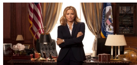
Téa Leoni comme Elizabeth McCord