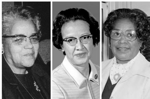
De gauche à droite : Dorothy Vaughan, Katherine Johnson et Mary Jackson

Les figures de l'ombre , réalisé par Theodore Melfi et écrit par Melfi et Allison Schroeder, est un film basé sur