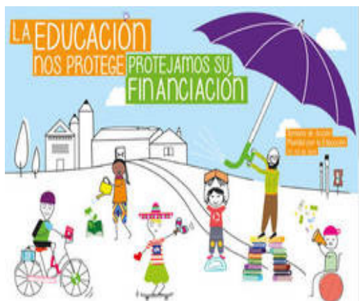
Imagen del díptico informativo de la Campaña Mundial por la Educación y la Cooperación Española