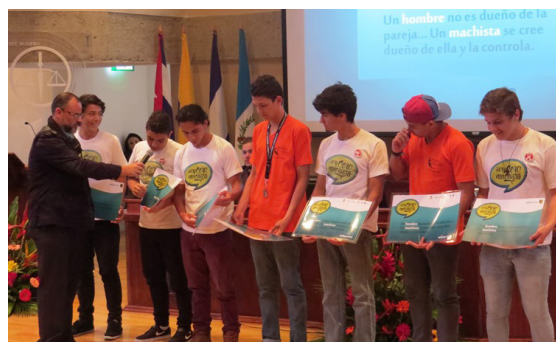
Participantes del taller "Vinculando a los varones con el logro de la igualdad de género"

El informe contribuirá a sostener el compromiso adquirido por los actores en el trabajo por la igualdad de género, y promoverá iniciativas futuras por parte de UNESCO y sus socios en el ámbito de las masculinidades.