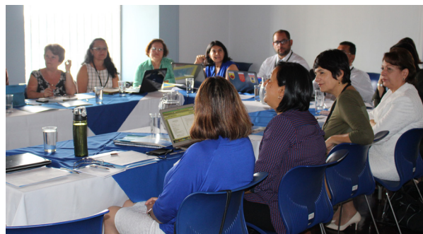
Consulta sub-regional sobre formación inicial docente en educación para la ciudadanía