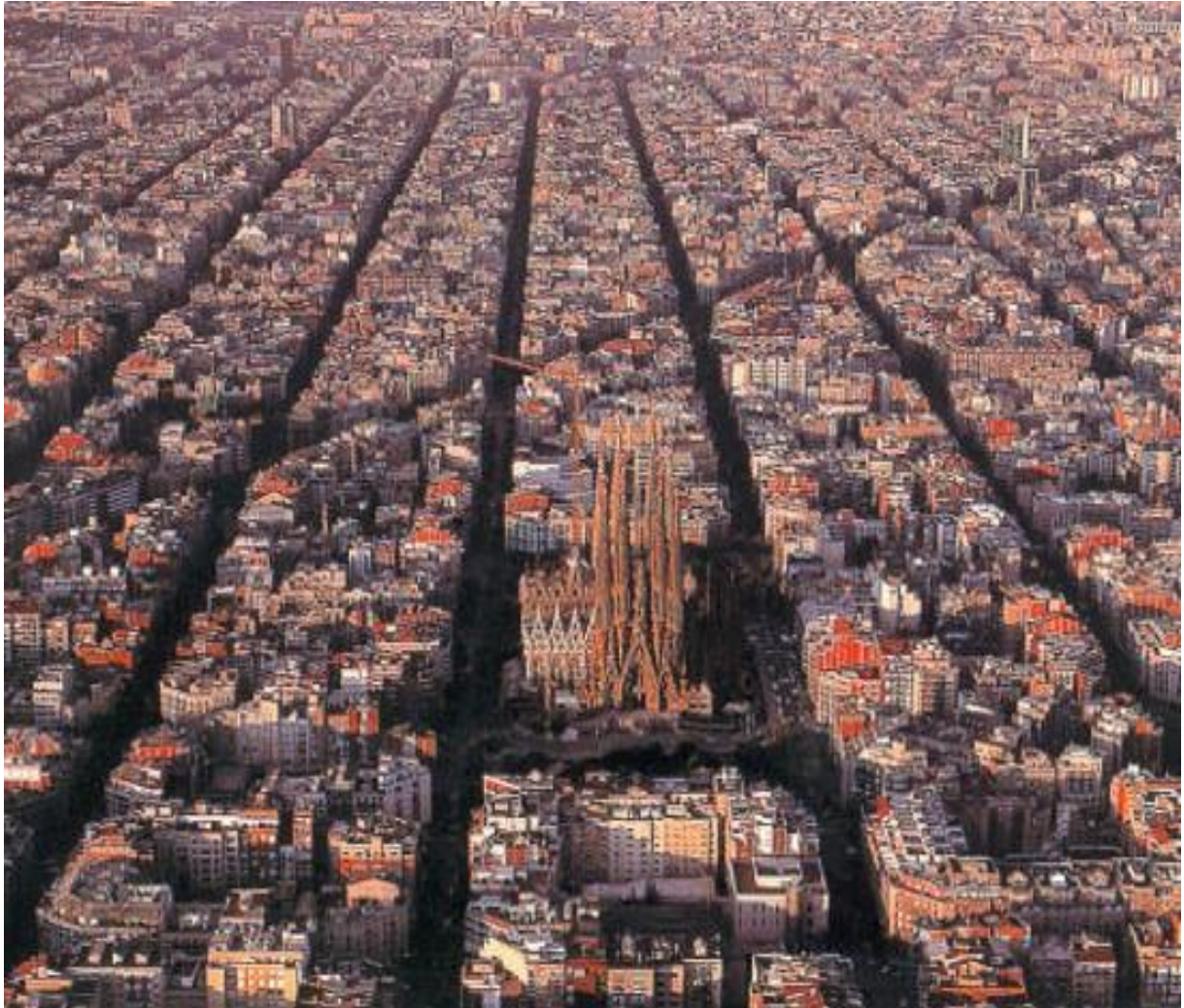
Perspective de la ville de Barcelone, Espagne