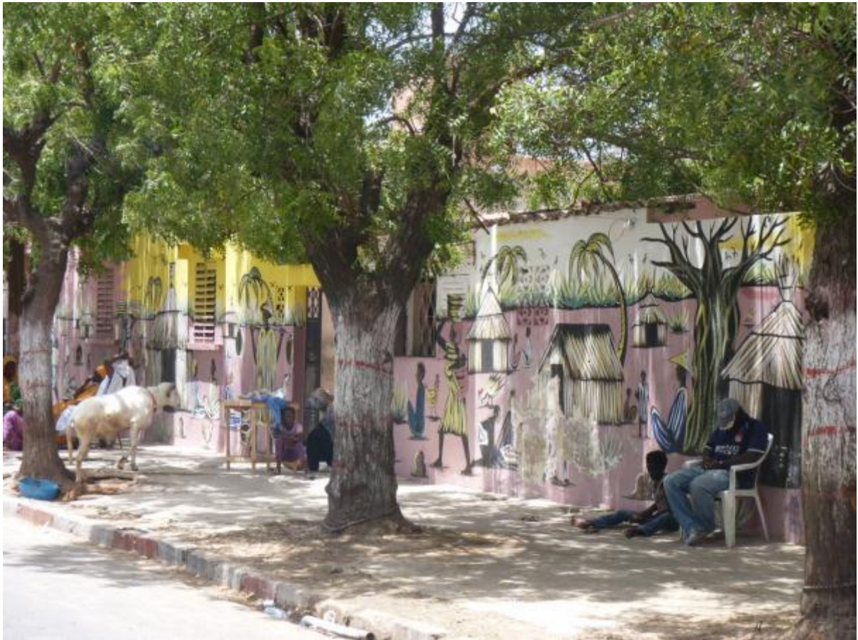
Dakar, Sénégal