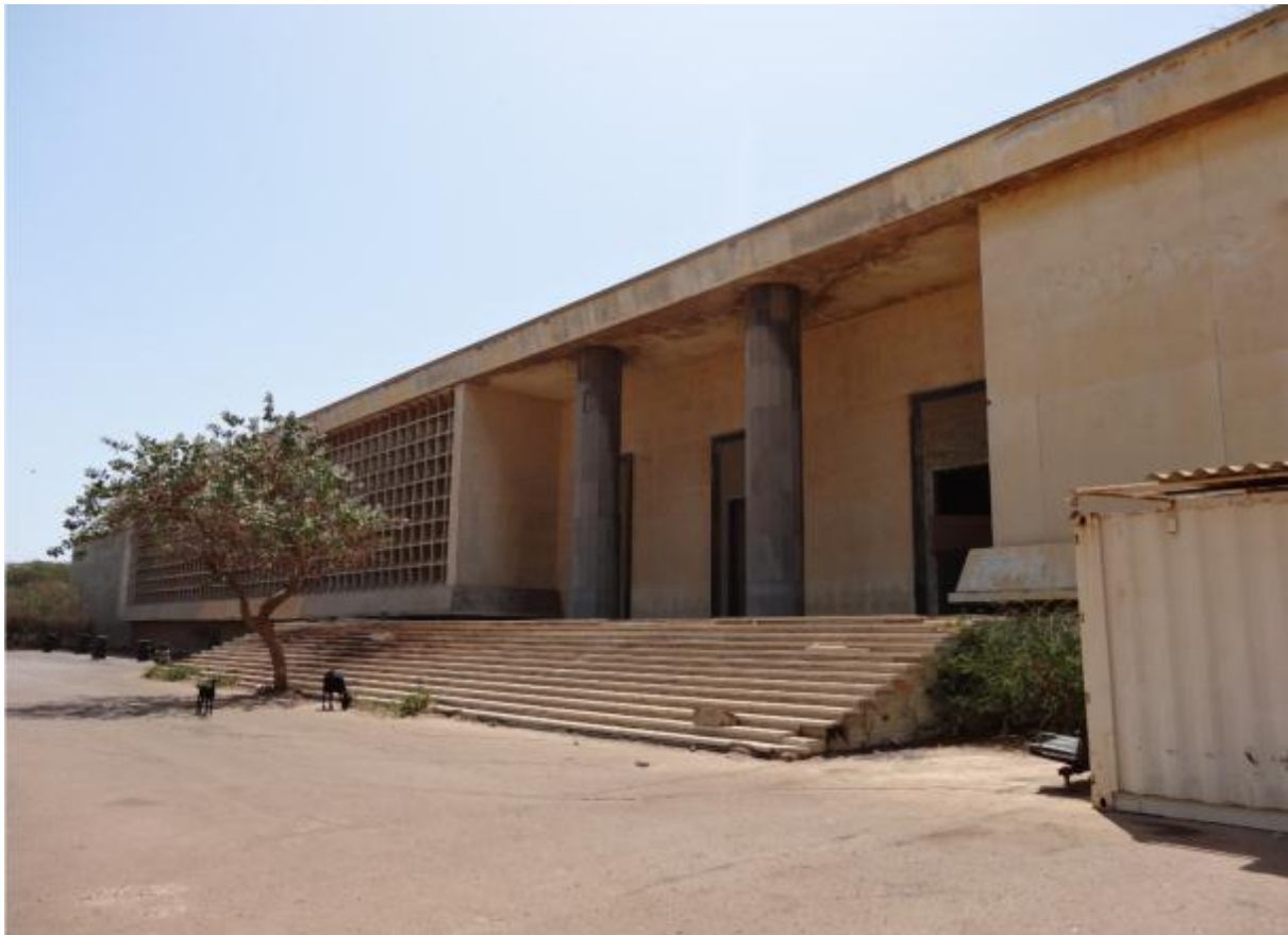
Ancien Palais de justice, Dakar- Plateau, Sénégal