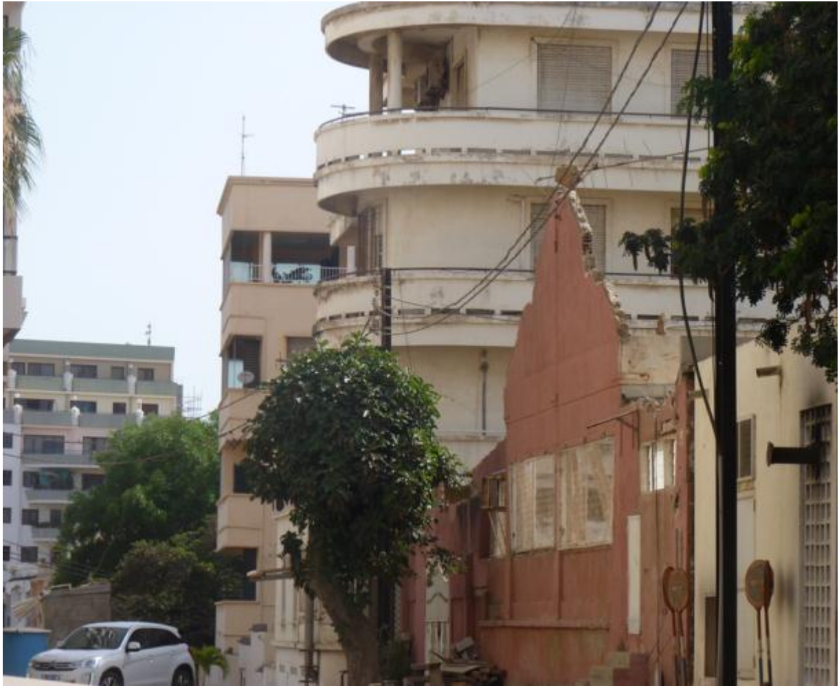
Perspective ancienne et nouvelle construction, Dakar- Plateau, Sénégal