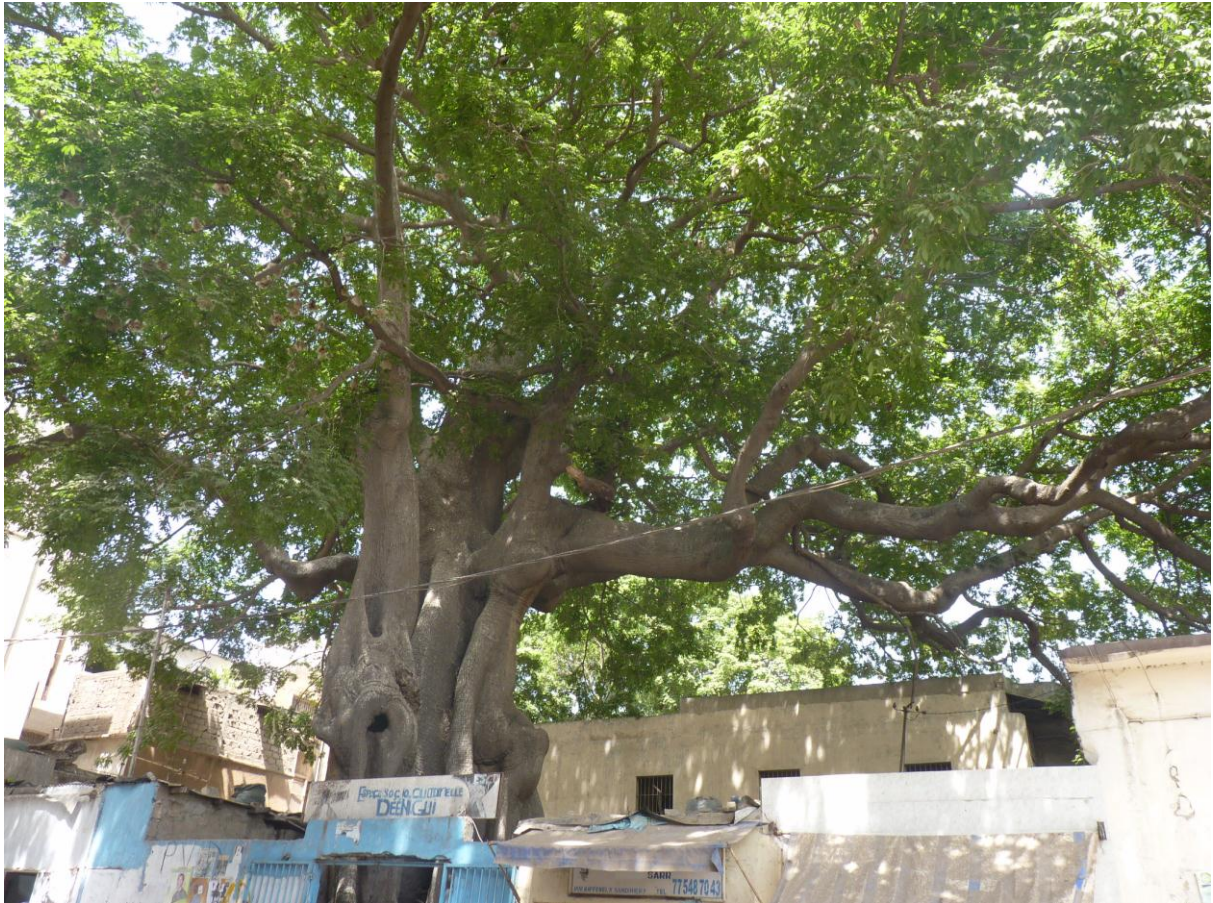
Arbre dans un quartier Lébou, Dakar-Plateau, 2014. Sénégal