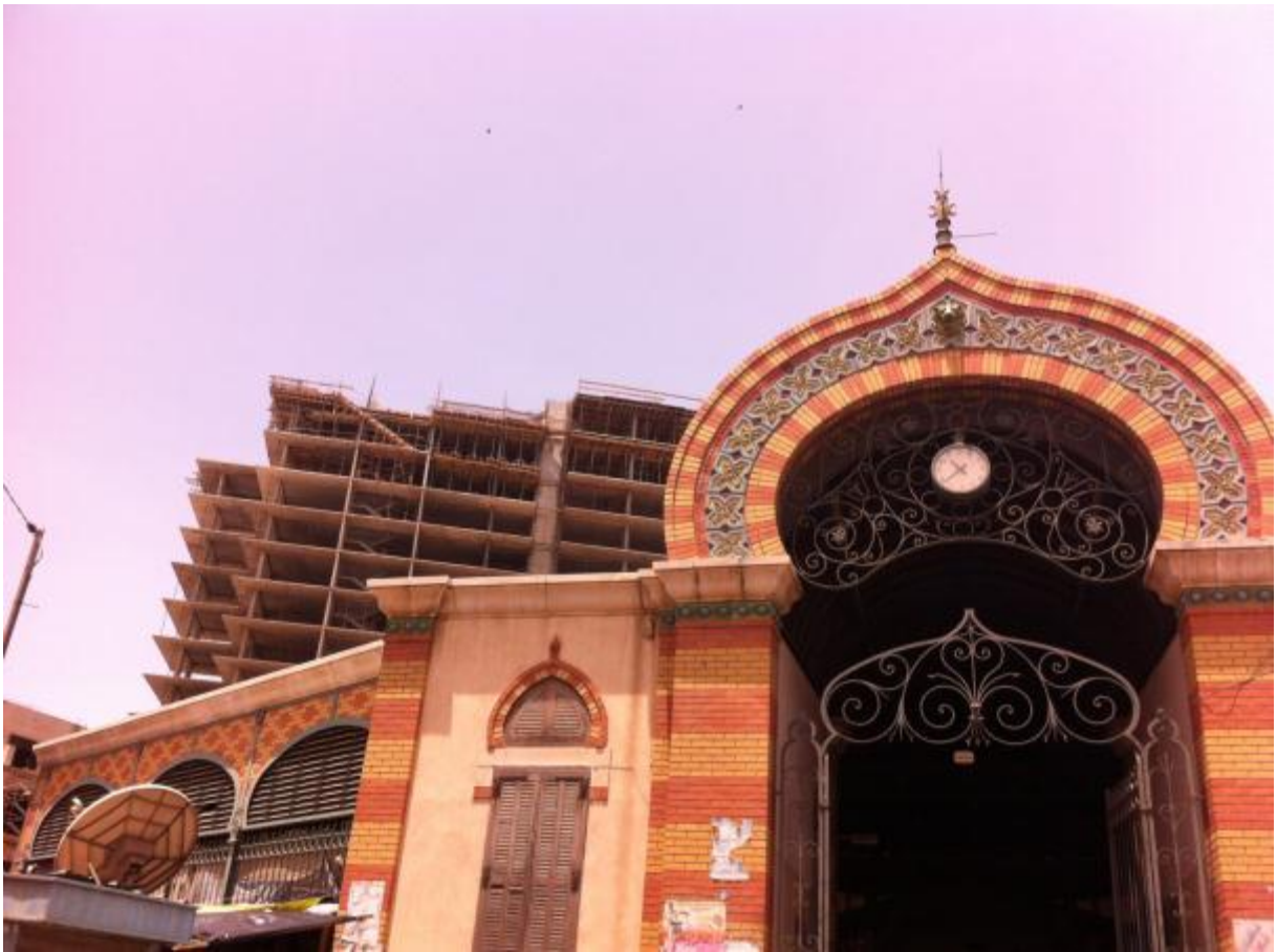
Vue du marché centenaire de Kermel dans le cœur historique de Dakar, juillet 2014. Sénégal