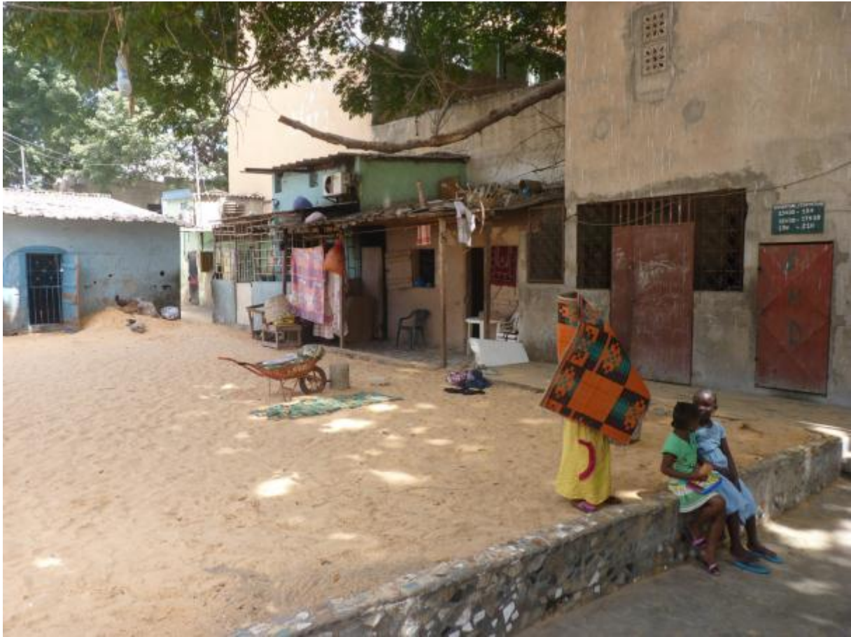
Cour intérieure Lébou,, Dakar, Sénégal