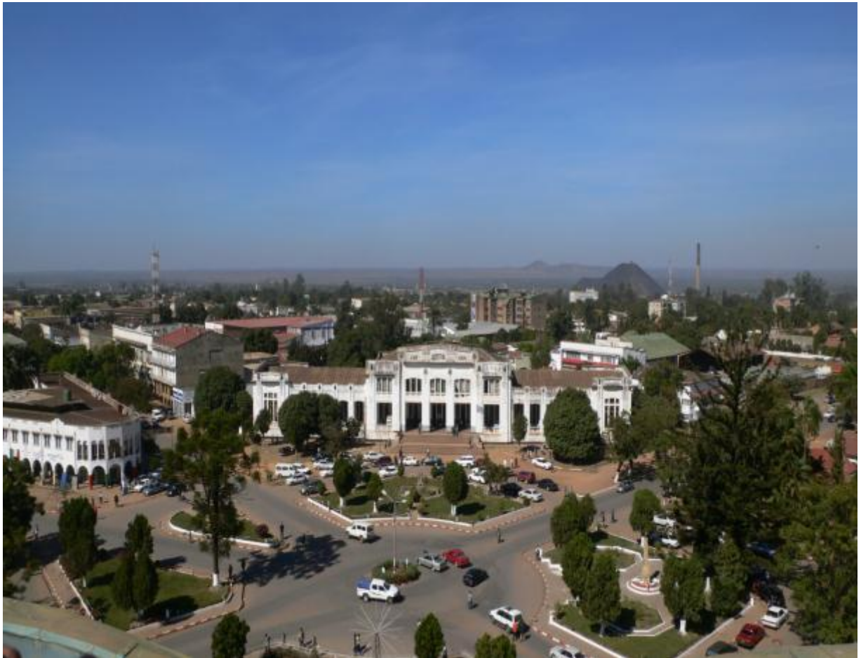
Vue du cœur historique de Lubumbashi (République Démocratique du Congo). Cette partie de la ville forme une remarquable cité-jardin.