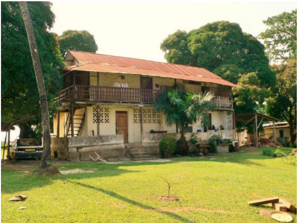
A Libreville (Gabon), le quartier « Baraka » et ses vieilles maisons est l'un des pôles historiques de la ville.