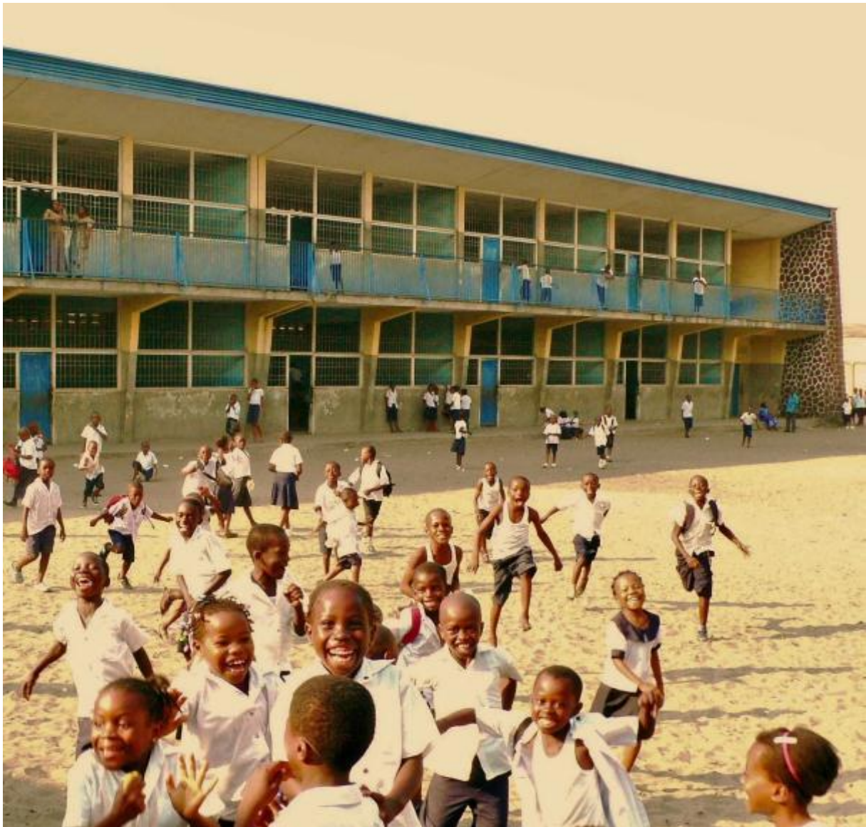
La préservation du patrimoine passe aussi par la sensibilisation des plus jeunes qui suivent parfois leur scolarité dans des écoles héritières de la modernité architecturale. École à Kinshasa et sensibilisation des jeunes, RDC.