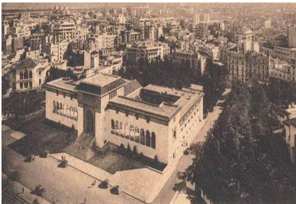
Palais de Justice 1940, Casablanca