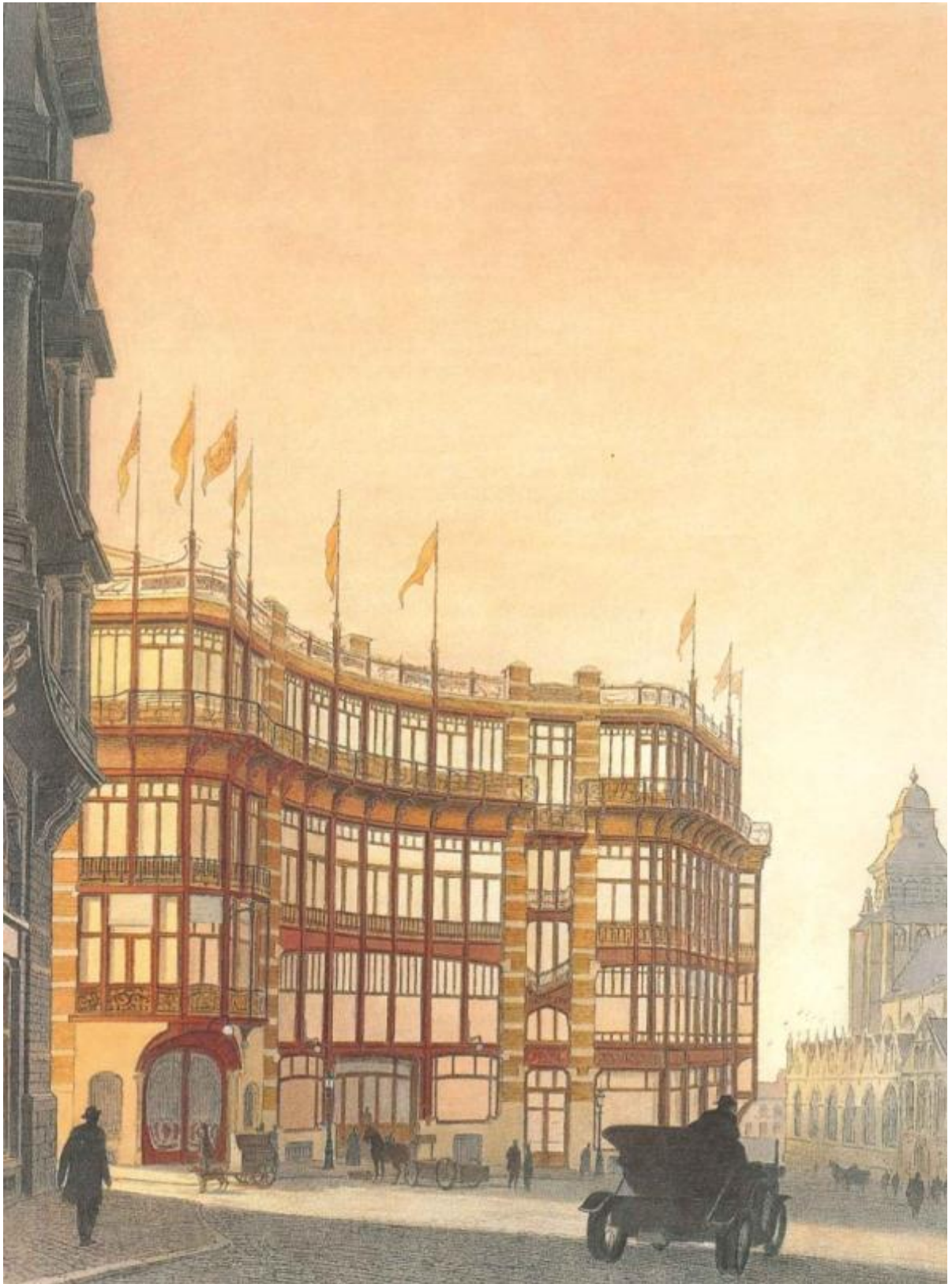
La Maison du Peuple, détruite en 1965 au centre de Bruxelles, Belgique Dessin de Fr Schuiten