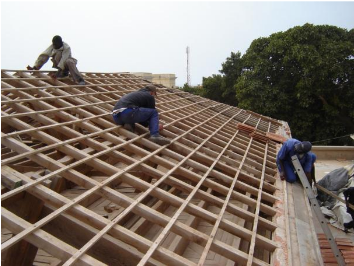
Saint-Louis, Sénégal Couverture de l'Assemblée territoriale du Fleuve, chantier-école IPW-DPC, 2006-09