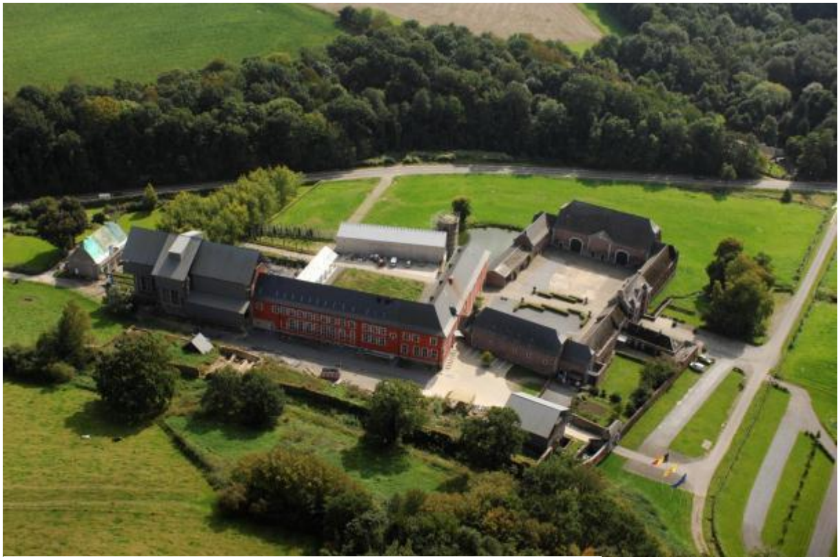
Site du centre de formation de La Paix-Dieu, à Amay, Institut du Patrimoine wallon. Belgique