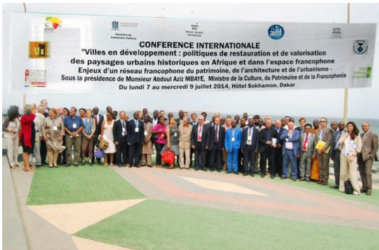
Photo de groupe de la conf rence Villes et patrimoine Dakar, S n gal   WALLONIES-BRUXELLES