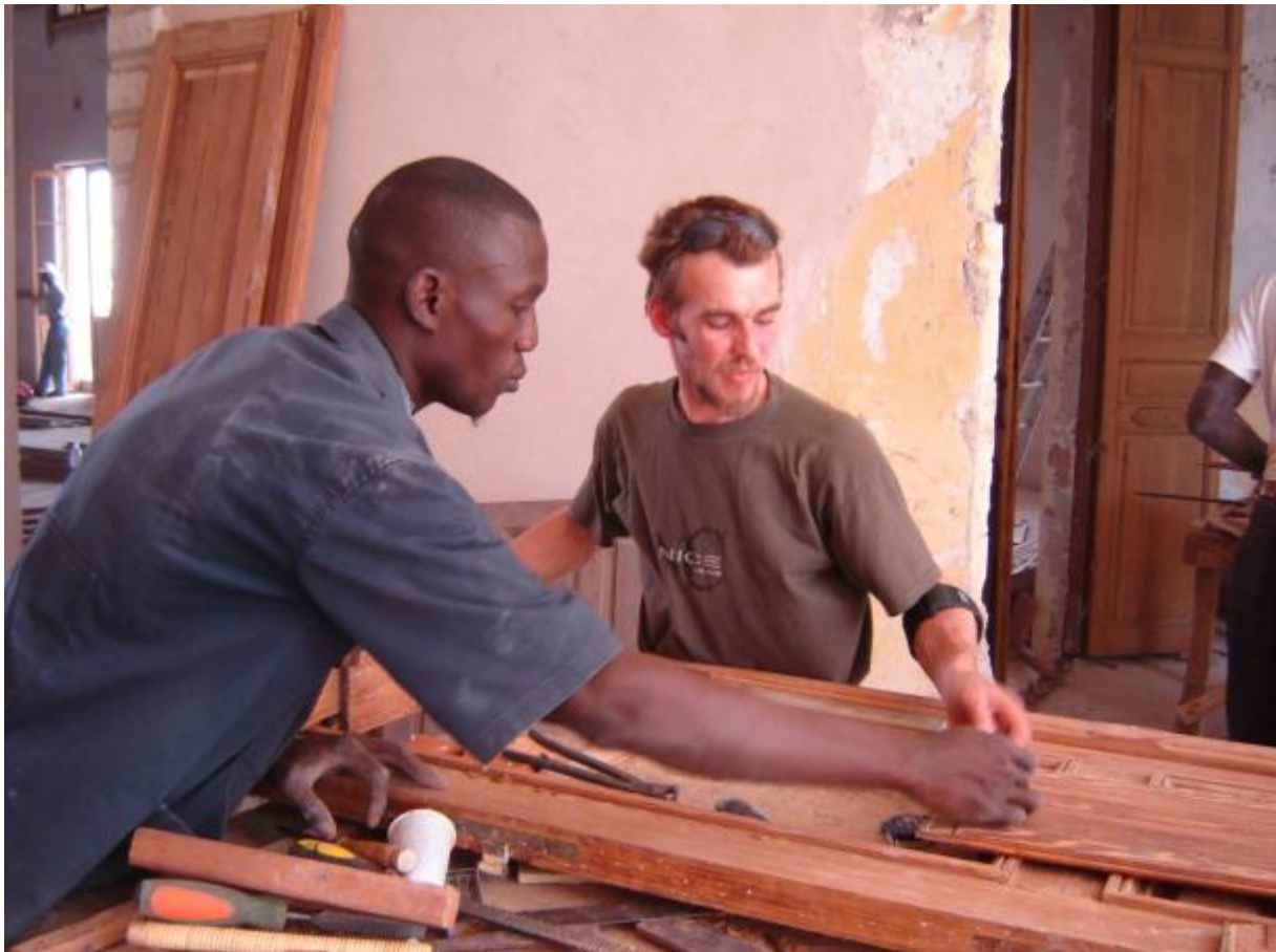
Menuiserie à St Louis, Sénégal, chantier-école de l'Assemblée territoriale du Fleuve, IPW-DPC, 2006-09