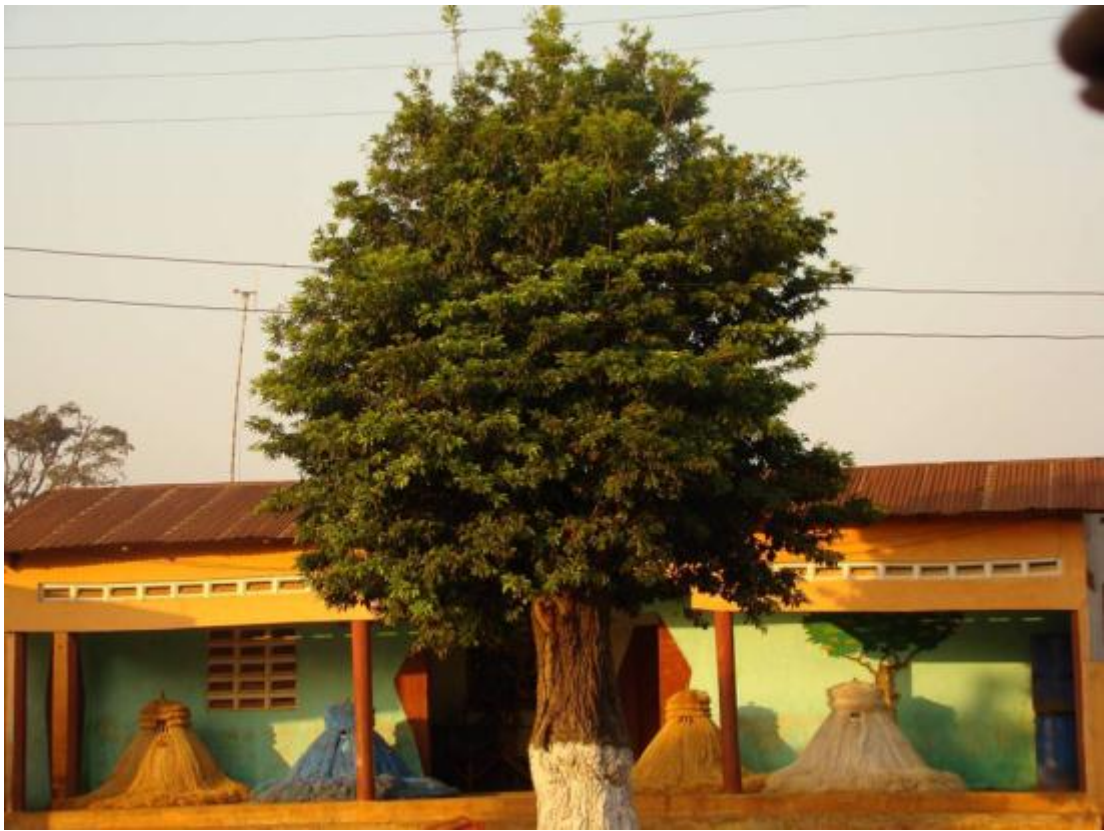
Le portique des Zangbétos, les gardians de la nuit, à Porto-Novo, Bénin.