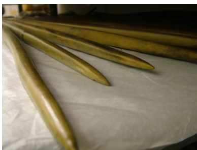
在玛丽·罗斯号残骸上发现的英国大弓

水下文化遗产包括许多人类在几个世纪、甚至几千年来都不曾碰触的遗址。一艘船沉没或一座城被毁时，其遗迹就被水如“时光胶囊”一般封存了起来。