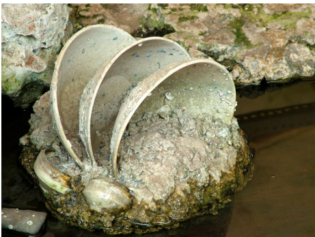
从一具失事船舶残骸上打捞上来的亟需保护的物品

根据 2001 年公约，在允许或开展任何与某水下文化遗产有关的活动之前，必须把对其实施就地保护作为首要优先选择。