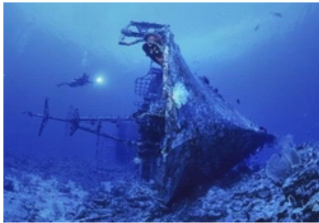
巴布亚新几内亚附近海域的失事船舶残骸

就在陆上文化遗产越来越多地从各种国家和国际保护措施中受益的同时，水下文化遗产仍缺乏充分的法律保护。2001 年通过的《教科文组织保护水下文化遗产公约》旨在敦促各国更好地保护这种遗产。