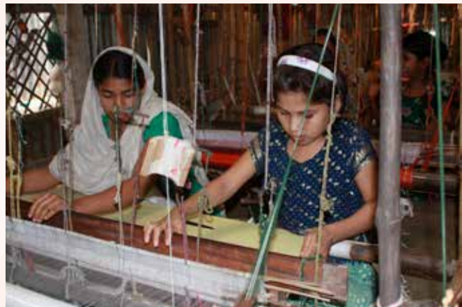
© 2012 Firoz Mahmud – Photographie : Murshid Anwar

Si les politiques en matière de patrimoine culturel immatériel se doivent d'établir une relation de réciprocité entre le genre et le patrimoine culturel immatériel, l'élaboration de politiques de sauvegarde doit veiller à la participation active d'une réelle diversité de voix, notamment celles de tous les groupes de genre concernés. Choisir de confier cette tâche à quelques membres de la communauté, à des experts extérieurs ou à des agences gouvernementales présente un certain nombre de risques. Selon la Convention (Article 2.1), les politiques doivent en outre être élaborées de façon à encourager les principes des droits de l'homme (y compris l'égalité des genres), le développement durable et le respect mutuel dans la sauvegarde du patrimoine culturel immatériel. Elles doivent par ailleurs s'assurer que les actions de sensibilisation ne contribueront pas à « justifier une quelconque forme de discrimination politique, sociale,