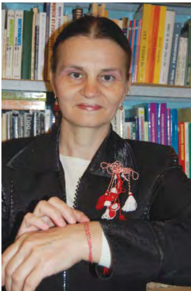
1 Марта все дарят и получают в дар мэрцишоры. Everybody presents and achieves mărțișoruls on March 1st.

Märțișorul is an ancient custom that marks the passing from winter to summer. In Antiquity, the New Year began on the 1st of March and coincided with the beginning of a new cycle of nature. The celebration of the New Year lasted 9, and later 12 days. After the institution of the new Julian calendar (in 46 BC), the beginning of the year was officially transferred on the 1st of January. A big part of the customs specific for the beginning of the year gradually migrated to the 1st of January, but others remained on the 1st of March, keeping the memory of the old beginning of the year. These customs are connected with the ritual purification and protection of the dwelling, of the household buildings, of people and domestic animals in this season of passage.