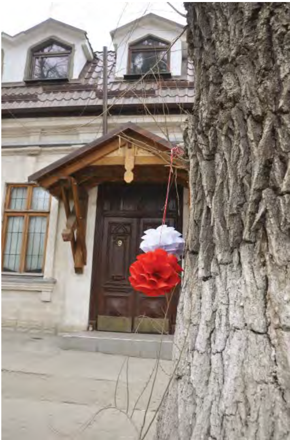
----- Мэрцишоры для дома. 02.04.2011. Mártşoruls for the house, 02.04.2011.