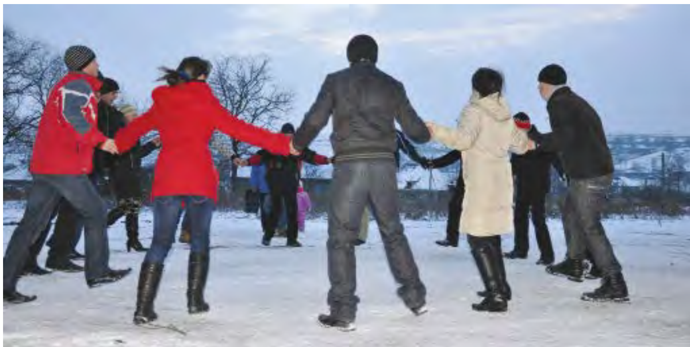
Позже входят в хор и девушки. Садак. 07.01.2011. The girls join the chora. Sadac, 07.01.2011.