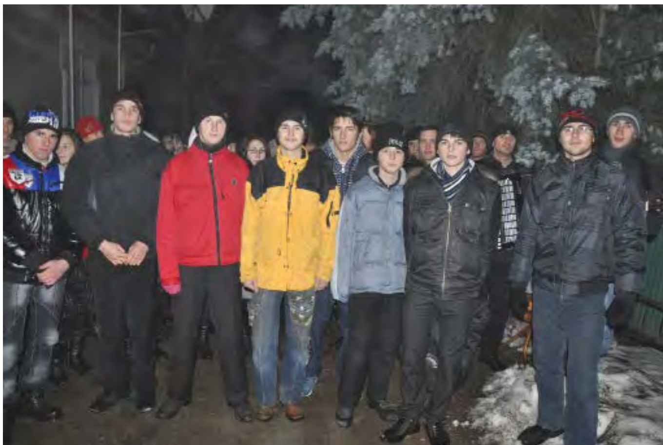
Колядование школьников. Юго-запад Республики Молдова. 24.12.2010. Carolling of schoolboys. The south-west Moldova, 24.12.2010.

The carols (colinde) transmitted in such a way are very old, are original, authentic and very important for understanding the way of life and the values of the traditional society. They can be compared with hymns addressed to the persons who are carolled. According to the tradition, as a sign of respect, the young men band (ceata de bărbați tineri) had to carol all the households from the community. They carol in an organized way, anticipating or remedying the possible conflicts, and, on the second day or on the third day, they organize in the village a Hora/Joc (a