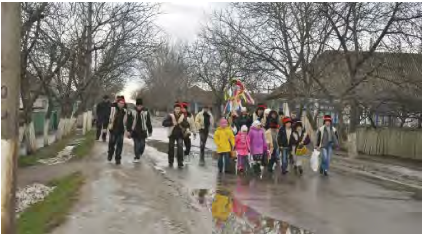
Колядование утром. Юго-запад Республики Молдова. 25.12.2010. Carolling in the morning. The south-west Moldova, 25.12.2010.

The custom Carolling in young men band with its specific deep social aspects is one of reference in the identity strategies of the people of the Republic of Moldova. Carolling in young men band unites the group of lads, cultivates their discipline, teaches them to