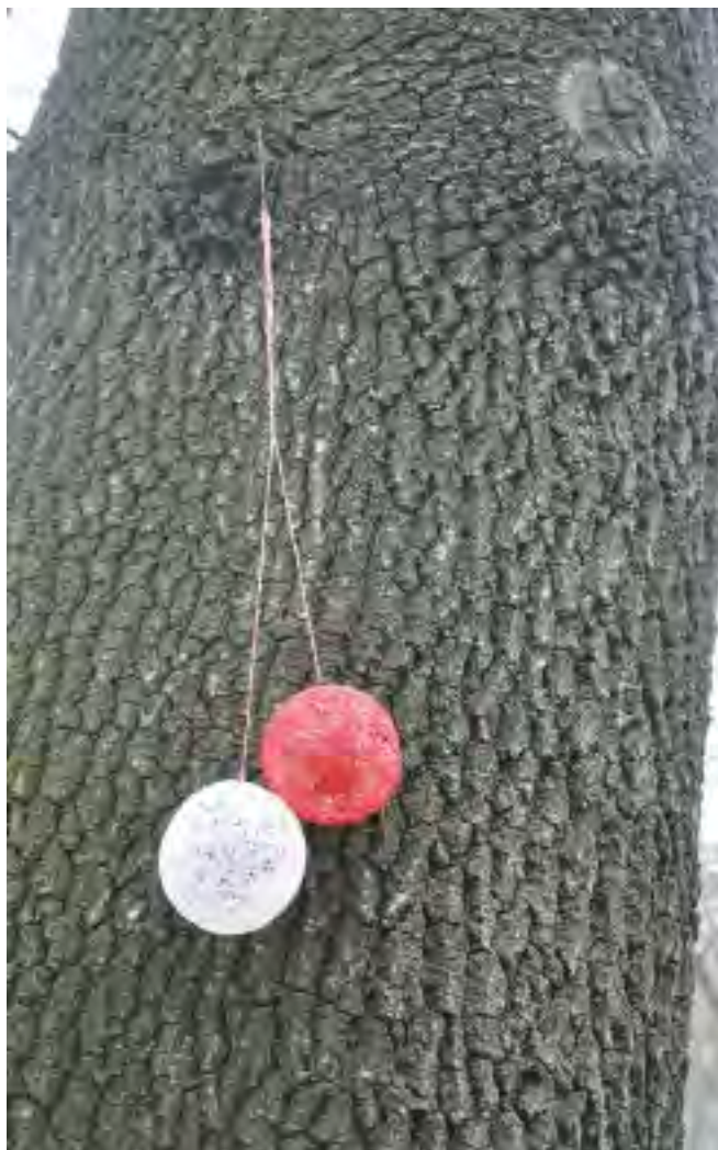
Мэрцишоры вывезенные на улицу. 02.04.2011. Mărtișoruls are hung outdoors, 02.04.2011

Ареал Мэрцишора достаточно велик. Республика Молдова служит границей его бытования в Восточной Европе, а в балканском пространстве праздник от-