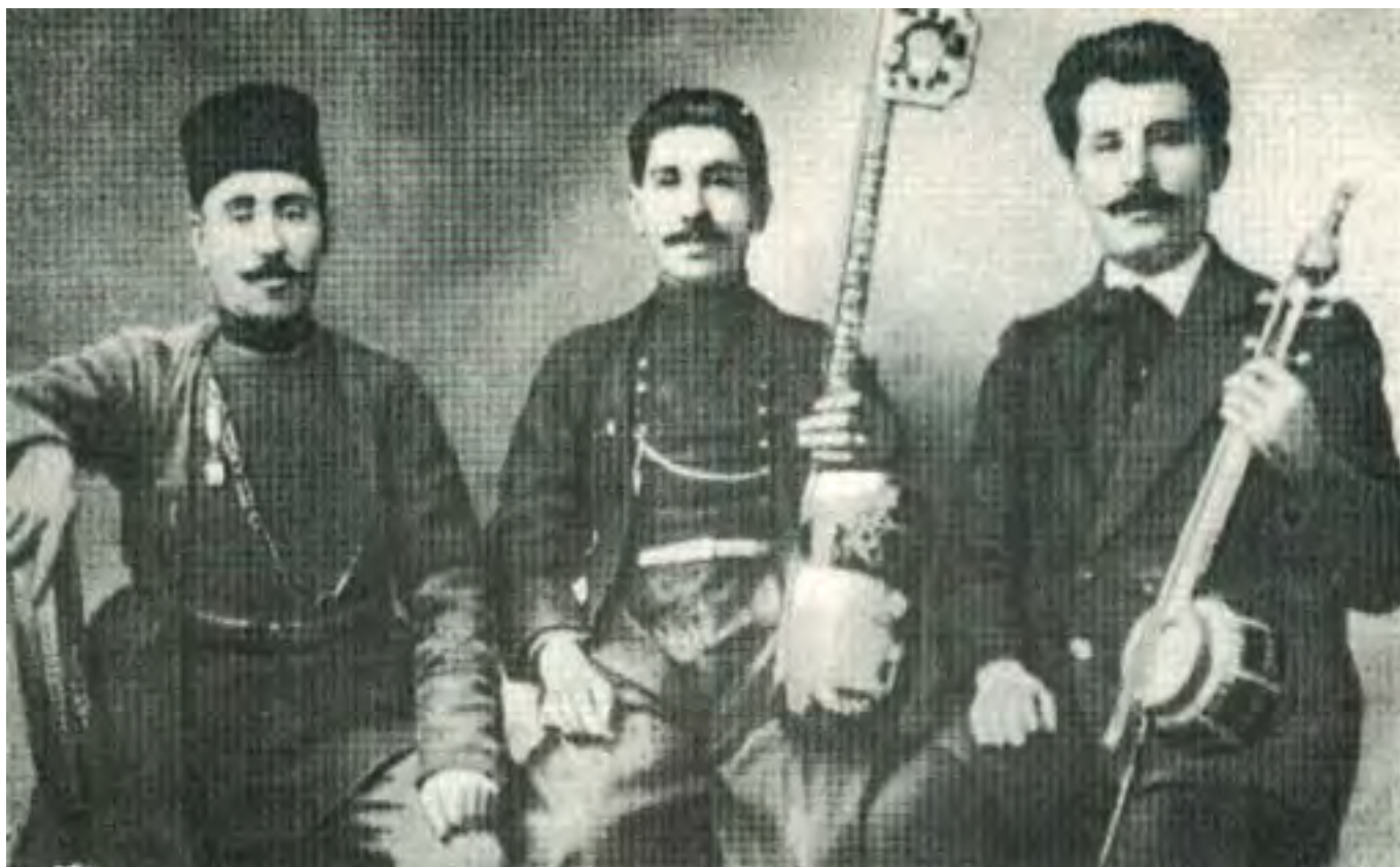
Кечачи оглы 1913 Варшава Kechachi oqlu 1913 Warsaw

The musical term “mugham” has been in use in Azerbaijan, at least, for seven centuries. At present time it is used with regard to a free melodic style of original syntax that reproduces a natural rhythm of emotional human speech. “Mugham” is also a general name of the largest genre of traditional music with a variety of its small and big