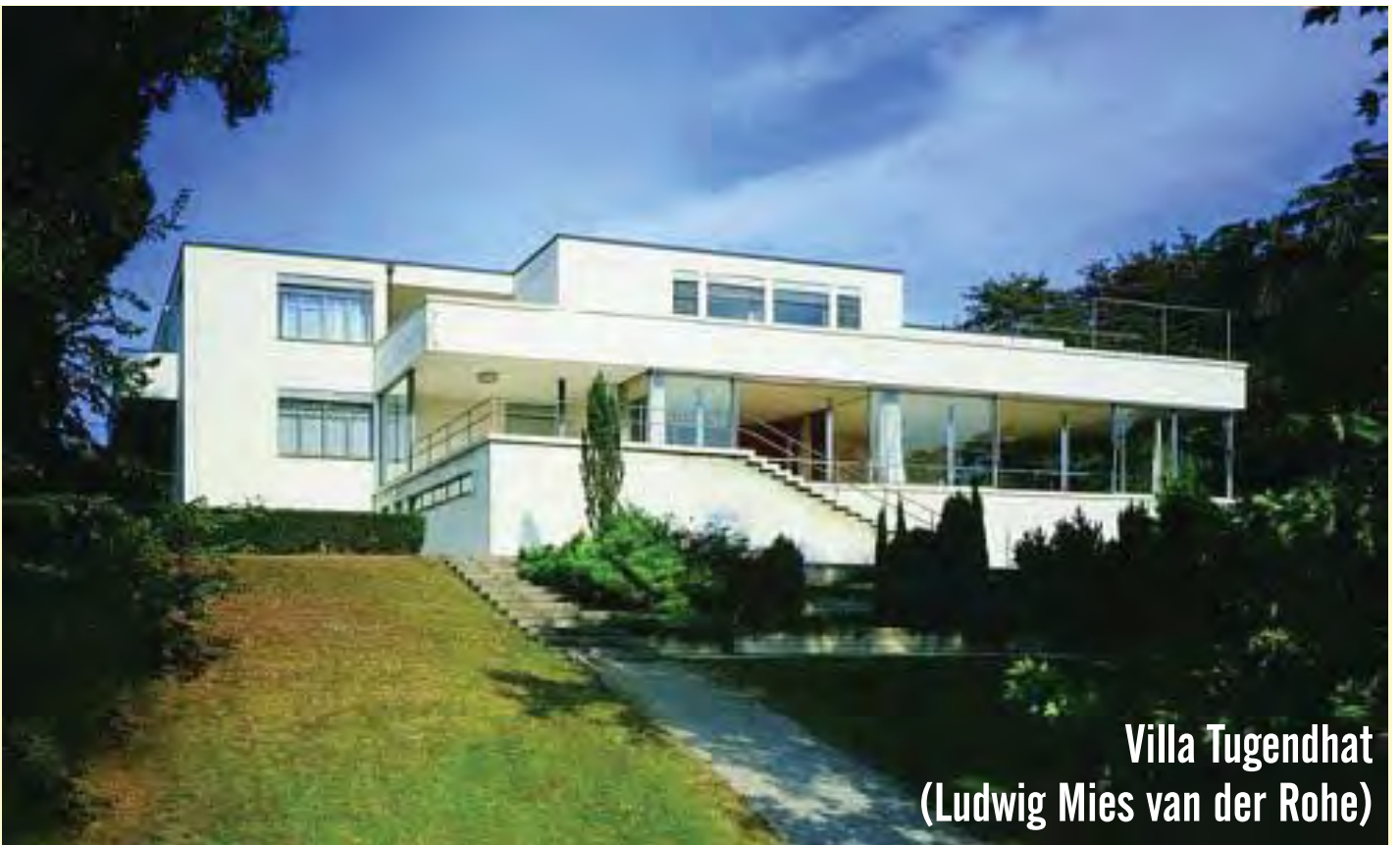
Villa Tugendhat (Ludwig Mies van der Rohe)

http://3.bp.blogspot.com/-4BmDa2LJeSI/TrirjUXH0PI/AAAAAAAAAG4/XbCdZ3Zor38/s1600/tugendhat.jpg