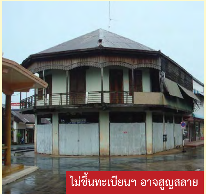
ไม่ขึ้นทะเบียนฯ อาจสูญสลาย