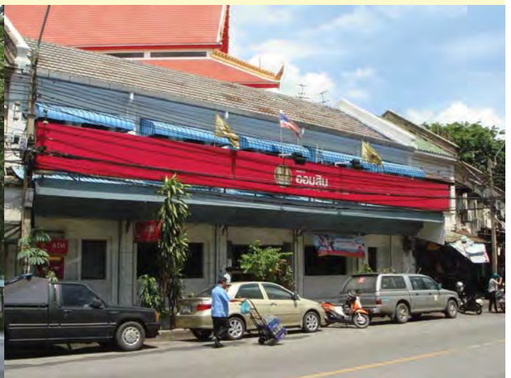
ไทย ตึกแถวเอกชนมีคุณค่าหรือไม่