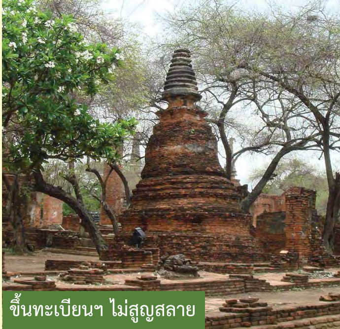
ขึ้นทะเบียนฯ ไม่สูญสลาย