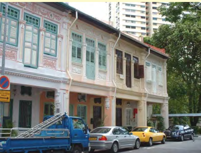
สิงคโปร์ ตึกแถวเอกชนมีคุณค่า