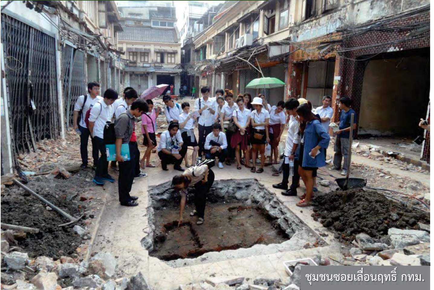
ชุมชนซอยเลื่อนฤทธิ์ กทม.