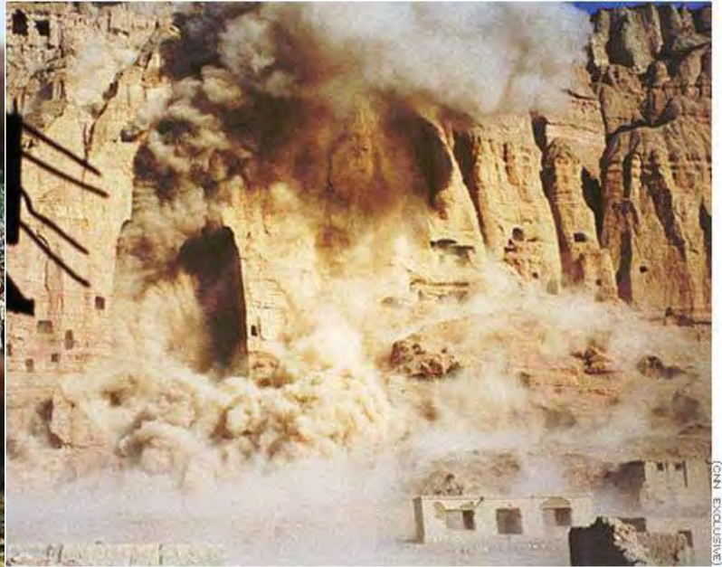
Bamiyan attack 2001