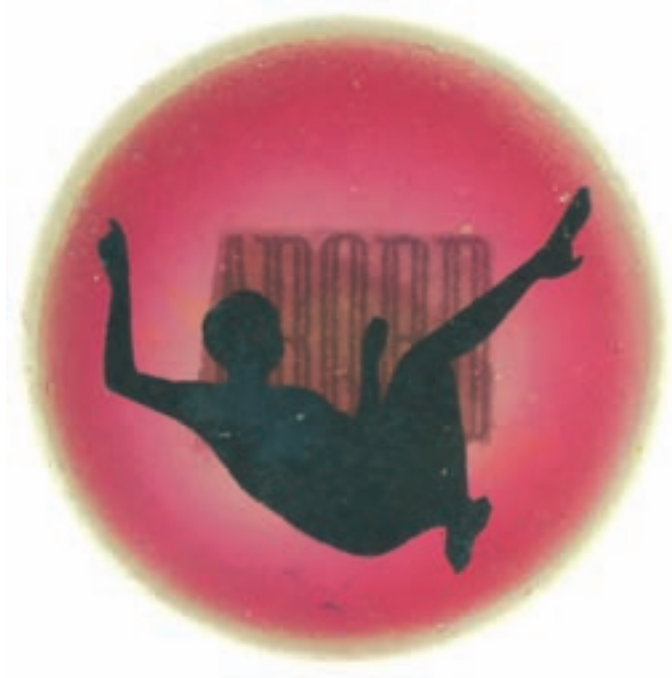
▲ Aboard (detail) resina de polyester ....2007