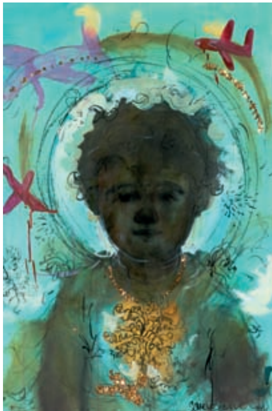
The island with many guards drawing on paper 2006

> Santo Domingo, Dominican Republic Lives and works in New York, U.S.A