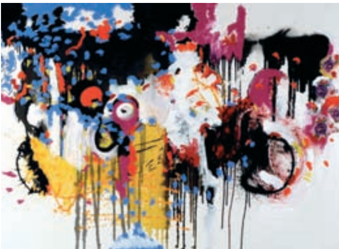
ContactSheet - 001 oil on canvas 2006