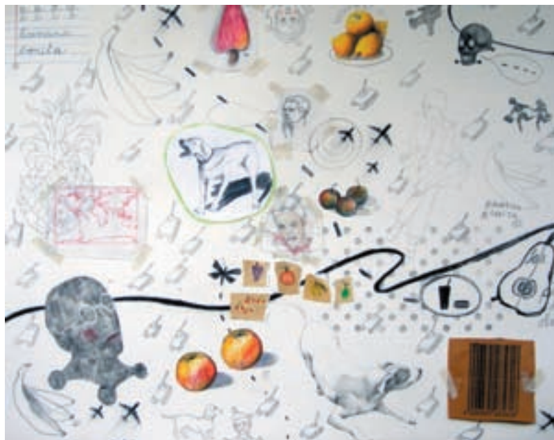
Banana Bonita crayon / collage / papier 60 x 76 cm 2007