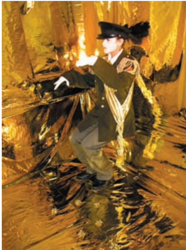
Throne of gold performance (Gerrit Rietveld Academy, Amsterdam) 2007

This performance is inspired by a photograph of Rafael Leonidas Trujillo, dictator of the Dominican Republic during the years of 1930-1961, on identity, race and gender in a postcolonial society where a constant mirroring and miming of power structures gives rise to the production of Wonderlands. The struggle in between imaginary and real spaces, time and home searching.