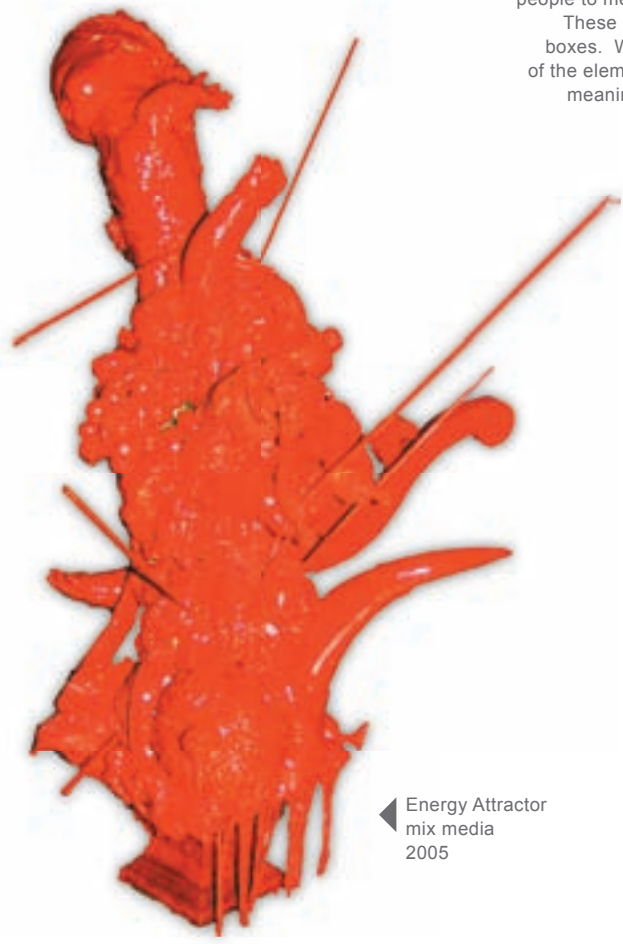
◀ Energy Attractor mix media 2005