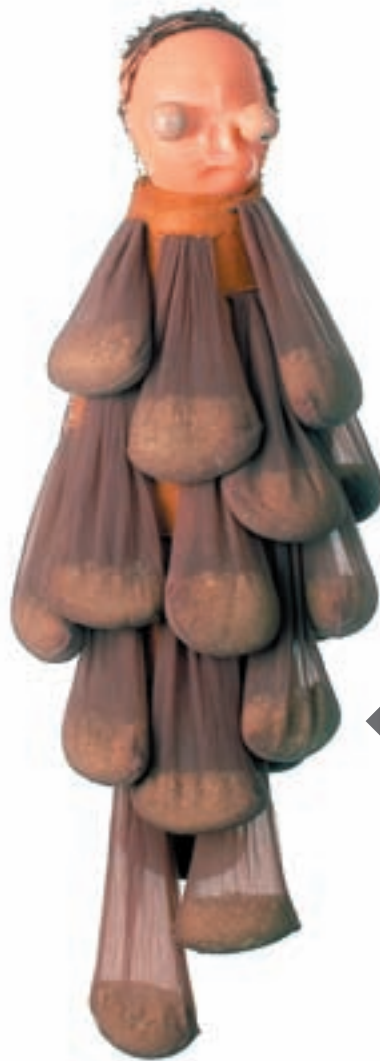
◀ de la serie «mutantes» materiales diversos 2006