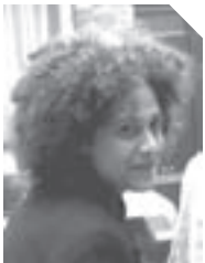
untitled performance (Gerrit Rietveld Academy, Amsterdam) 2006