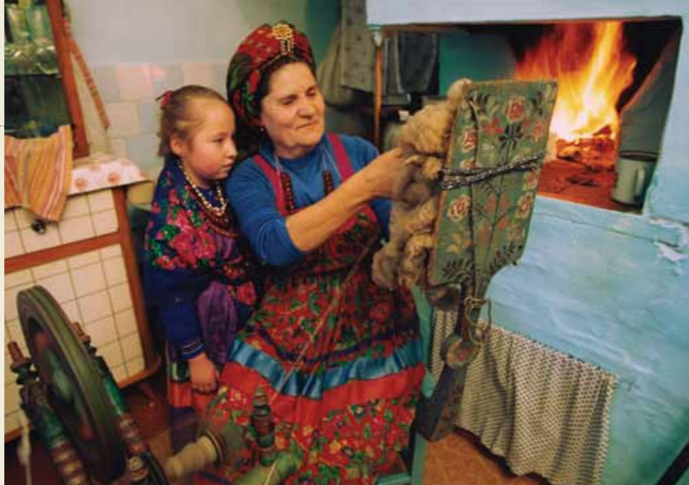
Ta'ānga © Casa Estatal Rusa de la Creatividad del Pueblo, Ministerio de Cultura

☞☞☞☞ Garifuna ñe'ë, ijeroky ha ipurahéi (Honduras, Belice, Guatemala y Nicaragua)