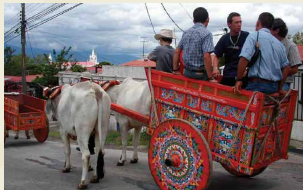
Ta'anga © Ministerio de Cultura, Juventud y Deportes

🎭🎭🎭 Teko'angaha Ningyo Johruri Bunraku, Japan