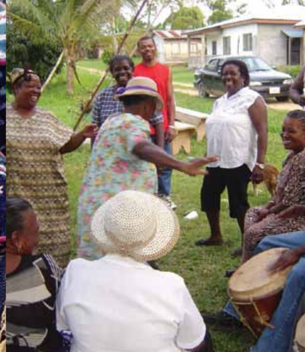
Ta'ānga © Consejo Nacional Garífuna