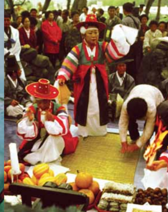
Ta'ānga © Kim Jong-Dal