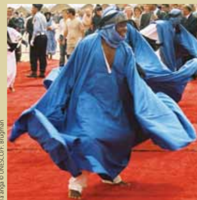
Ta'ãnga © UNESCO/F. Brugman

Ohechakuaávo komunida, ypykuéra, upéicha avei ambue aty ha tapicha peteíteĩ ojapoha oipysyrõ, oñangareko