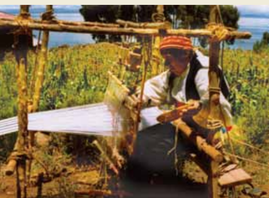
Ta'ānga © Instituto Nacional de Cultura / Dame Villalente