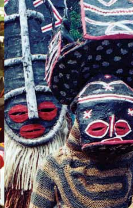
Ta'ānga © Comisión Nacional Zambiana para la UNESCO