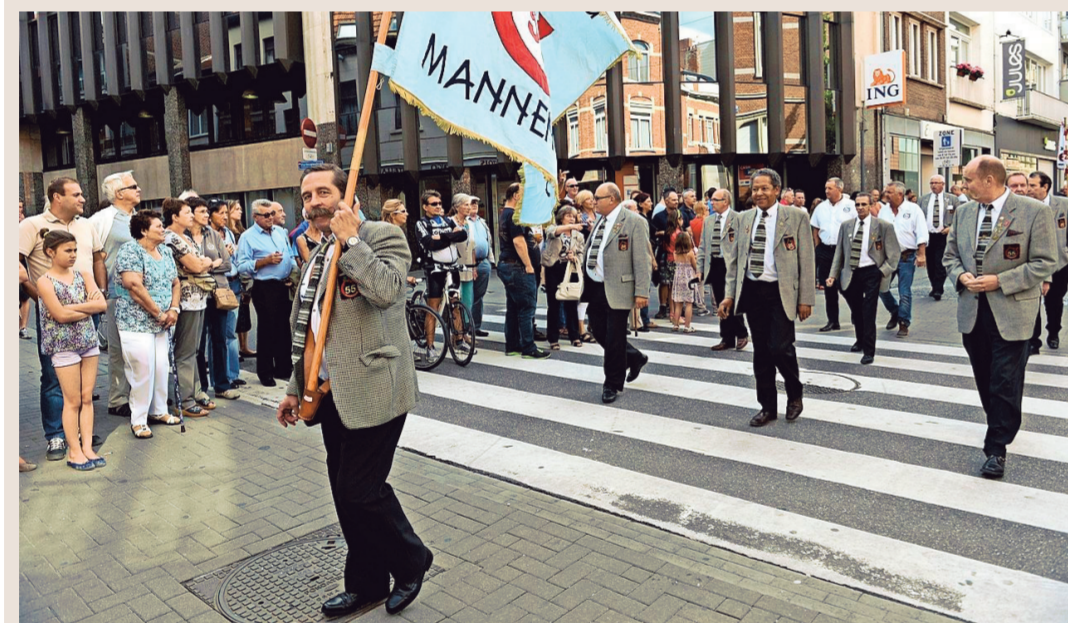
De mannen van 63 trekken in een optocht door de stad.

De Jaartallenstoet, het jaarlijkse evenement waarmee alle leden van het Koninklijk Verbond der Jaartallen afscheid nemen van de nieuwe lichting vijftigjarigen, heeft gisteren ongeveer vijfhonderd mannen op de been gebracht.