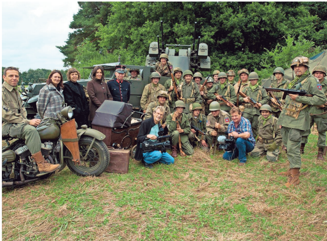
Het hele team stond zaterdag te trappelen van ongeduld om met de opnames te starten.

Zaterdag startten de eerste opnames. Daarvoor trokken de acteurs naar Betekom. «De komende weekends - want we werken allemaal door de week - trekken we naar het Meetshovenbos in Aarschot, naar Bertembos, een kasteel in Schaffen en naar Stavelot.»