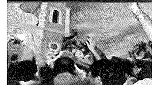
Festa de Sant'Ana de Caicó/RN...