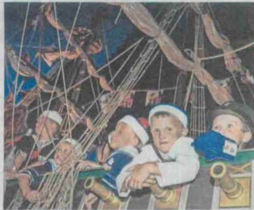
Schattige matrozen nemen plaats op 't Schipken.