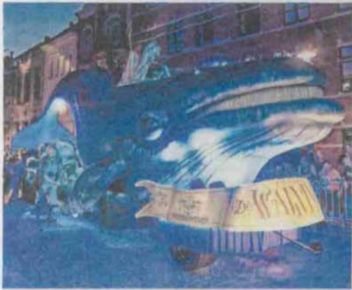
De nieuw praalwagen van de Walvis lokt verwondering uit.