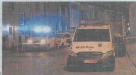
De Binnenstraat werd gisteravond afgesloten.

De Binnenstraat werd afgesloten, het labo ging ter plaatse.