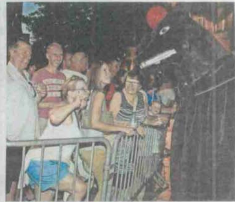
De Knapstanden doen de menigte schrikken en lachen.