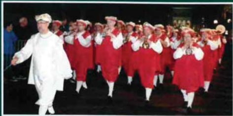
DANSENDE GILDEREUZEN INDIAAN, MARS EN GOLIATH