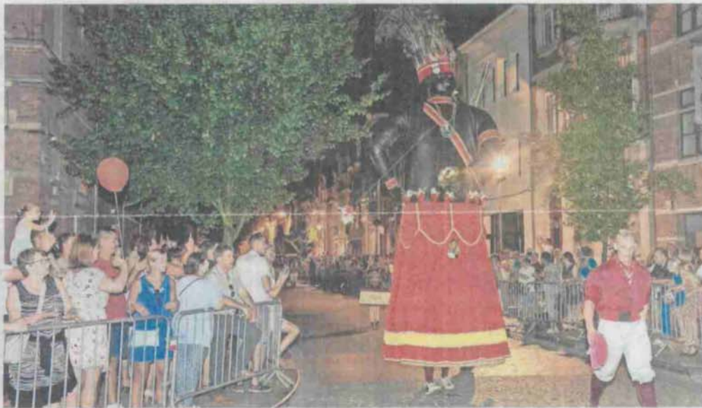
Reus Indiaan trekt door de straten van Dendermonde. Langs de kant staan de toeschouwers rijen dik.