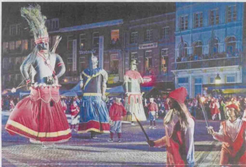
De drie Gildereuzen Indiaan, Mars en Goliath trekken eind augustus weer dansend door de straten van Dendermonde.