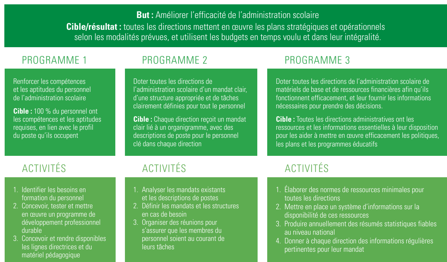
FIGURE 3. PROGRAMME SUR L'EFFICACITÉ DE L'ADMINISTRATION

La figure 3 illustre en partie la manière selon laquelle les activités liées aux programmes permettent d'atteindre un but. L'exemple décrit l'hypothèse d'un pays où des efforts considérables sont nécessaires pour améliorer l'efficacité de la gestion du système éducatif. La figure montre comment divers programmes sont requis pour atteindre ce but. Ces programmes sont liés respectivement aux compétences de chaque agent, à l'organisation de l'administration et aux ressources mises à leur disposition. La conception d'un tel programme présente une difficulté particulière en ce que les objectifs sont difficiles à déterminer. D'une part, parce que les questions telles que les « compétences » ou les « mandats clairs » sont difficilement mesurables, et d'autre part, parce que les informations sur ce type de questions sont recueillies de façon irrégulière. Cela implique qu'il faudra parfois recueillir de nouvelles données au cours de la mise en œuvre du plan afin de se concentrer sur de nouvelles priorités.