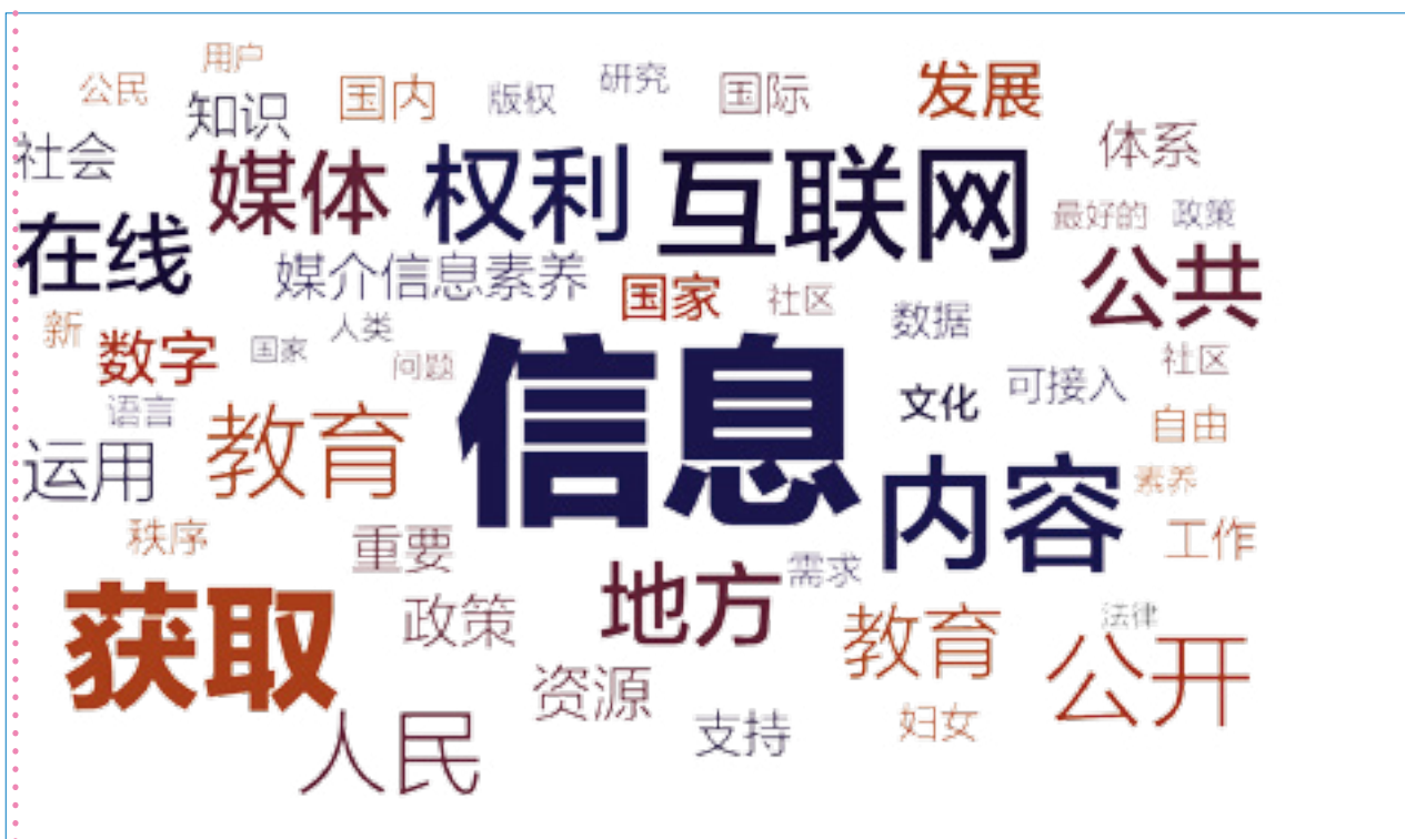
图形-1. 对获取权问题的回复中的文字云 (word cloud)