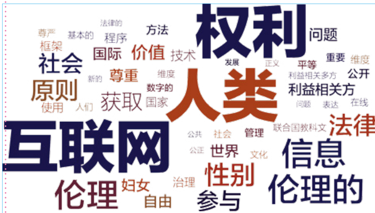
图形 4. 对信息社会伦理问题的回应中的文字云