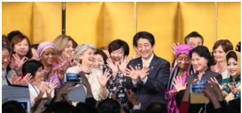
UNESCO Director General Irina Bokova with Japanese Prime Minister, Shinzo Abe at the World Assembly for Women, Tokyo, August 28th