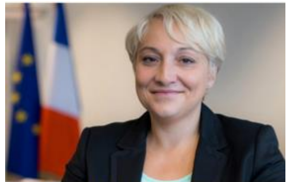
Pascale Boistard.

En Octobre 2015, La Secrétaire d'Etat française pour le Droit des femmes, Pascale Boistard, a annoncé que la lutte contre les représentations sexistes et dégradantes de femmes dans la publicité sera une priorité. Elle va très bientôt lancer une phase de dialogue avec les agences de publicité pour convenir d'un accord sur une définition précise du sexisme et pour éviter toute sorte de zone de flou, tout en respectant les dimensions créatives de la publicité. Actuellement, le Conseil supérieur de l'Audiovisuel peut uniquement agir sur les publicités diffusées à la télévision ou à la radio, mais pas sur celles publiées dans les rues ou dans les transports publics.