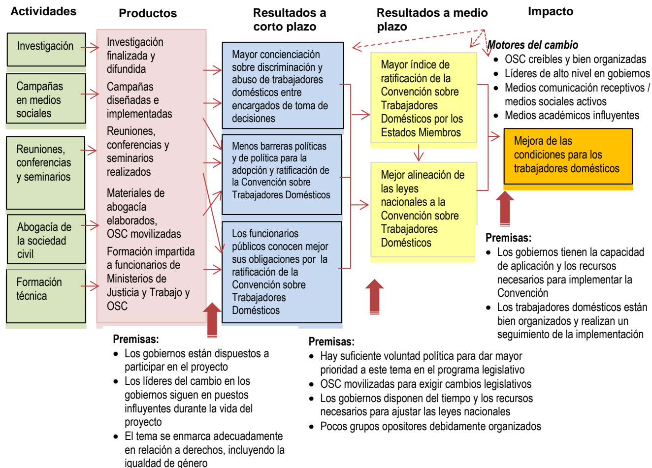
Figura 2. Ejemplo de una teoría del cambio

29. La falta de datos básicos –el quinto problema– podría ser motivo para retrasar la evaluación. Es posible que la falta de datos se deba a que no se realizó un seguimiento sistemático de la intervención, y por tanto no se recopilaron datos de seguimiento sobre los avances logrados y los resultados alcanzados. Puede deberse también a que los resultados a medio plazo y el impacto, en términos de beneficios para los ciudadanos y las economías nacionales, no se verán hasta pasados muchos años, como concluyó una evaluación de la FAO en 2009: