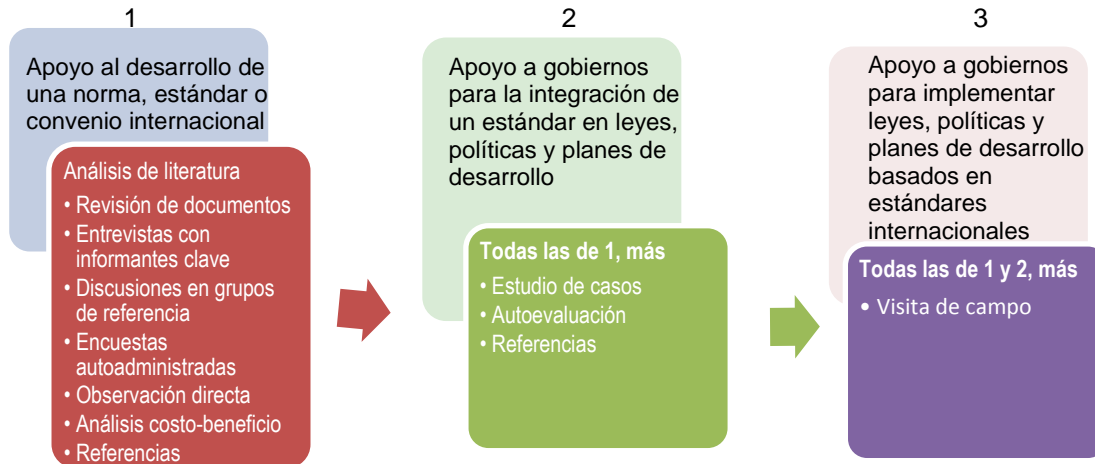
Figura 3. Metodologías frecuentes por tipo de evaluación

78. El evaluador no tiene necesariamente que limitarse a utilizar estos métodos frecuentes; los métodos especiales descritos en la Tabla 12 siguiente también pueden ser eficaces para evaluar el trabajo normativo en las condiciones descritas para cada uno de ellos.