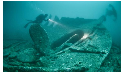
Divers at a shipwreck from WWI

In this exhibition, maritime underwater heritage is key. All Cambodians who participated in the Great War were transported to Europe by boat, and naval combat was a major element during the conflict. Unfortunately, many soldiers died in shipwrecks and the remnants of these important battles are found underneath the surface. The exhibition shows how important underwater cultural heritage is as part of today’s world heritage.