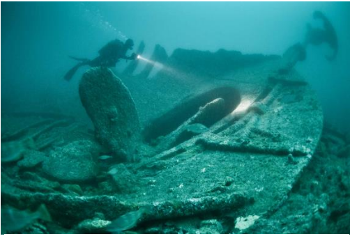
អ្នកមុជទឹកនៅទីលានកាត់ដំរីនៅសង្គ្រាមលោកលើកទីមួយ

"មានមនុស្សជាច្រើនមិនបានដឹងថាប្រទេសកម្ពុជាបានរួមចំណែកធ្វើសង្គ្រាមលោកលើកទីមួយទេ ប៉ុន្តែ នេះជាកាតព្វកិច្ចរបស់ពួកគេខណៈពេលដែលប្រទេសកម្ពុជាស្ថិតក្រោមអាណាព្យាបាលបារាំង" មានប្រសាសន៍ដោយលោកហ្វីលីពីដឺឡុងអ្នកជំនាញផ្នែកវប្បធម៌នៅអង្គការយូណេស្កូនៅរាជធានីភ្នំពេញ។ ប្រជាជនកម្ពុជាជាច្រើននាក់ត្រូវបានបញ្ជូនទៅ ប្រយុទ្ធនៅជួរមុខនៅអឺរ៉ុប ពិព័រណ៍នេះនឹងផ្តល់នូវការយល់ដឹងថ្មីមួយទៀតទាក់ទងនឹងរឿងរ៉ាវទាំងនេះ។