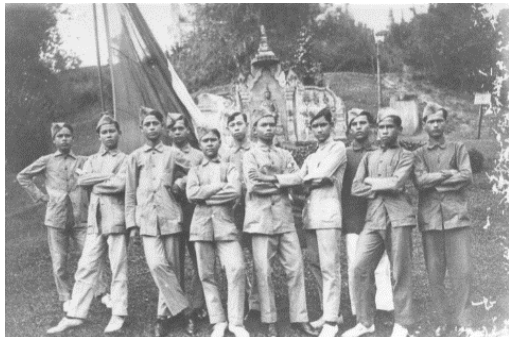
ក្រុមស្ម័គ្រចិត្តកម្ពុជាត្រៀមខ្លួនប្រយុទ្ធសង្គ្រាមលោក (1916)

ពិព័រណ៍ថ្មីមួយនៅសារមន្ទីរជាតិក្នុងរាជធានីភ្នំពេញនឹងបង្ហាញពីតួនាទីនៃប្រទេសកម្ពុជាក្នុងអំឡុងសង្គ្រាមលោកលើកទីមួយនិងសារៈសំខាន់នៃបេតិកភ័ណ្ឌក្រោមទឹក។