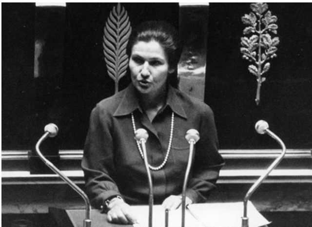
Simone Veil lors des débats de l'Assemblée nationale sur la loi sur l'avortement en 1974

Il y a peu de femmes dans l'histoire de la France qui sont aussi célébrées et respectées que Simone Veil. En reconnaissance de ses contributions aux des droits des femmes, la huitième édition du Gender Wire de l'UNESCO rend honneur à Simone Veil, survivante de l'holocauste et politicienne française, la championne de l'égalité des genres de ce mois.