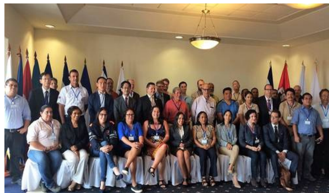
Inauguración del encuentro regional en Managua, Nicaragua

La actividad congregó a los organismos técnico científicos de la América Central, representantes de los Sistemas Nacionales de Gestión de Riesgos, Protección Civil, Ministerios de Educación, Medio Ambiente y organismos de cooperación; con fondos de la Cooperación Europea DIPECHO y con el auspicio de SINAPRED Nicaragua. Durante 4 días compartieron los avances técnicos y metodológicos en sismología y alerta temprana de tsunamis, para facilitar la transferencia de experiencias y analizar los mecanismos de coordinación y planificación con enfoque regional y acordar una agenda de fortalecimiento de capacidades institucionales en alerta temprana con todos los actores relevantes del nivel político, institucional y comunitario en la región.