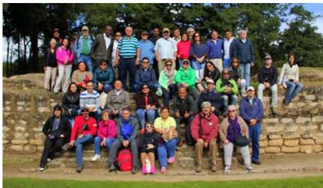
Participantes del seminario IberoMAB en Antigua, Guatemala

Representación para Costa Rica, El Salvador, Honduras, Nicaragua y Panamá