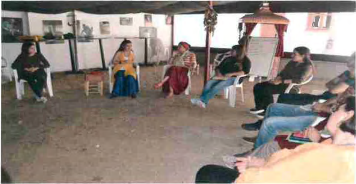
Children Live with the Cultural Heritage – Activities in Museum Week: Activities were organized at Ankara Intangible Cultural Heritage Museum on the occasion of “Museums Day” on May 18, 2015.