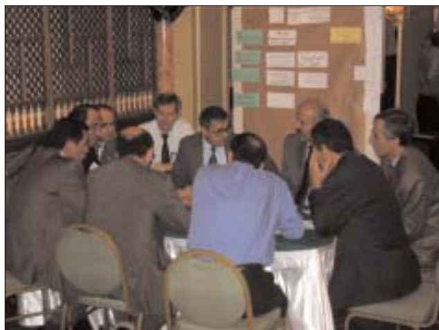
Participantes en el seminario en Damasco

Los días 21 y 22 de octubre se celebró en Damasco/República Árabe de Siria un seminario regional con el fin de poner en marcha los "Proyectos Regionales de Cinco Estados Árabes para la Colaboración en el Ámbito de la Formación Profesional y Técnica (FTP)", iniciados y apoyados por la Agencia de Cooperación Técnica alemana (GTZ).