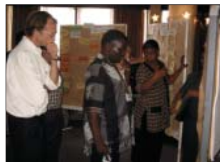
LLWF seminario en Tanzania

El seminario se estructuró sobre la base de grupos de trabajo, que, por consenso general, debían orientarse hacia los resultados conseguidos de común acuerdo. Por este motivo, se contrató a un Moderador Jefe profesional, de nacionalidad alemana,