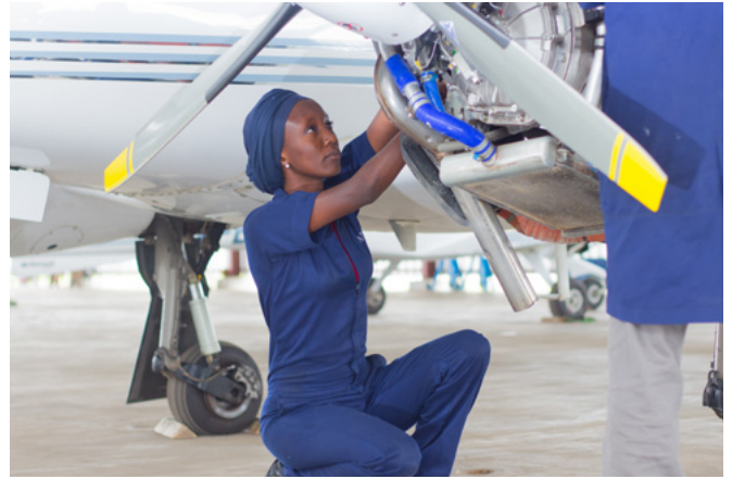
“技能正在使用”摄影比赛

来自40个国家的50多个UNEVOC中心举办了各种活动，汇聚了不同的利益相关方，以提高对年轻人技能发展的益处的认识。各部委、国家机构和培训机构组织了技能竞赛、展览、讲座和讲习班以及由学生、教师、决策者和当地社区成员参与的培训课程。