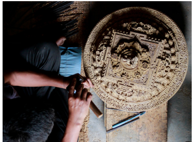
“技能正在使用”摄影比赛