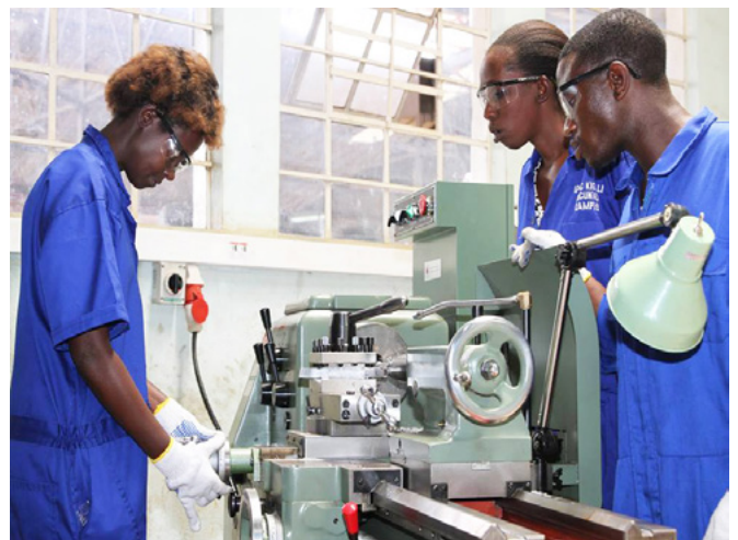
“技能正在使用”摄影比赛