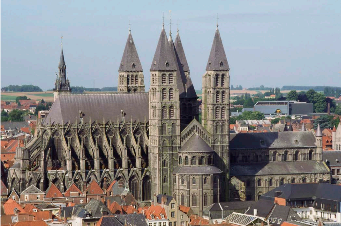
Figure 2 : Vue générale de la cathédrale