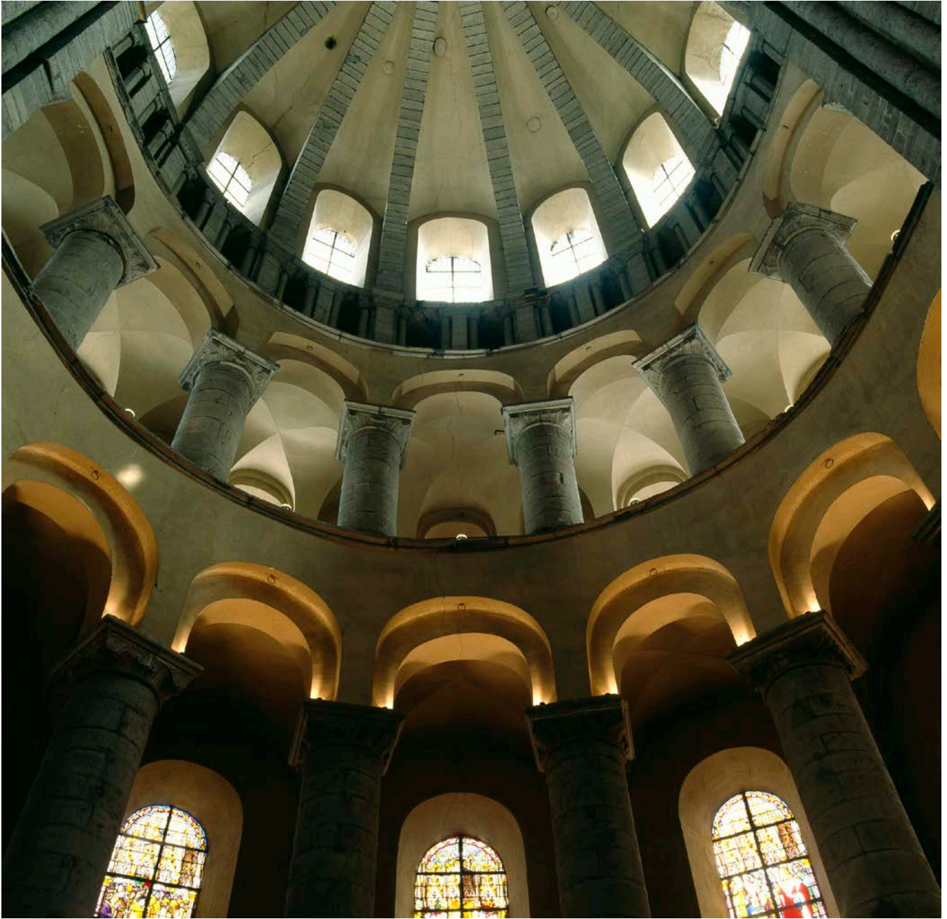
Figure 3 : Cathédrale de Tournai : vue intérieure du transept