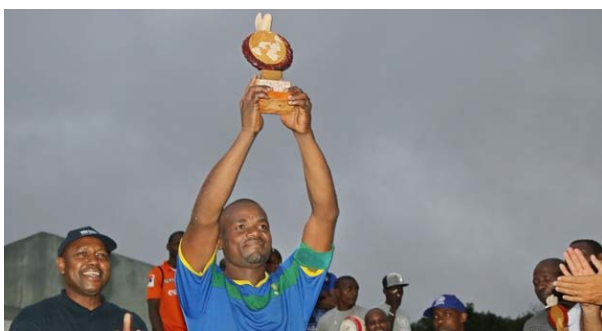
Le capitaine de l'équipe vainqueur brandissant le trophée gagnant

Lors de la célébration de l'édition 2017 de la Journée internationale de la paix, le personnel du Bureau a participé auprès des collègues des autres agences onusiennes au tournoi de football dit «de la Paix » ont joué, le 23 septembre 2017, au stade de l'Institut sous-régional multisectoriel de technologie appliquée,