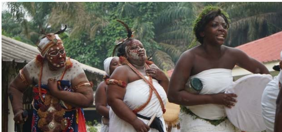
Des femmes gabonaises gardiennes du Ndjembè lors de la cérémonie traditionnelle de clôture de la Journée mondiale de la diversité culturelle pour le dialogue et le développement durable

La Journée mondiale de la diversité culturelle pour le dialogue et le développement durable 2017 a été célébrée sous le thème « Le rôle des femmes dans la sauvegarde et la transmission du patrimoine culturel