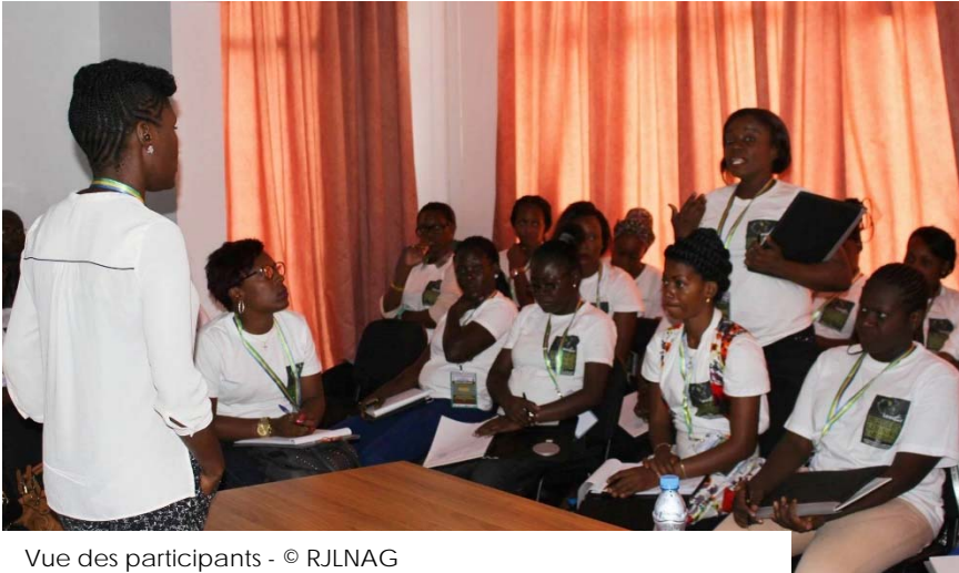
Vue des participants - © RJLNAG

Grâce au programme de participation, le Bureau a soutenu l'organisation du 2ème Forum