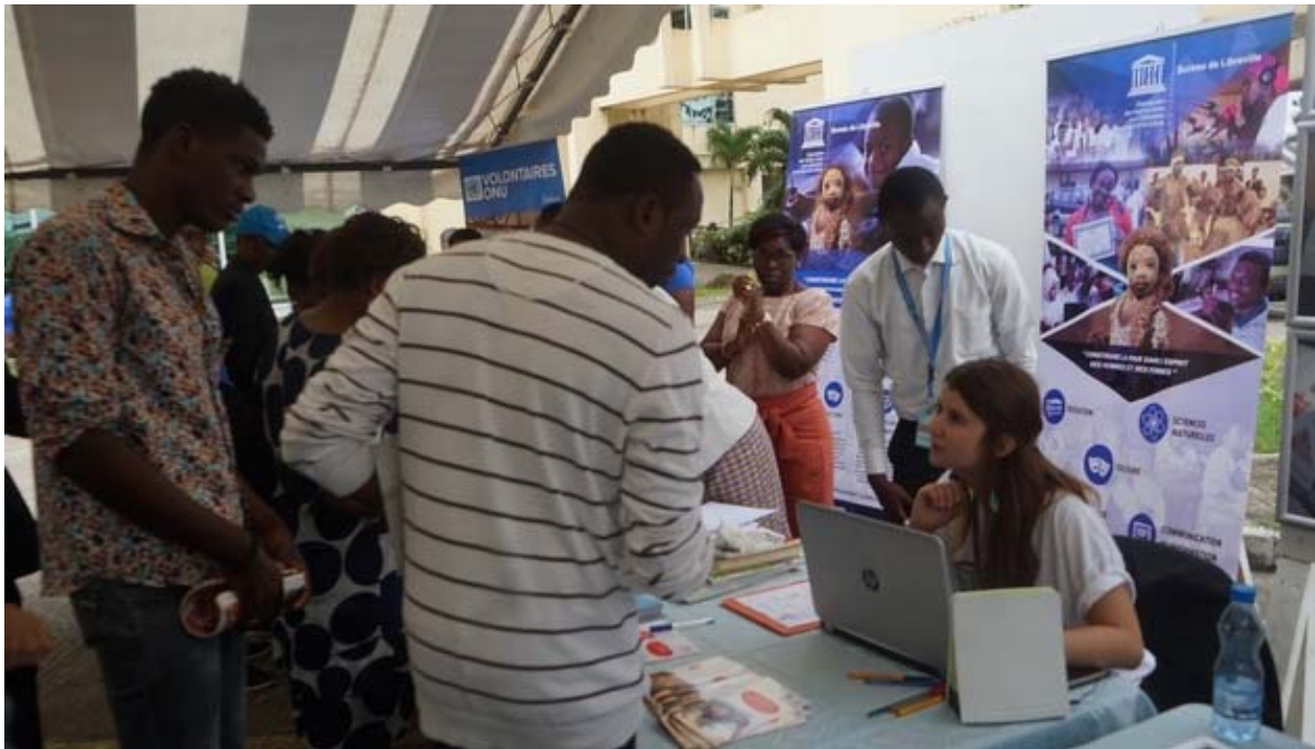
Vue du stand de l'UNESCO lors de la Journée des Nations Unies

A l'occasion de la célébration de la 72 ème édition de la Journée des Nations Unies, le 24 octobre 2017, les agences du Système des Nations Unies au Gabon, en partenariat avec le Ministère des affaires étrangères, ont offert gratuitement au grand public différents services, au nombre desquels des expérimentations des sciences de la vie et la terre et des sciences physiques du projet Miscrosience actuellement mis en œuvre dans certains établissements du Gabon par l'UNESCO. C'était, en outre, l'opportunité pour le Bureau de Libreville de multiplier les inscriptions des jeunes au Programme de formation en informatique appelé Former Ma Génération – Gabon 5000. Des dépistages de diabète, des prises de tensions artérielles et la distribution des préservatifs ont également été faits respectivement par les collègues de l'OMS et l'ONUSIDA.