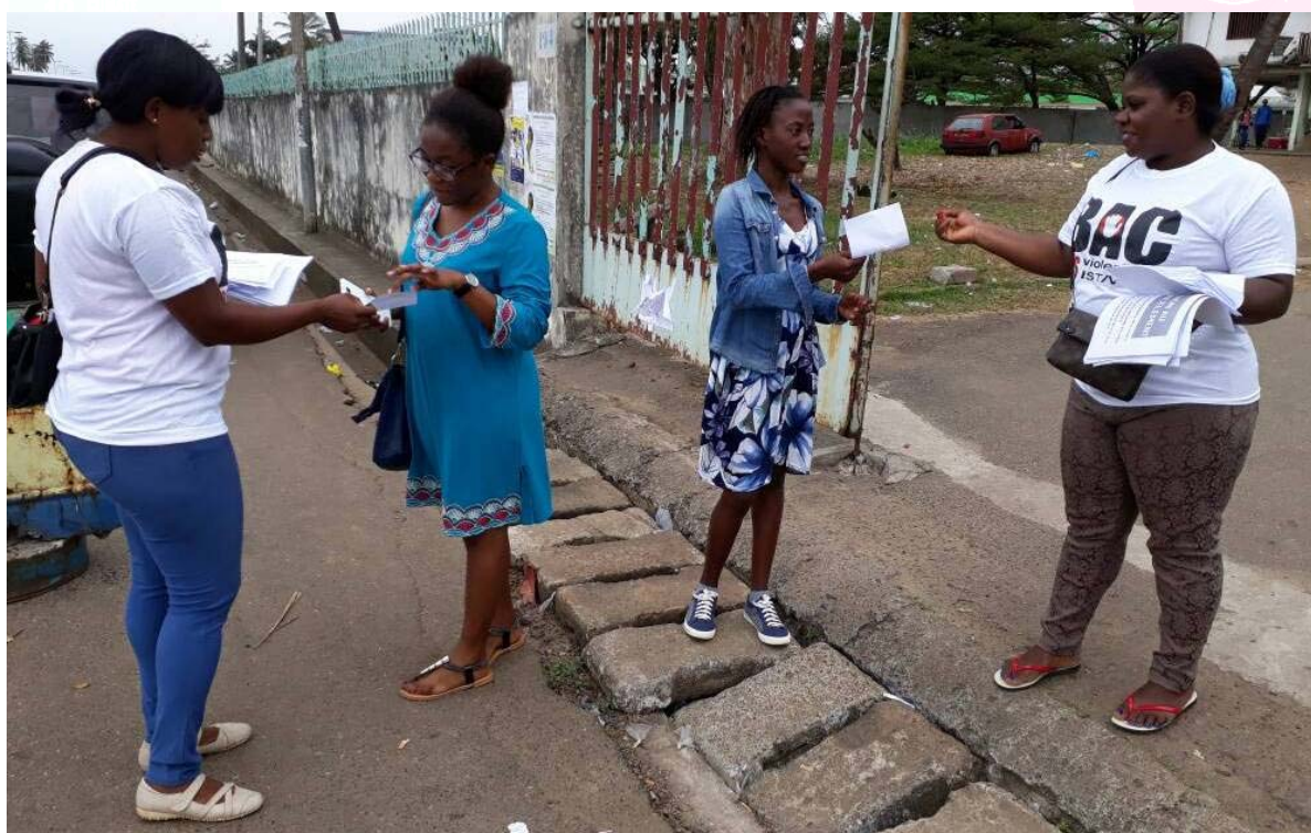
Des pairs éducateur (en tee-shirts blancs) en pleine sensibilisation

L'UNESCO travaille au renforcement des liens entre l'éducation et la santé, reflétant la reconnaissance grandissante au niveau international du fait qu'une approche plus complète à la santé sexuelle et une action coordonnée de tous les secteurs est nécessaire.