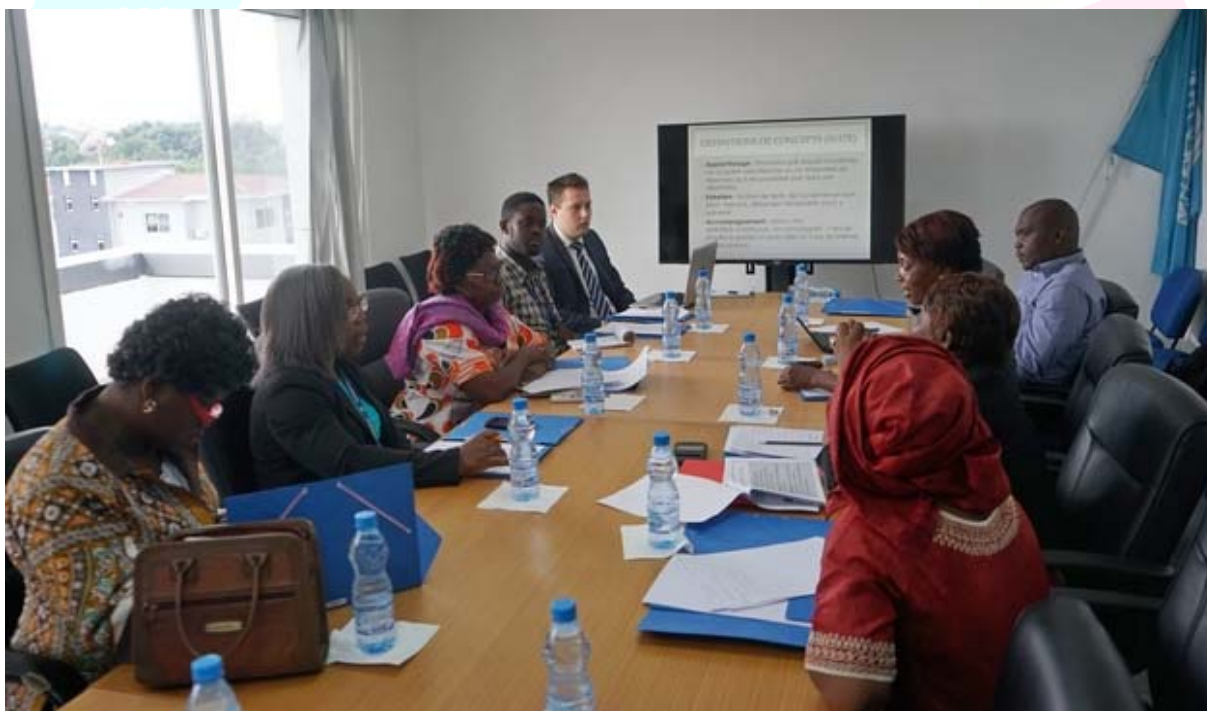
Vue des participants à l'atelier de formation des encadreurs des centres d'alphabétisation du Gabon

Le Bureau de l'UNESCO à Libreville a poursuivi, en 2017, au Gabon, son soutien dans le renforcement des capacités des centres d'alphabétisation à travers l'élaboration de référentiels d'alphabétisation traditionnelle et fonctionnelle ainsi que la formation de 65 formateurs et de 25 encadreurs de ces centres d'alphabétisation.