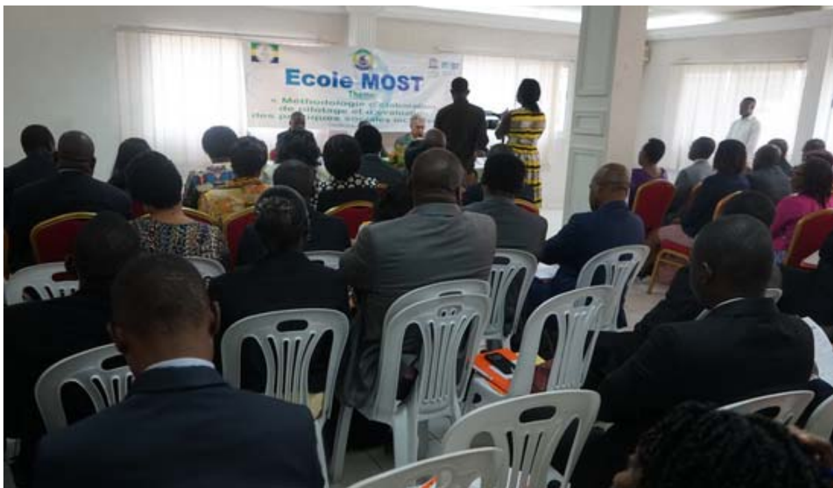
Vue des participants à l'Ecole MOST de Libreville

Dans le cadre de la mise en œuvre d'une convention de partenariat, signée en décembre 2016 avec le soutien du Bureau de l'UNESCO, entre le Ministère du développement social et familial, de la prévoyance sociale et de la solidarité nationale et le Comité national du Programme pour la Gestion des Transformations sociales (MOST) de l'UNESCO, une Ecole MOST a été organisée, du 10 au 13 juillet 2017. Elle portait sur la « Méthodologie d'élaboration, de pilotage et d'évaluation des politiques sociales et inclusives ». Financée par l'UNESCO, elle a permis de former 40 personnes (agents de l'Etat, universitaires et membres de la société civile).