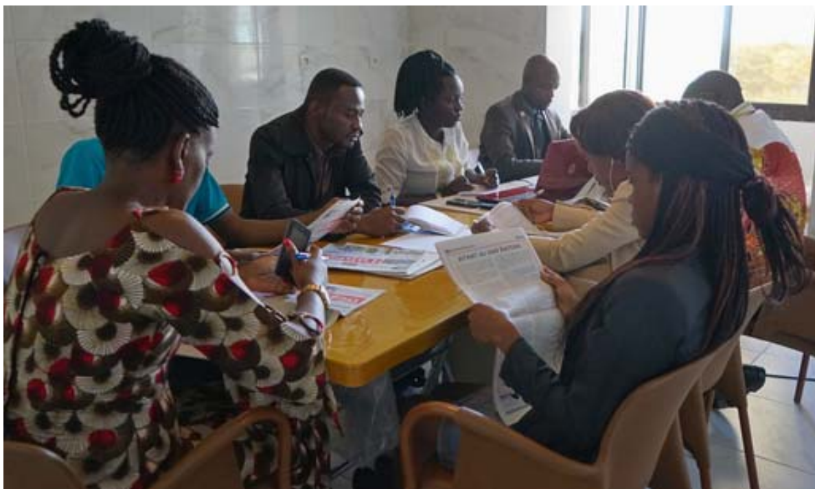
Vue du groupe monitoring

En droite ligne avec la mise en œuvre du Plan d'Action des Nations Unies sur la sécurité des journalistes et la question de l'Impunité, le Gabon a entrepris, en 2016, sous la coordination de l'UNESCO et avec l'appui de plusieurs partenaires dont le CNUDH-AC, le PNUD, l'OIF, l'UNITAR, l'UNOCA, une vaste opération, sur tout le territoire national, visant la sensibilisation des forces de sécurité et de défense sur la question de la sécurité des journalistes et le maintien de l'ordre. Grâce à cette opération, ce sont 200 personnes (dont environ 5% de femmes) des officiers et sous-officiers des services et police et de gendarmerie, de toutes les 9 provinces du Gabon qui ont bénéficié d'une formation sur le maintien de l'ordre et la sécurité des journalistes.