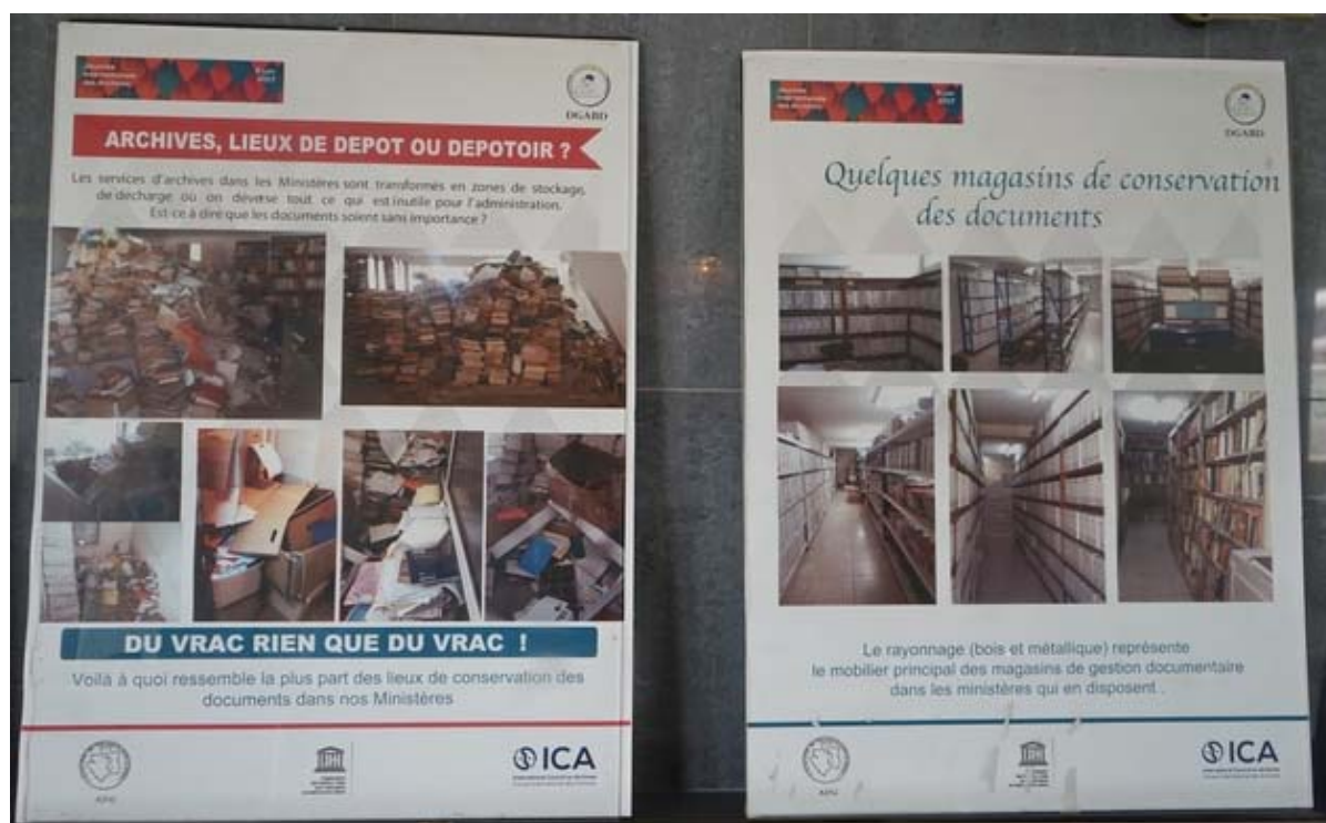
Vue de quelques planches des archives du Gabon

La préservation du patrimoine documentaire passe entre autres par la connaissance de celles-ci et l'existence et l'application de cadre réglementaire en adéquation avec les standards internationaux et les évolutions technologiques. A la faveur de l'appui de l'UNESCO, le Gabon dispose désormais, d'un inventaire préliminaire de son patrimoine documentaire, élaboré par le Comité national du Programme Mémoire du Monde. De plus, il a élaboré deux projets de loi dont l'une sur la protection du patrimoine culturel – qui intègre le patrimoine documentaire et l'autre sur l'archivage numérique, en vue d'encadrer et promouvoir la préservation du patrimoine documentaire au Gabon. Ces deux instruments sont alignés sur, entre autres, la Recommandation de l'UNESCO concernant la préservation et l'accessibilité du patrimoine documentaire, y compris le patrimoine numérique (2015).