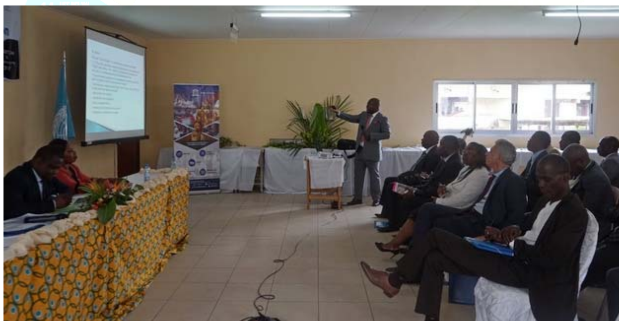
Vue des participants au lancement du Rapport mondial du suivi de l'éducation 2017/8

Le Gabon est une partie prenante du processus régionale de l'élaboration et l'adoption d'un cadre curriculaire harmonisé pour la formation des enseignants de l'éducation de base élargie dans les pays de l'espace CEEAC. Dans ce cadre, un atelier d'appropriation nationale a été organisé sur le processus avec la participation de l'ensemble les cadres techniques des cinq ministères en charge de l'éducation à la suite du « Lancement du Rapport mondial de suivi sur l'Education » le 16 novembre 2017.