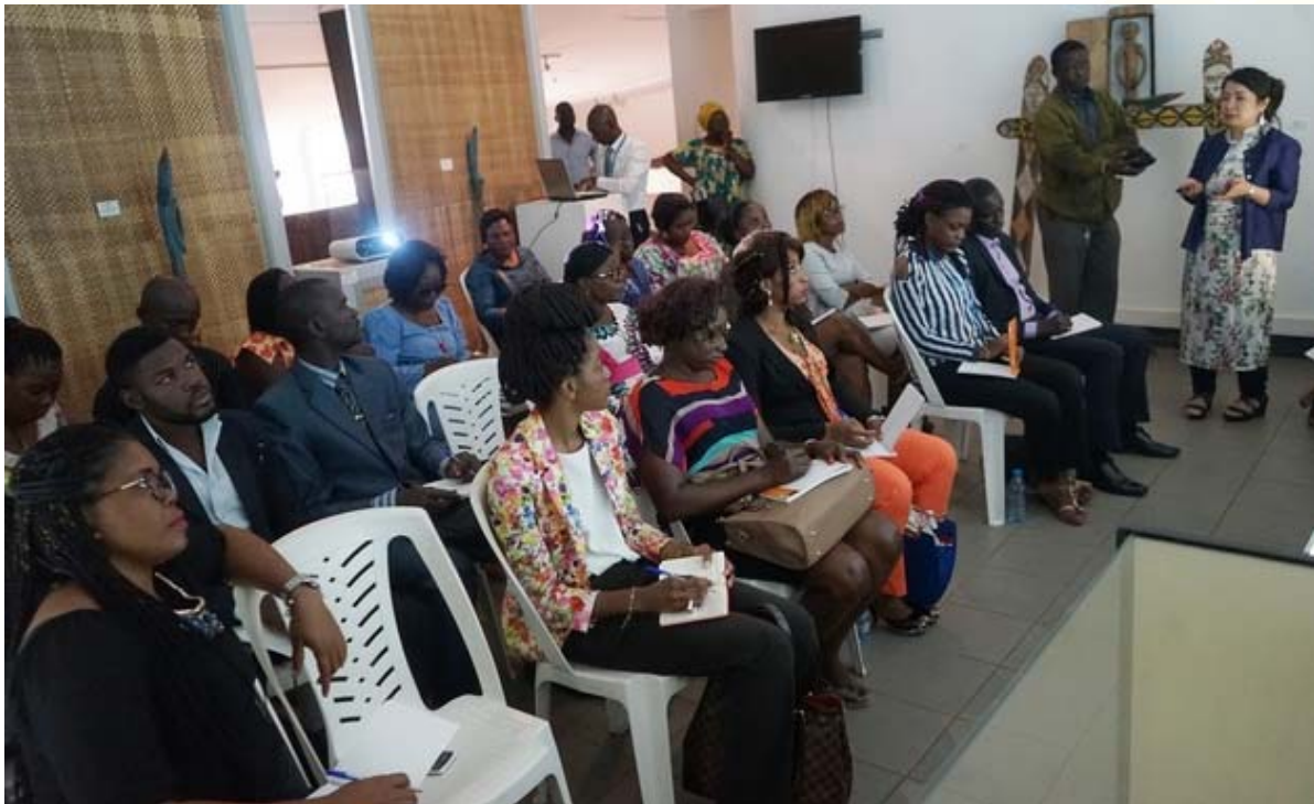
Vue de participants à l'atelier « Inventaire et documentation des collections des musées »