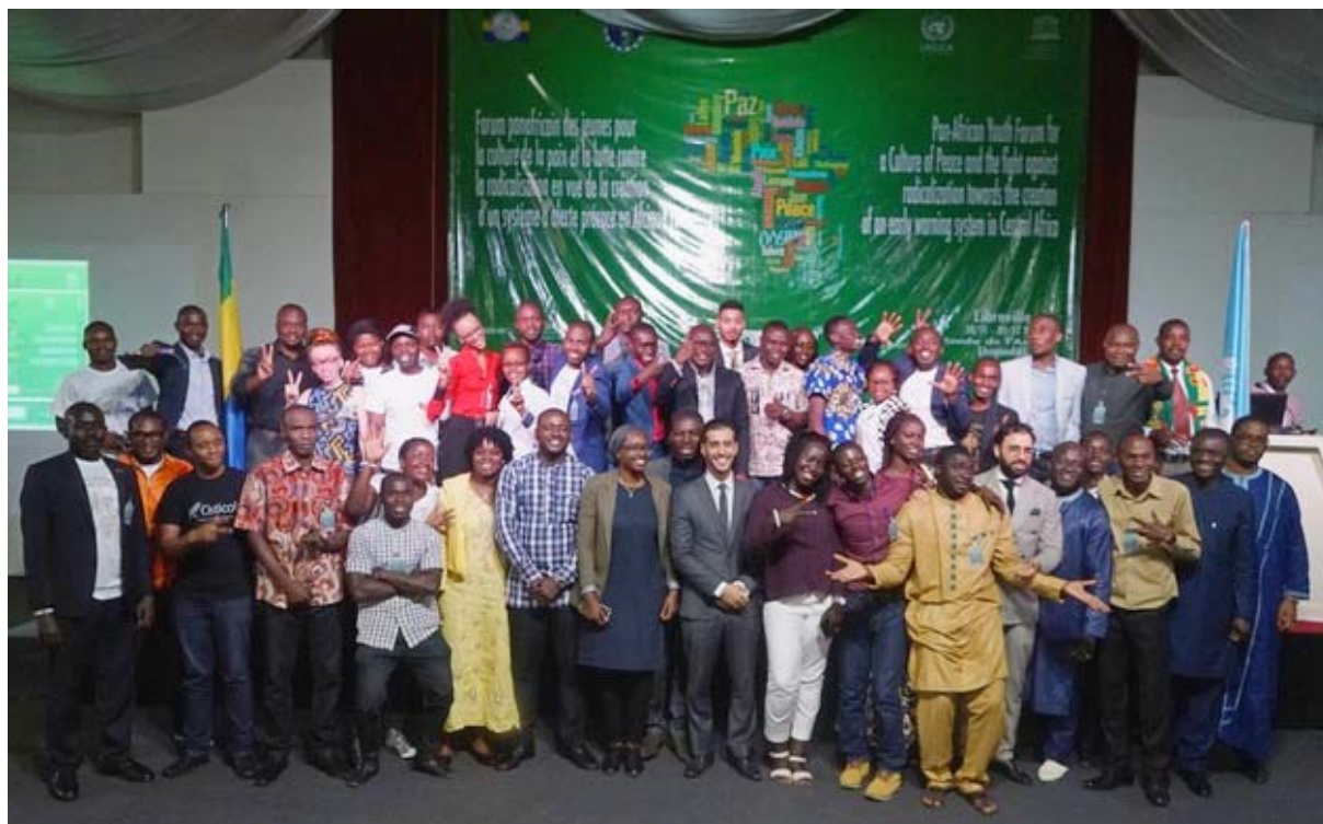
Vue des participants au Forum panafricain des jeunes

Entamée en décembre 2014, l'excellente coopération entre le Gabon et l'UNESCO en terme de promotion de la culture de la paix par l'implication des jeunes s'est poursuivie en 2017 avec la co-organisation, avec le Bureau régional des Nations Unies pour l'Afrique centrale (UNOCA) et la Communauté économique des Etats de l'Afrique centrale (CEEAC), du « Forum panafricain des jeunes pour la culture de la paix et la lutte contre la radicalisation en vue de la création d'un système d'alerte précoce en Afrique centrale ».