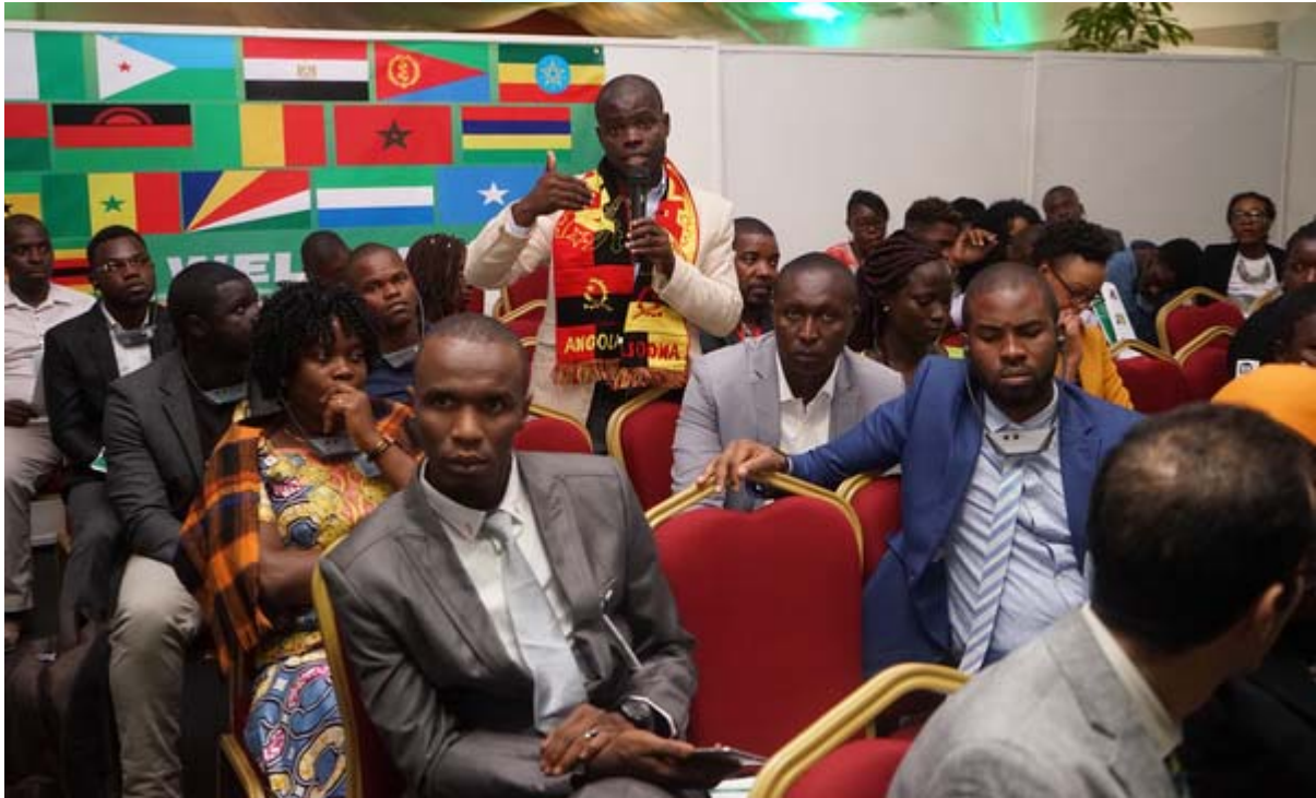
Vue de jeunes lors du Forum panafricain des jeunes pour la culture de la paix

Le Bureau a pris une part active à plusieurs initiatives en lien avec la consolidation et la préservation de la paix. Il s'agit d'abord de sa contribution marquée à l'Organisation de la Conférence de Haut niveau, « Quand les médias créent la paix : une exploration des rôles et responsabilités des médias dans le processus de consolidation de la paix » (Libreville, 25-26 Janvier 2016). Le programme a aussi contribué à l'organisation du Forum panafricain des jeunes pour la culture de la paix (Libreville, 30/11 – 02/12/2017) en vue de promouvoir la lutte contre la radicalisation et le discours violent en ligne.