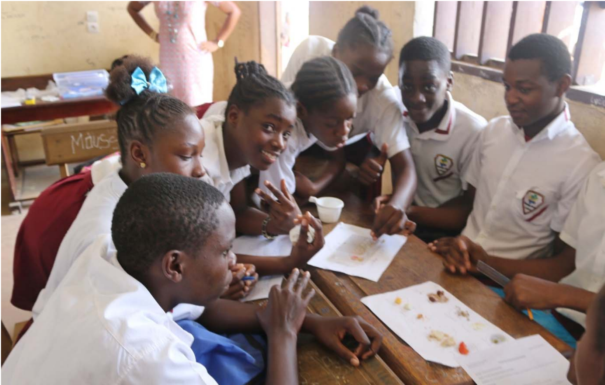
Vue d'élèves de classe de troisième du Lycée Paul Emame Eyéghé

A travers le Bureau de Libreville, l'UNESCO soutient la mise en œuvre du « Projet de redynamisation de l'enseignement des sciences au Gabon par les Microsciences » en partenariat avec la Fondation Sylvia Bongo Ondimba. A ce jour, ce projet a pour résultats la formation du personnel d'encadrement, de formateurs ainsi que de plus de 100 professeurs expérimentateurs dans les provinces de l'Estuaire, Ogooué-Maritime et Woleu-Ntem répartis dans 32 établissements. Aussi, l'UNESCO a offert un lot de 1 000 kits microsciences de base et une quarantaine du modèle avancé au Ministère de l'éducation nationale afin de lui permettre de généraliser cette formation dans les villes suscitées. Grâce à cette dotation, 35.200 élèves expérimentent désormais les microsciences lors des cours des sciences de la vie et de la terre et des sciences physiques.