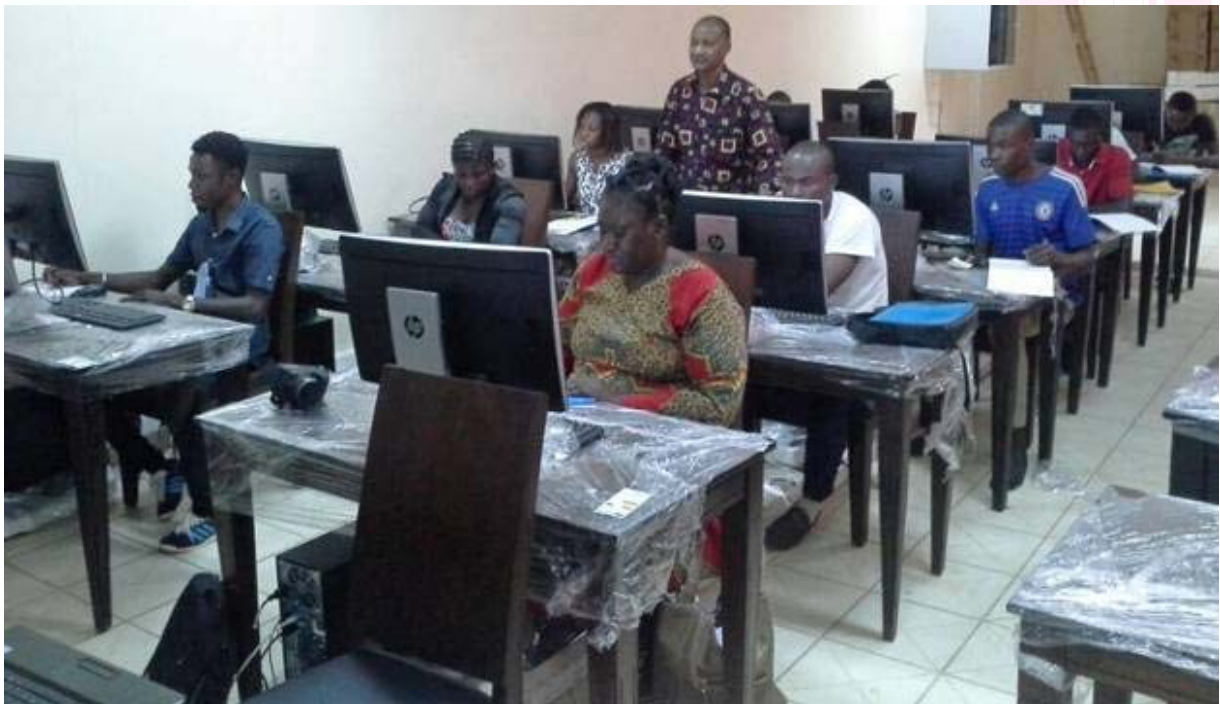
Vue d'une salle de classe de Tchibanga

Le développement des compétences professionnelles pour le travail et l'entrepreneuriat font partie des priorités de l'UNESCO et des Etats partenaires. Au regard de l'absence de politiques en matière d'Enseignement et de formation professionnelle et techniques (EFPT) qui ralentissent la production des savoirs, l'UNESCO à travers son Bureau de Libreville a accompagné le Gouvernement gabonais dans le renforcement de sa politique en la matière.