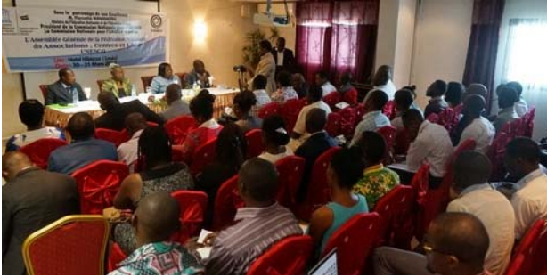
Vue des participants à l'Assemblée générale

Dans le cadre des programmes de participation 2017, la Commission nationale gabonaise pour l'UNESCO a relancé, le 30 mars 2017, le processus de redynamisation des Associations, Centres et Clubs UNESCO locaux en soutenant l'organisation de l'assemblée générale de la fédération qui les compose. Il s'agissait d'examiner et