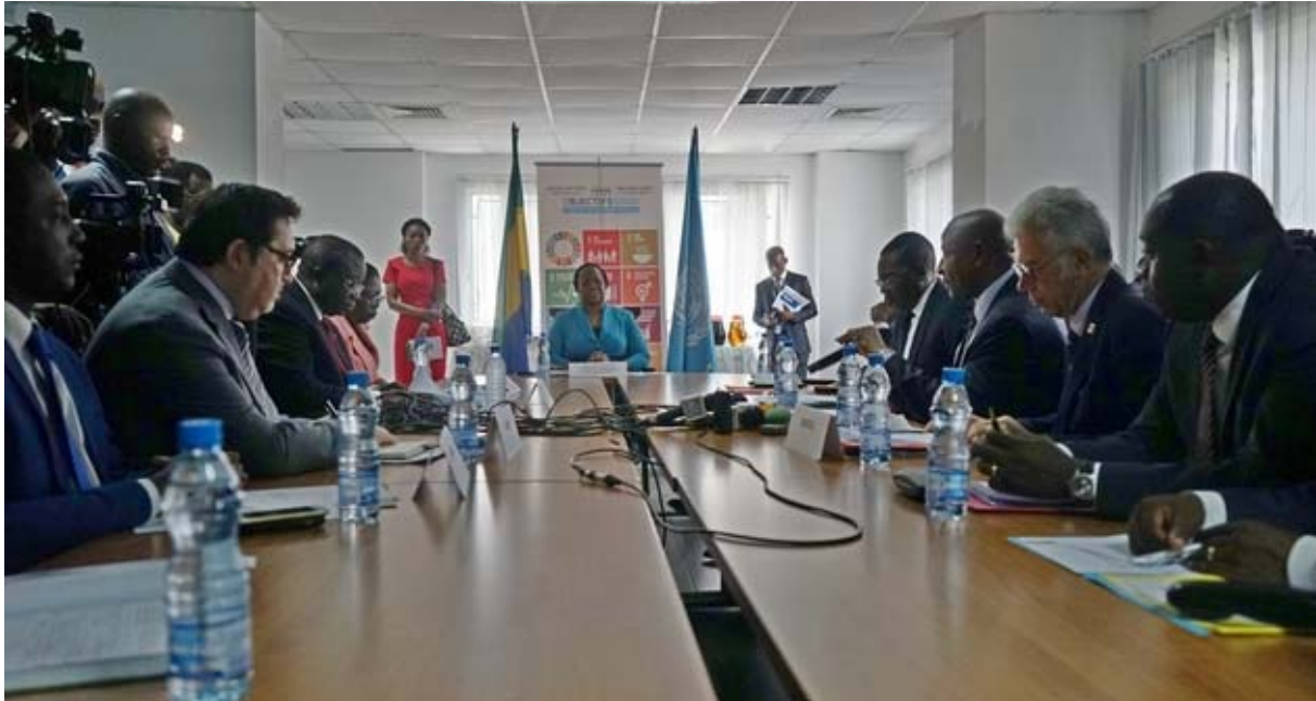
Vue des officiels à la réunion avec les 5 Ministres en charge de l'éducation au Gabon

Nous avons initié en 2017, avec les 5 ministères en charge de l'éducation au Gabon, le processus d'élaboration d'un plan Sectoriel de l'éducation (PSE) inclusif. Ce processus inclut la mise en œuvre de la feuille de route du Cadre d'Action Education 2030. Le PSE fait partie du projet phare de coopération entre le Gabon et l'Unesco 2018- 2022 intitulé « Appui à la production des statistiques de l'éducation et à l'élaboration du plan sectoriel de l'éducation ».