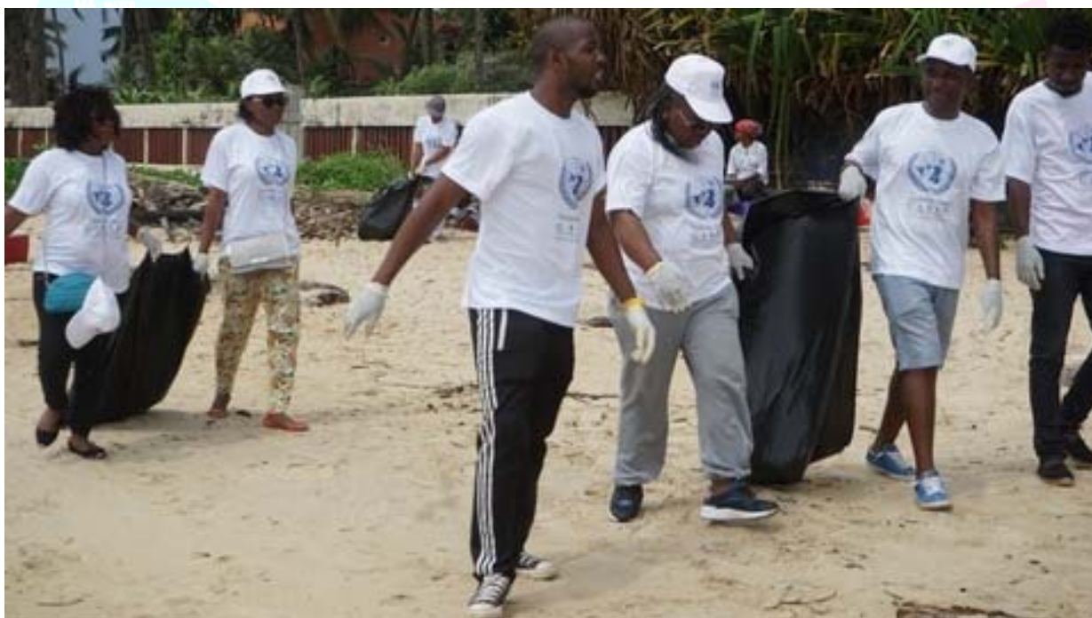
Quelques personnels de l'UNESCO avec leur famille lors du nettoyage des plages

En prélude à la célébration solennelle de l'édition 2017 de la Journée des Nations Unies, les familles du personnel du Système des Nations Unies au Gabon dont celles du Bureau UNESCO à Libreville, le Ministère des Affaires étrangères, des organisations de la société civile ainsi de jeunes volontaires ont organisé, le 22 octobre 2017, une campagne de nettoyage de plages à Libreville. Cette activité a permis, entre autres, de sensibiliser les plagistes sur la nécessité de maintenir ces endroits propres, en d'autres termes, préserver l'environnement, en occurrence la planète.