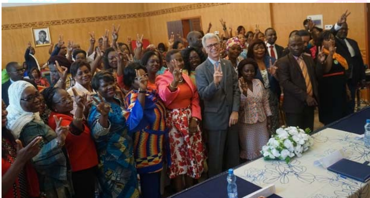
Vue des femmes au terme de la cérémonie d'ouverture de la semaine de la paix

En outre, le 06 avril, lors de la célébration de la Journée internationale du sport au service du développement et de la paix, une initiative du PAYNCOP, le Bureau a participé à la mobilisation et la sensibilisation d'une quarantaine de jeunes sur la pratique du sport et ses valeurs. Par le biais de la projection du film, « L'incroyable équipe » de Sebastian Grobler, le Bureau a montré, entre autres, comment le sport peut être un moyen de fraternisation, au-delà des classes sociales, de rapprochement des peuples et par conséquent être un bon moyen pour promouvoir la paix.