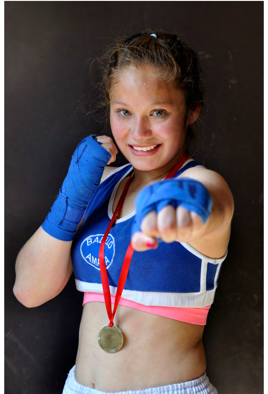
Photographer Juan Espinosa Torres