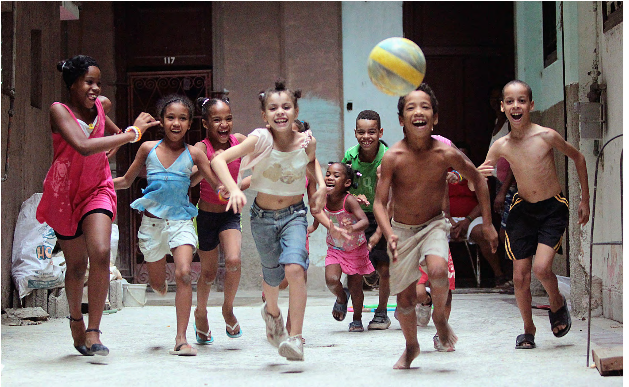
Photographer Jussy Pizarro Chizan