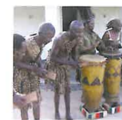
De mbende jerusarema, een dansstijl van de Zezuru Shona, Zimbabwe