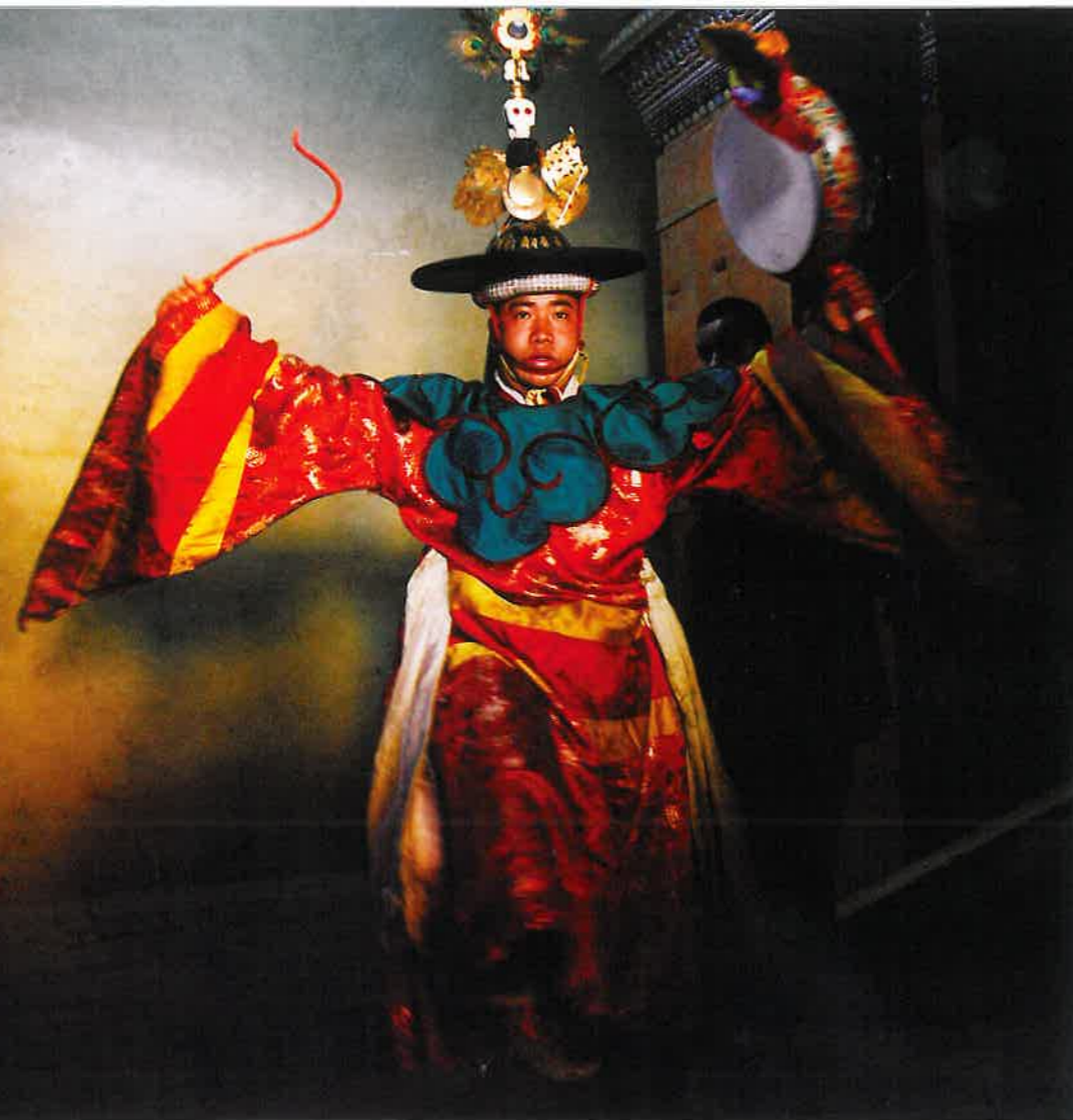
De maskerdans van de trommels van de Drametse, Bhutan