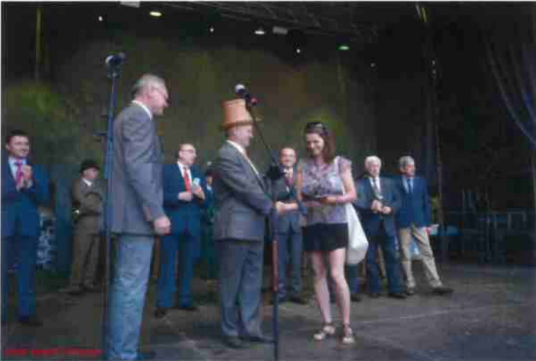
Handing a diploma from Polish National Commission for UNESCO, Nowy Tomyśl, Poland 2015