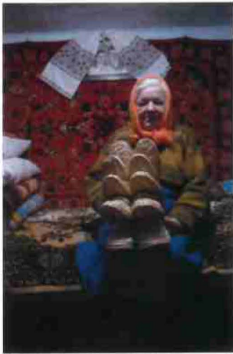
"On the basketry trail of Poland", Lvov, Ukraine 2010/11