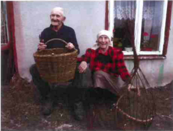
"On the basketry trail of Vistula River", Lucimia, Poland 2009/10