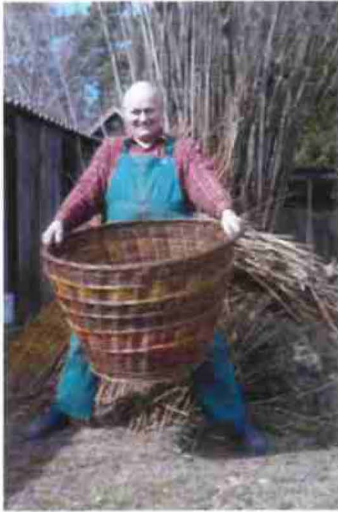
"On the basketry trail of Poland", Cottbus, Germany 2010/11