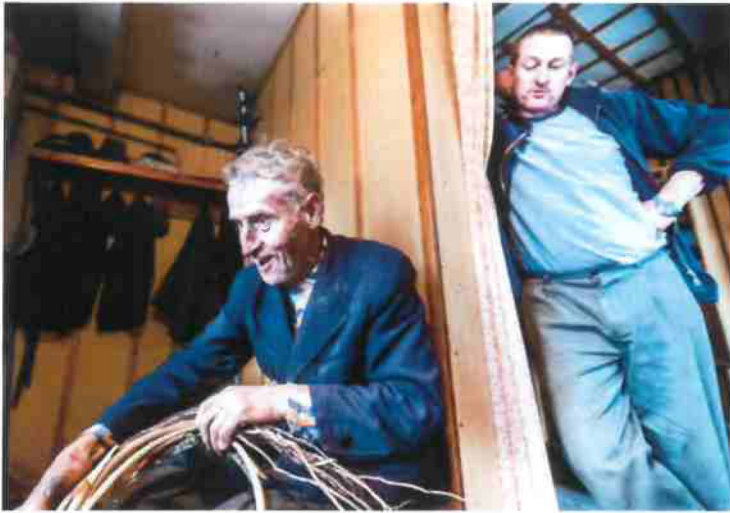
"Viva Basket! Basket weaving as a living tradition in the context of the UNESCO Convention for the Safeguarding of the Intangible Cultural Heritage" Zabagonie, Poland 2014/15