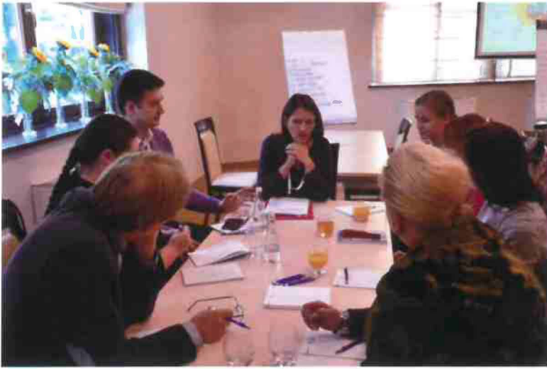
Seminary with National Heritage Board of Poland, Zakopane, Poland 2015