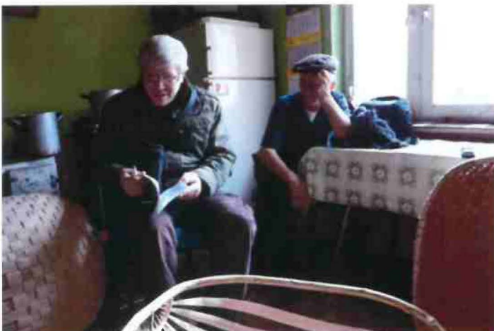
"On the basketry trail of Poland", Zawadka Osiecka, Poland 2010/11