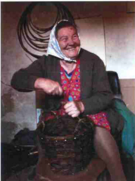
"On the basketry trail of Vistula River", Jankowice, Poland 2009/10