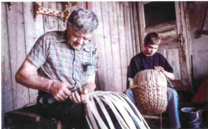
"Viva Basket! Basket weaving as a living tradition in the context of the UNESCO Convention for the Safeguarding of the Intangible Cultural Heritage" Łoniowa, Poland 2014/15