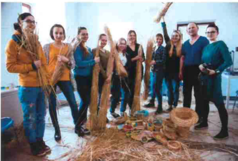
Basketry workshops Alternative Design (Żdźbło design) in cooperation with The Academy of Fine Arts in Kraków, Cieszyn, Poland 2017