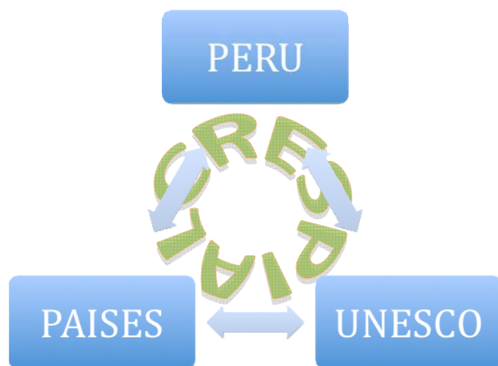
Ilustración 1: Ejes de CRESPIAL

CRESPIAL, si bien es un acuerdo entre Perú y UNESCO, funciona como resultado de la colaboración de tres ejes, y no podría continuar ejerciendo sus funciones de faltar uno de ellos.