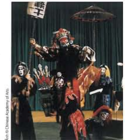
📍 Kinh kịch, Trung Quốc