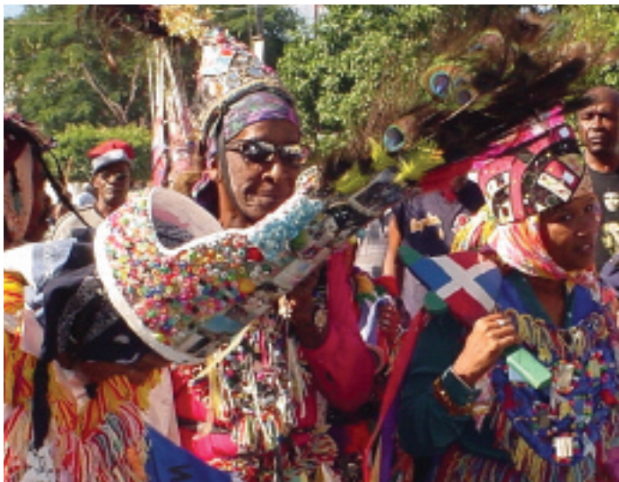
☞ Dominikaani Vabariigi cocolo kogukonna traditsiooniline etenduskunst.