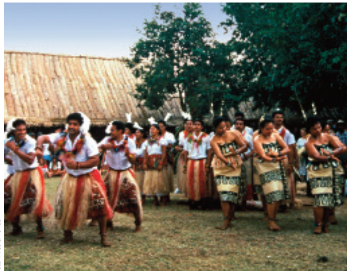
☞ Tonga saartel tantsitakse lakalaka't lauldes ja plaksutades.