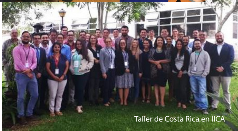
Taller de Costa Rica en IICA