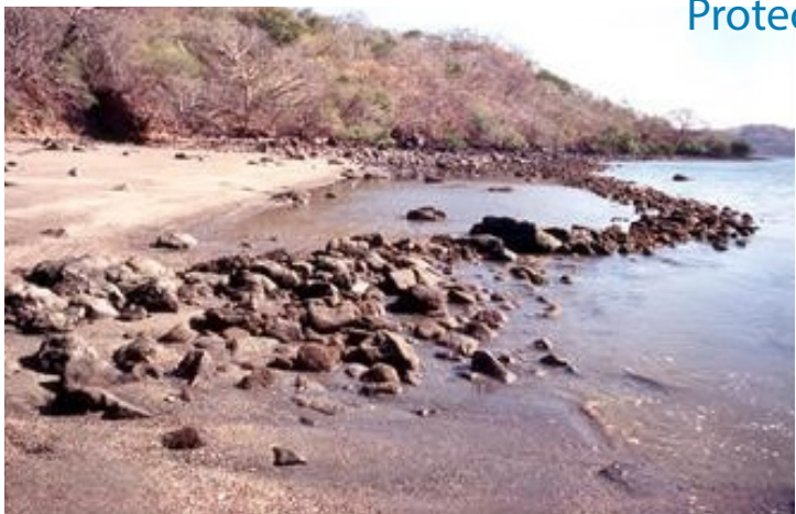
© MNCR Trampas para pescar en bahía Culebra

Costa Rica ratifica la Convención de la UNESCO sobre Protección del Patrimonio Cultural Subacuático. La ratificación de Costa Rica es la 60ª a nivel mundial y la 20ª en la Región; con esto, el país se une a la mayoría de los Estados de la región de América Latina y el Caribe.