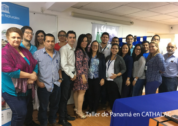
Taller de Panamá en CATHALAC

Representación para Costa Rica, El Salvador, Honduras, Nicaragua y Panamá