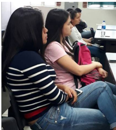
© Universidad Centroamericana José Simeón Cañas