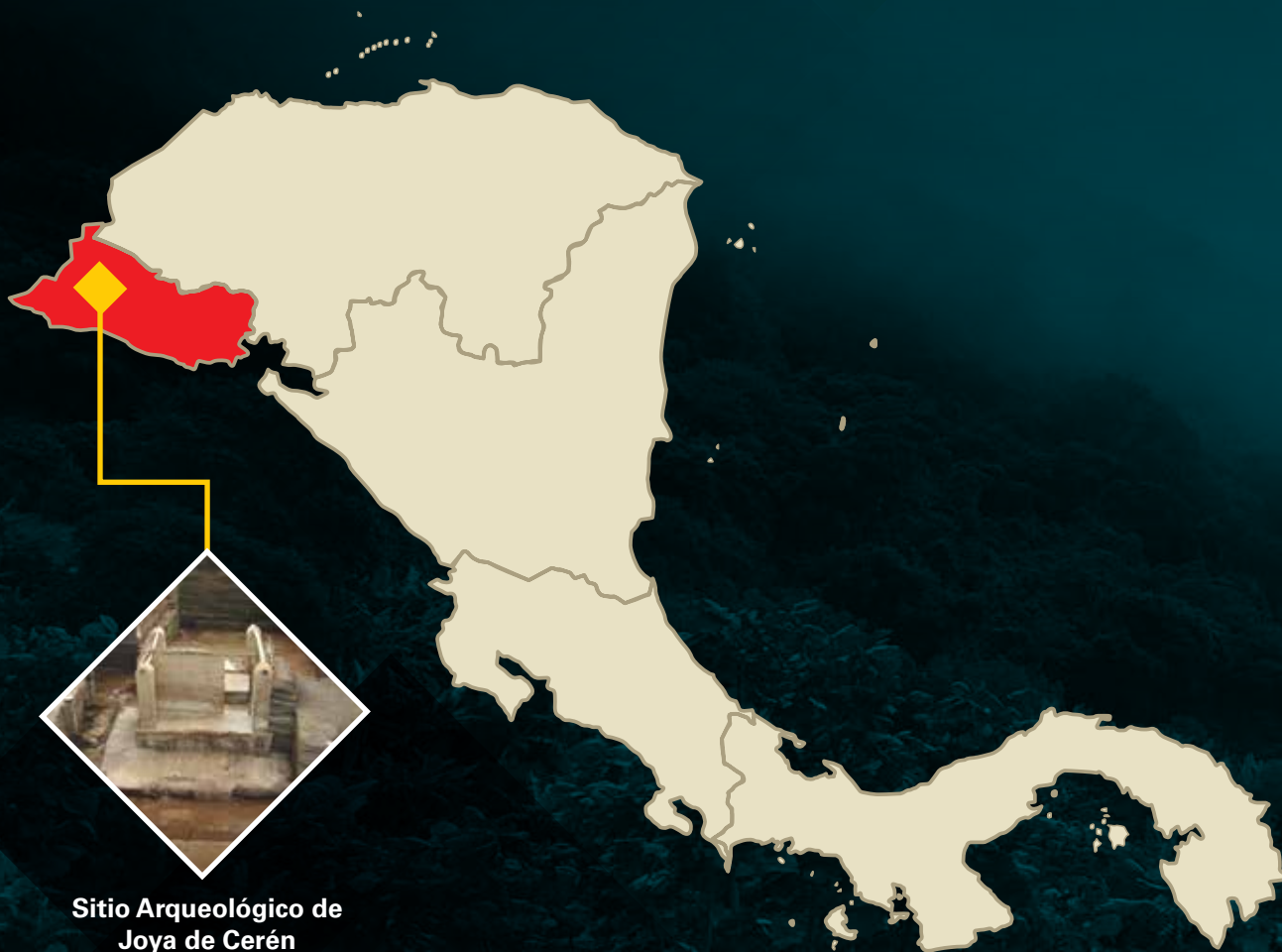
Sitio Arqueológico de Joya de Cerén