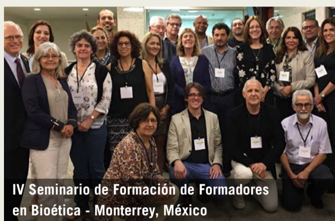
IV Seminario de Formación de Formadores en Bioética - Monterrey, México