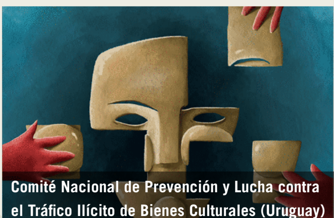
Comité Nacional de Prevención y Lucha contra el Tráfico Ilícito de Bienes Culturales (Uruguay)