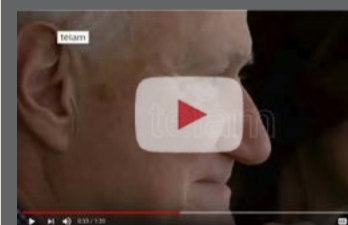
Visita Oficial a la Argentina del Subdirector General de Cultura de la UNESCO