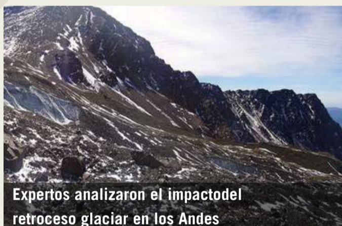
Expertos analizaron el impacto del retroceso glaciar en los Andes