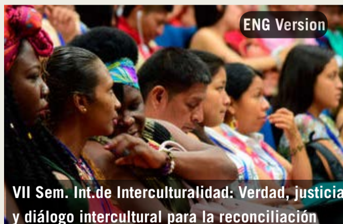
VII Sem. Int. de Interculturalidad: Verdad, justicia y diálogo intercultural para la reconciliación