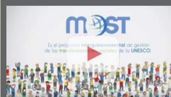
¿Conoce la acción de nuestro Programa Intergubernamental de Gestión de las Transformaciones sociales en América Latina?