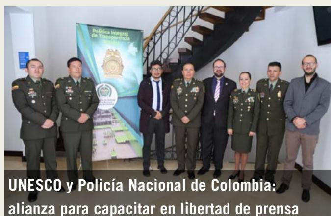
UNESCO y Policía Nacional de Colombia: alianza para capacitar en libertad de prensa