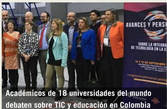
Académicos de 18 universidades del mundo debaten sobre TIC y educación en Colombia