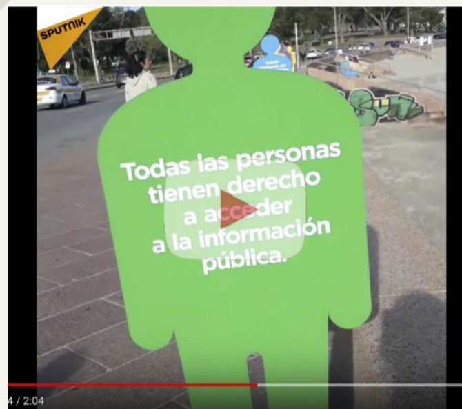
Resumen del Día Internacional del Acceso a la Información Pública: 28 de septiembre de 2017