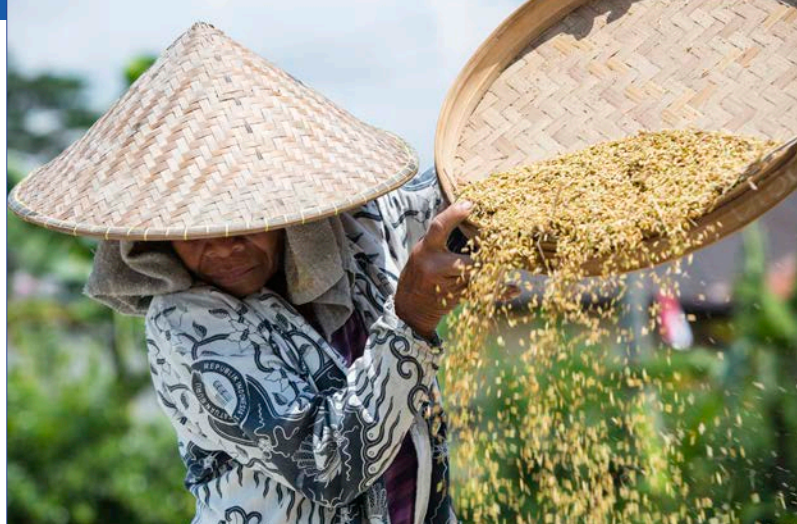
印度尼西亚巴厘岛乌布镇稻农