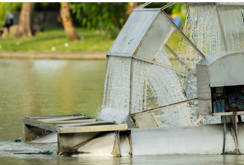
泰国公园中的查巴塔那水轮机

对能源的需求在增加，发展中国家和新兴国家对电力的需求尤为突出。能源行业的采水量在增加，目前已占全世界耗水量的15%，直接创造了就业。能源生产对发展必不可少，为各行各业直接或间接创造了就业。可再生能源行业的发展使绿色的、不依赖水的行业的就业机会增加。