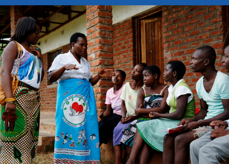
社区工作者讨论会