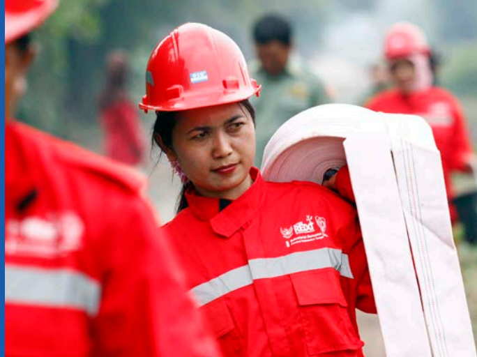
印度尼西亚中加里曼丹省帕朗卡拉亚市加兰堂村消防员进行消防演习