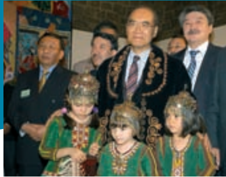
Коитиро Мацуура (Япония) в 1999 г. был избран Генеральным директором ЮНЕСКО и в 2005 г. переизбран на эту должность.

Высшим органом, принимающим решения, является Генеральная конференция ЮНЕСКО, в которой участвуют представители всех государств-членов. На своих сессиях, которые проводятся один раз в два года, она определяет политику и основные направления работы Организации. Действуя на основе принципа «одна страна – один голос», она утверждает двухлетний бюджет и программу ЮНЕСКО. Один раз в четыре года она назначает Генерального директора ЮНЕСКО, основываясь на рекомендации Исполнительного совета.