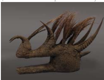
Masque du Komo