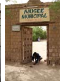
Musée municipal, Tombouctou