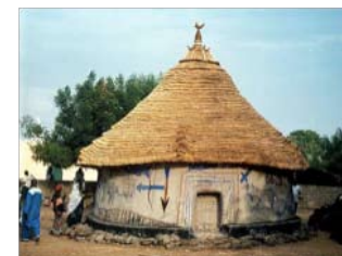
La case sacrée de Kangaba

! ATTENTION, CERTAINES EXPRESSIONS CULTURELLES ET CERTAINS LIEUX COMMUNAUTAIRES EXIGENT UNE CONDUITE QUI N'EST PAS LA MÊME QUE CHEZ VOUS.