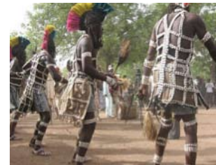
Sanké Mon