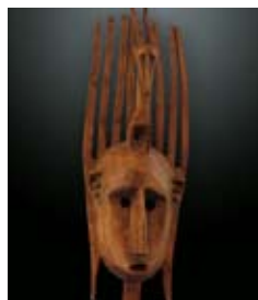
Masque Ntomo