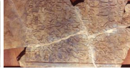
Stèle funéraire