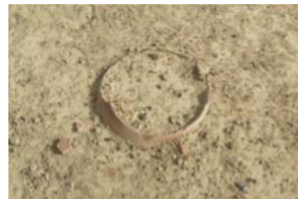
Jarre funéraire