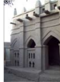
Maison Saho, Djenné