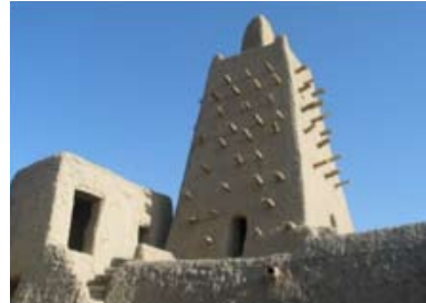
Mosquée de Djingareyber, Tombouctou