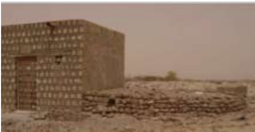
Mausolée Cheick Sidi Aboukhassoum, cimetière des trois saints