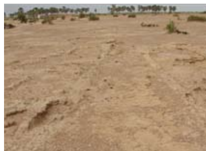
Site archéologique d'Es-Souk