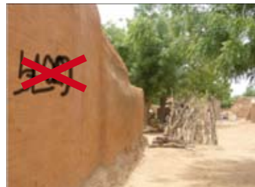
Mur avec graffiti