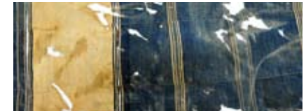
Tissu Tellem