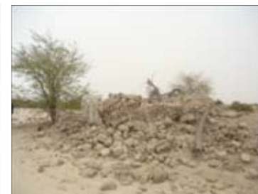
Mausolée Ben Amar détruit, Tombouctou

Pendant votre mission, vous devez impérativement éviter de :