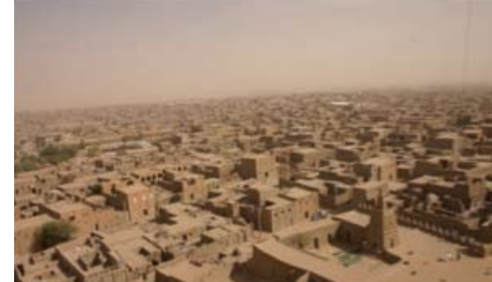
Vue aérienne de Tombouctou