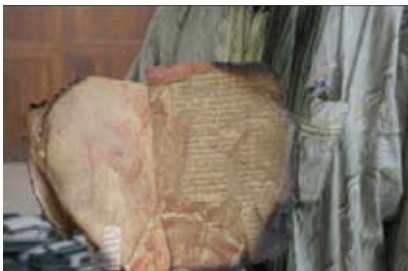
Centre Ahmed Baba