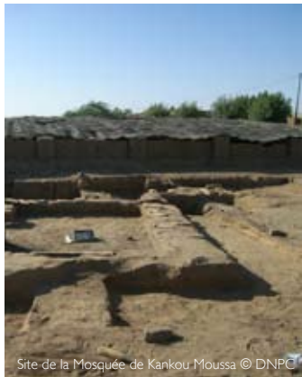
Site de la Mosquée de Kankou Moussa

Ces deux derniers ont été placés sur la Liste du patrimoine mondial en péril en 2012.