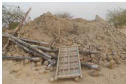
Mausolée Ben Amar détruit, Tombouctou