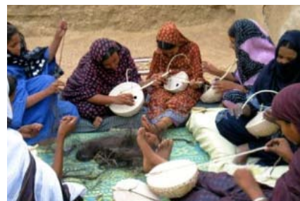
Fabrication d'instruments de musique