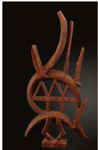
Ciwara, Sogonikun, Bamana