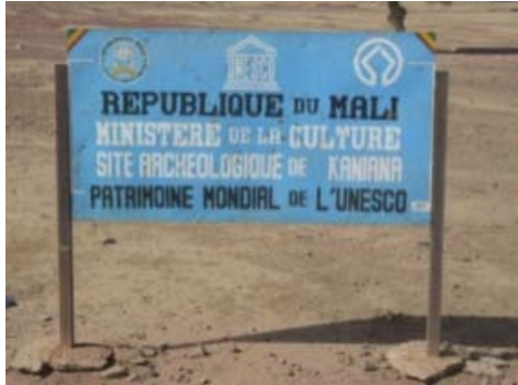
Site archéologique de Tonomba

Faites attention aux signes indiquant un site culturel : barrières, panneaux, plaques commémoratives, emblèmes, etc. Mais certains sites ne comportent pas de telles indications.