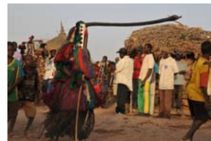
Bankass, danse des masques