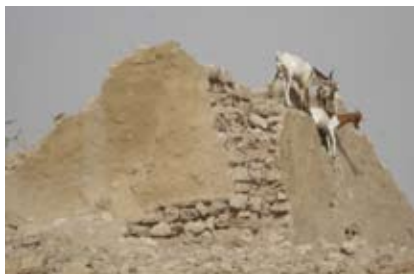
Mausolée Alpha Moya