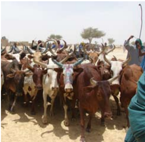
Yaaraal dégal