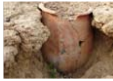
Jarre funéraire