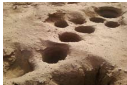
Site archéologique Gao-Saneye