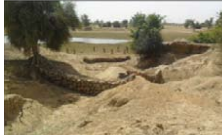
Site archéologique de Djenné-Djeno