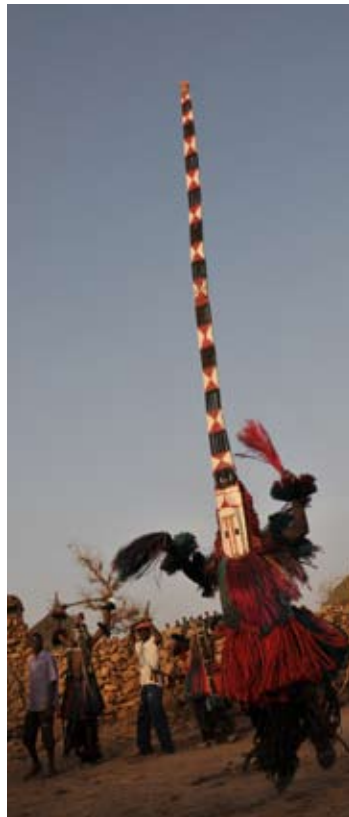
Cérémonie de masques, pays dogon