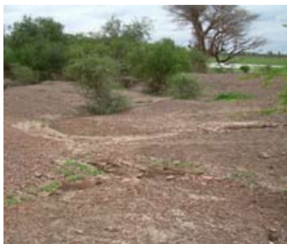
Site archéologique de Djenné-Djeno