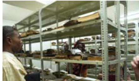
Centre Ahmed Baba, Tombouctou