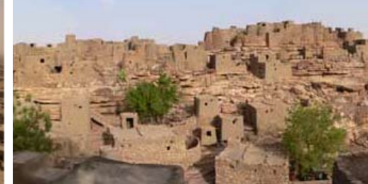
Falaises de Bandiagara