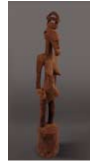
Figurine Sénoufo © Musée national du Mali