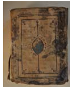
Manuscrits © Musée national du Mali