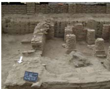
Site archéologique de Kankou Moussa