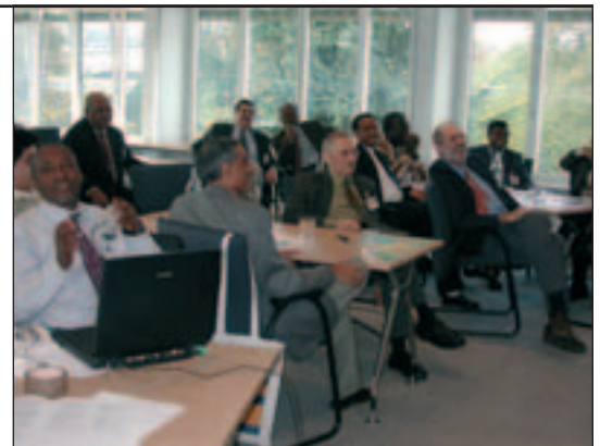
Des participants à la réunion du réseau des centres UNEVOC, octobre 2004

Ces propositions seront examinées et constitue-