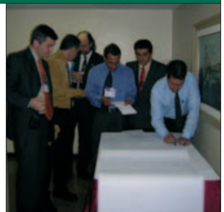
Discussion en groupe de travail

Cette réunion a été organisée conjointement avec l'UNESCO Brésil, en coopération avec le Bureau régional de l'UNESCO pour l'éducation en Amérique latine et dans les Caraïbes (OREALC) et le Centre interaméricain de recherche et de documentation sur la formation professionnelle de l'OIT (CINTERFOR), et avec le soutien du ministère brésilien de l'éducation.