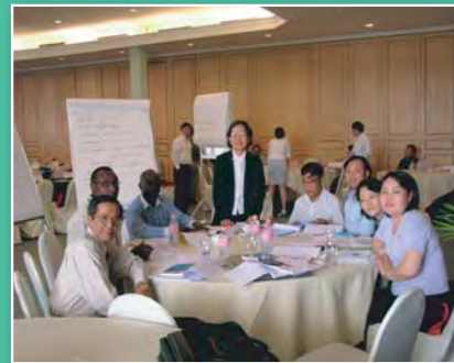
Participants du cours de l'IIPE sur les ESDP organisé avec la Banque mondiale à Phnom Penh, Cambodge