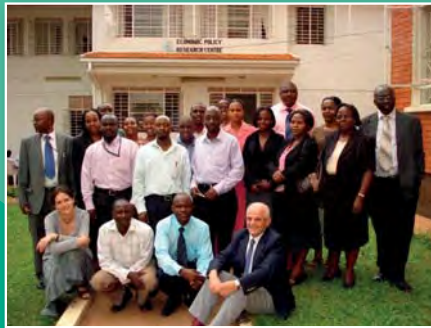
Participants du cours de l'IIPE sur les ESDP, organisé à Kampala, Ouganda

L'IIPE a formé plus de 200 personnes à élaborer et à mener de telles enquêtes (principalement des représentants des ministères des Finances, de l'Éducation et de la Santé, des membres des bureaux nationaux des statistiques et des représentants de la société civile, par exemple en Ouganda, au Ghana, en Afrique du Sud et au Cambodge).