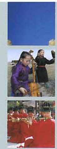
Di sản Văn hóa Phi vật thể

thể hiện có trên lãnh thổ của Quốc gia và đã được đưa vào Danh sách Đại diện. Mỗi Quốc gia thành viên cũng sẽ nộp cho Ủy ban báo cáo về tình trạng của các di sản văn hóa phi vật thể hiện có trên lãnh thổ của mình và đã được đưa vào Danh sách Bảo vệ Khẩn cấp.