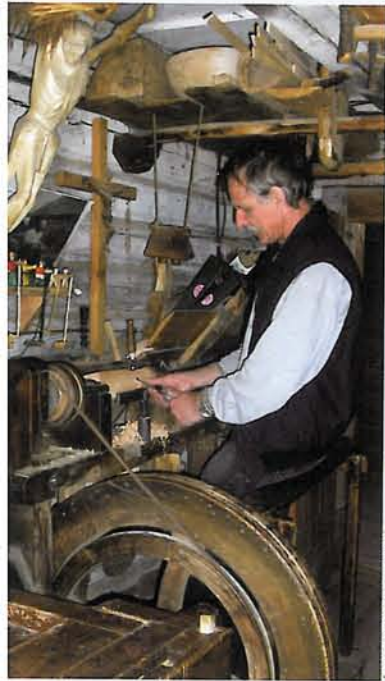
Nghệ thuật làm thánh giá ở Lithuania