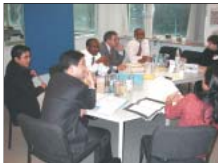
Discusión de grupo de trabajo

La reunión procedió a examinar toda una serie de asuntos relacionados con la declaración de objetivos y la definición de la Red UNEVOC, su gestión y su gobierno, las funciones y responsabilidades de sus asociados.