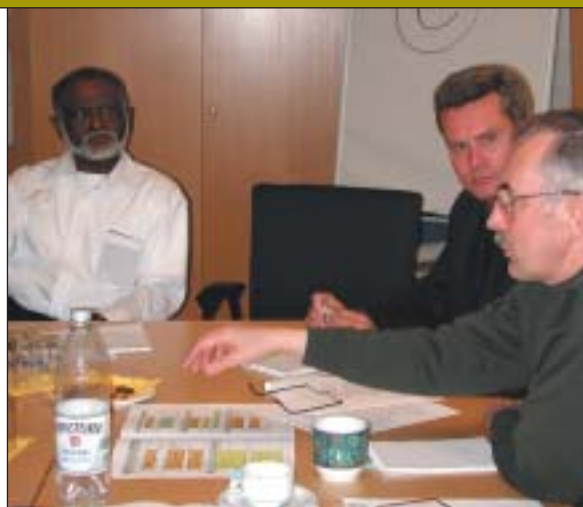
Participantes en el Debate Intensivo, febrero 2004.

Como demuestran las publicaciones enumeradas al final de este Boletín, los países desarrollados ya están realizando alguna labor sobre la FTP para el desarrollo sostenible, pero no puede decirse lo mismo de los países en vías de desarrollo. En consecuencia, el Centro Internacional UNESCO-UNEVOC ha hecho pública una 'Solicitud pública de contribuciones', que puede consultarse en el espacio internet del Centro www.unevoc.unesco.org/sustainable . Con la solicitud pretendemos descubrir más iniciativas en este ámbito, particularmente dentro de los países en vías de desarrollo, en vías de industrialización o en periodo de postguerra, como contribución a la reunión que se celebrará este otoño.