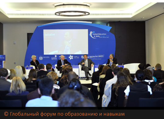
© Глобальный форум по образованию и навыкам

неправительственными организациями и лидерами бизнеса, с намерением укрепления связей и дальнейшего вовлечения частного сектора в сферу образования.