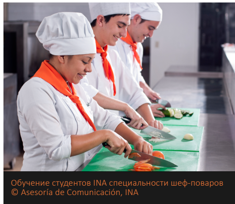
Обучение студентов INA специальности шеф-поваров

INA – институт технического обучения и развития навыков, а также координатор латиноамериканского кластера Сети ЮНЕВОК. Основная задача института заключается в бесплатном обучении квалифицированному ремеслу всех желающих старше 15 лет, с целью продвижения экономического развития и внесения вклада в улучшение