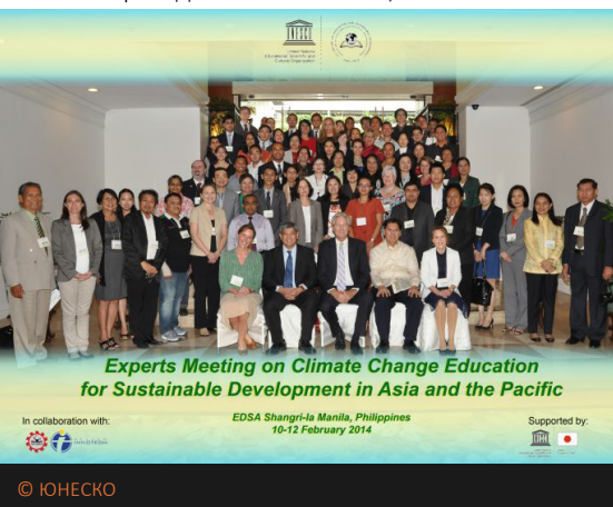
Experts Meeting on Climate Change Education for Sustainable Development in Asia and the Pacific

Среди ключевых докладчиков были Президент Билл Клинтон, Салил