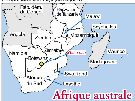
Afrique australe: Pays participants

Des décideurs et experts de l'enseignement et de la formation techniques et professionnels (EFTP) de douze pays d'Afrique australe (Botswana, Lesotho, Malawi, Maurice, Mozambique, Namibie, Seychelles, Afrique du Sud, Swaziland, République-Unie de Tanzanie, Zambie et Zimbabwe) ont élaboré des propositions de coopération dans les domaines suivants: