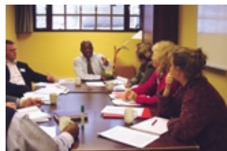
Participantes del seminario para la Supervivencia y el Desarrollo en África Meridional, Oslo, 14 al 15 de noviembre 2002

Este seminario se llevó a cabo en Oslo los días 14 y 15 de noviembre de 2002, por iniciativa conjunta de la Red Escandinava de Centros UNEVOC, de las Comisiones UNESCO de Noruega y Finlandia, del Ministerio de Educación e Investigación noruego y del Centro Internacional UNESCO-UNEVOC. La NORAD, Agencia Noruega de Cooperación al Desarrollo, y los ministerios noruego y finlandés de Asuntos Exteriores prestaron su apoyo financiero a la iniciativa.