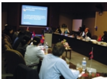
Seminario sobre FTP para el siglo XXI respecto a las Recomendaciones de la UNESCO y la OIT

La Sección de Enseñanza Técnica y Profesional de la UNESCO en París llevó a cabo en el otoño de 2002 dos seminarios regionales concebidos para ayudar a los Estados Miembros a llevar a la práctica las normas incluidas en la publicación conjunta UNESCO-OIT Formación técnica y profesional para el siglo XXI – Recomendaciones de la UNESCO y la OIT . El primer seminario se efectuó en Tokio entre el 24 de septiembre y el 2 de octubre de 2002, en colaboración con el Instituto Nacional de Investigación en Política Educativa japonés (NIER). La actividad estaba destinada a la región asiática e incluía la participación de responsables políticos de alto nivel de Afganistán, Bangladesh, Camboya, Laos, Mongolia, Myanmar, Nepal, Pakistán, Sri Lanka, Tailandia y Vietnam. Una característica del seminario fue la asistencia de un miembro del personal de la OIT como persona de referencia. Al segundo seminario, celebrado en Moscú entre el 21 y el 25 de octubre de 2002, asistieron representantes procedentes de Armenia, Azerbaiyán, Bielorrusia, Georgia, Kachastán, Kirgistán, Moldavia, la Federación Rusa, Tayikistán, Ucrania y Uzbekistán.