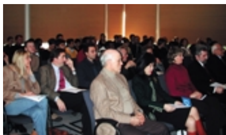
Participantes del seminario Outreach (Alcance), 10 de febrero de 2003