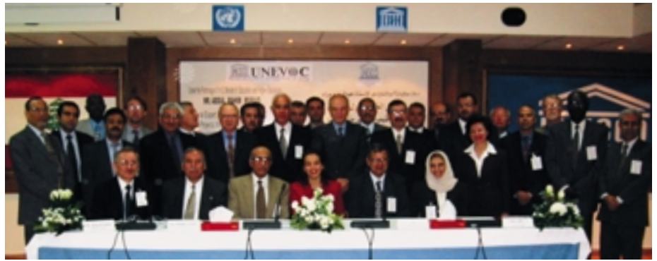
Reunión de Expertos Regionales sobre FTP, Beirut, 11 al 13 de diciembre 2002

Bajo los auspicios de S. E. Sr. Abdel Rahim Murad, Ministro de Educación y de Enseñanza Superior, la Oficina Regional de la