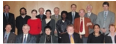
Reunión plantaficatoria de Educación (EFA) y del Desarrollo de Capacidades, 17 de enero de 2003

El 17 de enero de 2003 se celebró una reunión planificatoria en el Centro Internacional UNESCO-UNEVOC para debatir los detalles organizativos de un acto a gran escala centrado en la relación entre la Educación para Todos (EFA) y el