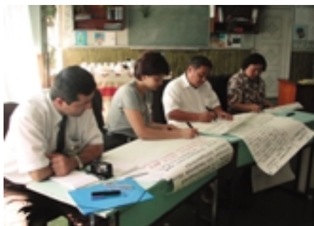
Participantes del seminario en Alma Ata, septiembre 2002

Un resultado de la primera fase de este proyecto fue la elaboración de un modelo para la colaboración social. En una segunda fase, se creó un Consejo de Expertos en Alma Ata, compuesto por autoridades municipales, empresarios y organizaciones de FTP, con el objetivo de realizar en la práctica el modelo propuesto. La tarea fundamental de este Consejo de Expertos consiste en coordinar actividades conjuntas de los protagonistas de la FTP, constituirse en foro para desarrollar una visión común sobre la colaboración social en la FTP, reforzar los