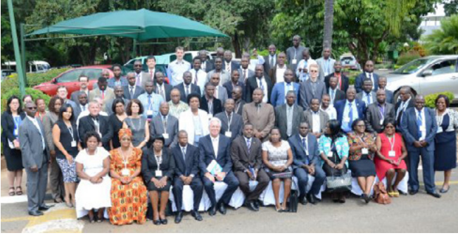
المشاركون في منتدى الجنوب الإفريقي للتعليم والتدريب المهني والتقني وتدريب المعلمين وتخصير التعليم والتدريب التقني والمهني