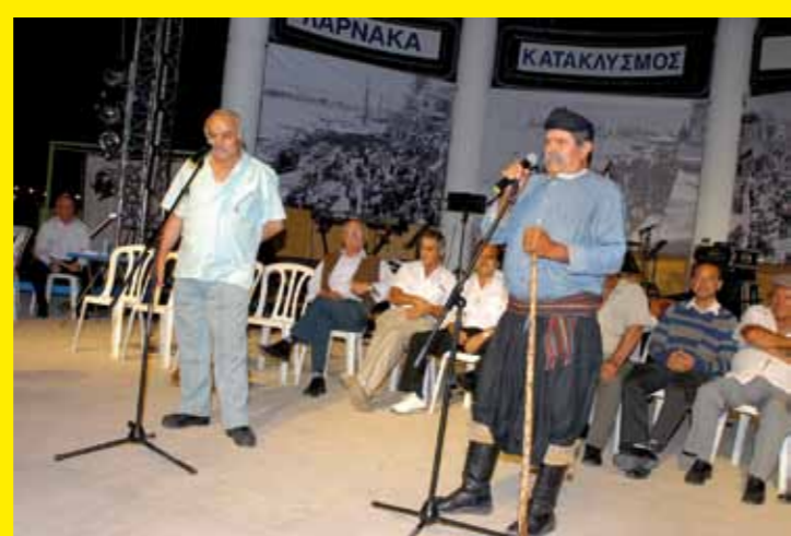
● CHYPRE – Les Teliastia, Joutes poétiques © 2011, Larissa Hovancak