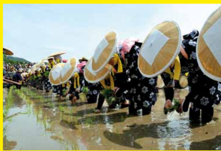
● JAPON – Le Mibu no Hana Tsuru, rituel du repiquage du riz à Mibu, Hiroshima