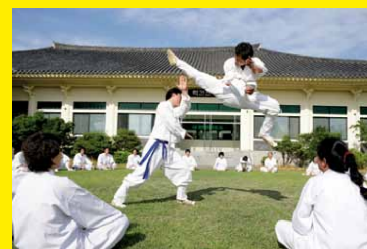
● RÉPUBLIQUE DE CORÉE – Le Taekkyeon, un art martial traditionnel coréen