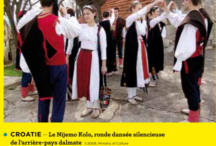
● CROATIE – Le Nijemo Kolo, ronde dansée silencieuse de l'arrière-pays dalmate