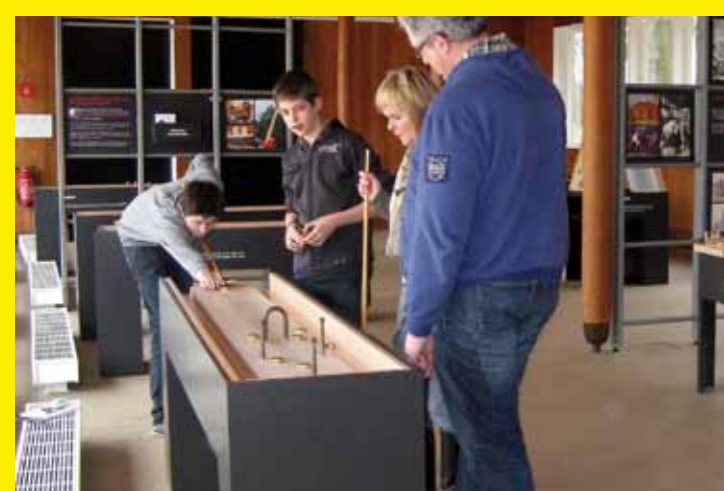
■ BELGIQUE – Un programme pour cultiver la ludodiversité : la sauvegarde des jeux traditionnels en Flandre