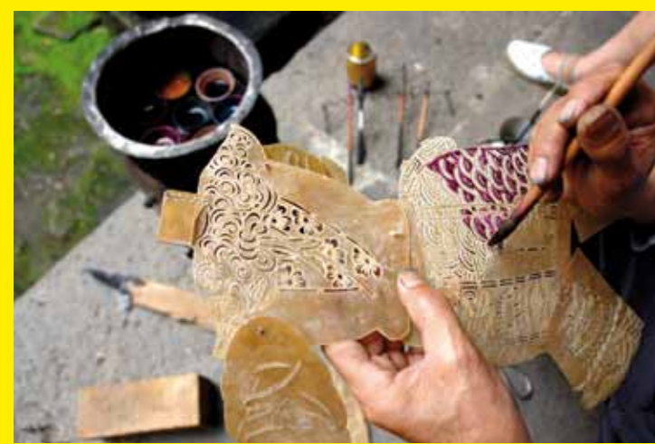
● CHINE – Le théâtre d'ombres chinoises