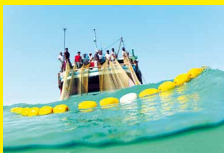
▲ IRAN (RÉPUBLIQUE ISLAMIQUE D') – Les compétences traditionnelles de construction et de navigation des bateaux iraniens Lej dans le golfe Persique