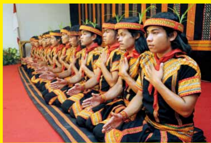
▲ INDONÉSIE – La danse Saman