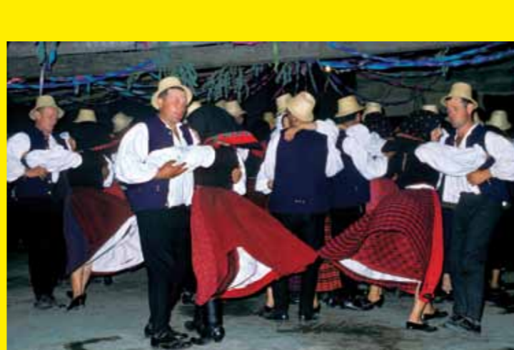
■ HONGRIE – La méthode Táncház : un modèle hongrois pour la transmission du patrimoine culturel immatériel