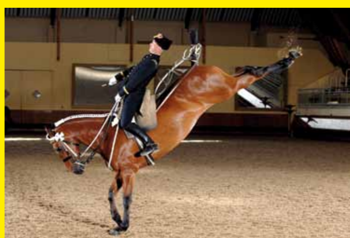
▲ FRANCE – L'équitation de tradition française