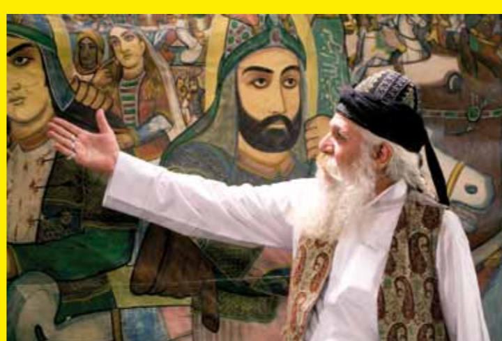
▲ IRAN (RÉPUBLIQUE ISLAMIQUE D') – Le Naqqali, narration dramatique iranienne