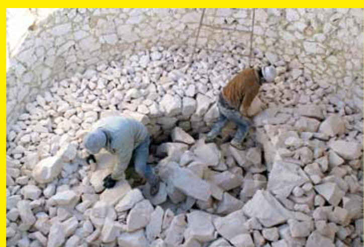
■ ESPAGNE – La revitalisation du savoir traditionnel de l'élaboration de la chaux artisanale à Mórón de la Frontera, Séville, Andalousie