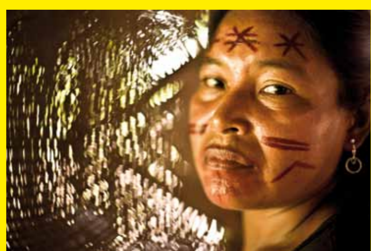
● COLOMBIE – Le savoir traditionnel des chamanes jaguars de Yurupari