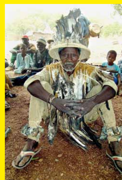
▲ MALI – La société secrète des Kôrédugaw, rite de sagesse du Mali