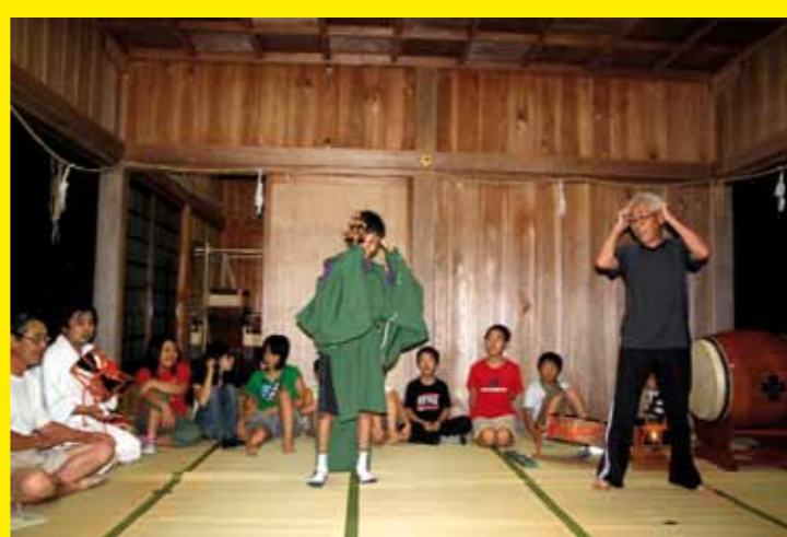
● JAPON – Le Sada Shin Noh, danse sacrée au sanctuaire de Sada, Shimane