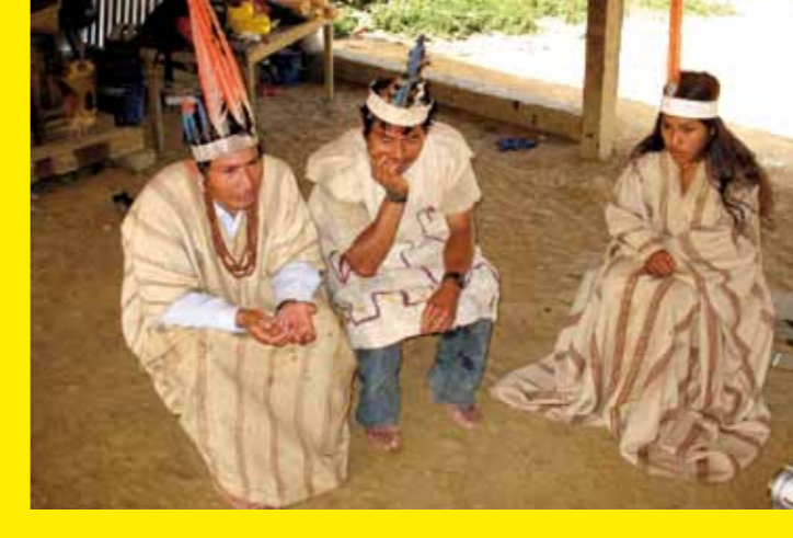
▲ PÉROU – Eshuva, prières chantées en Harákmbut des Hucshipaïra du Pérou