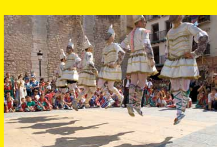
● ESPAGNE – La fête de « la Mare de Déu de la Salut » d'Algemesí