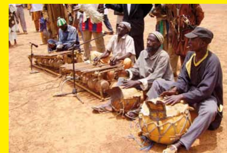
● MALI, BURKINA FASO – Pratiques et expressions culturelles liées au balafon des communautés Sénoufo du Mali et du Burkina Faso