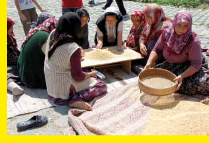
● TURQUIE – La tradition cérémonielle du Keşkek