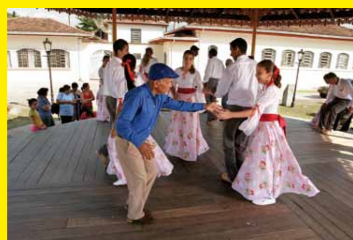
■ BRÉSIL – Le musée vivant du Fandango