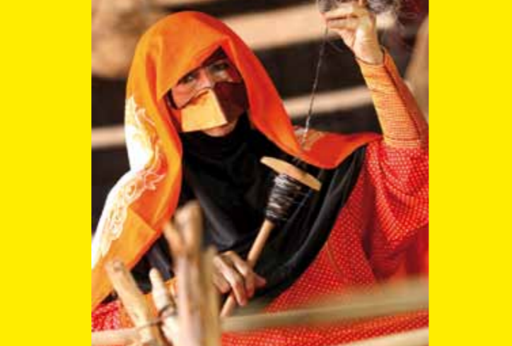
▲ ÉMIRATS ARABES UNIS – Al Sadu, tissage traditionnel dans les Émirats arabes unis