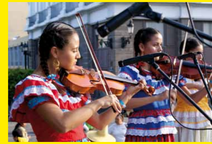
● MEXIQUE – Le Mariachi, musique à cordes, chant et trompette