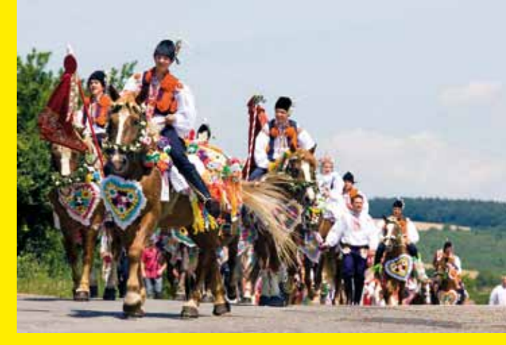
● RÉPUBLIQUE TCHÈQUE – Le chant Xoan de la Province du Phú Thọ (Viet Nam) de la République tchèque