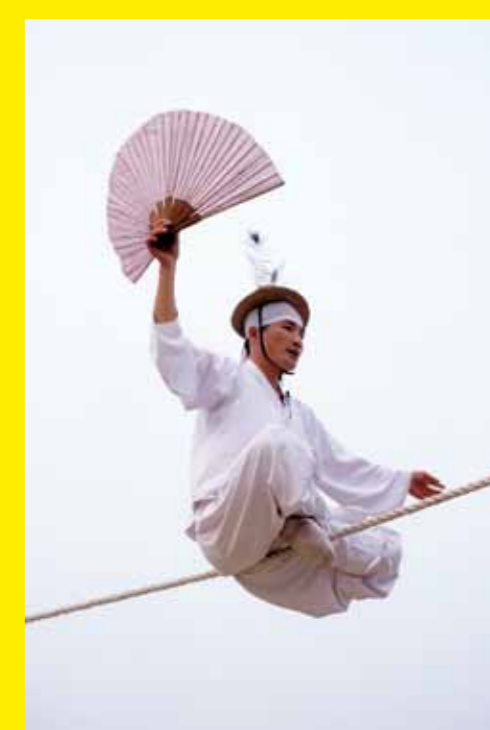
● RÉPUBLIQUE DE CORÉE – Le Jultagi, marche sur corde raide