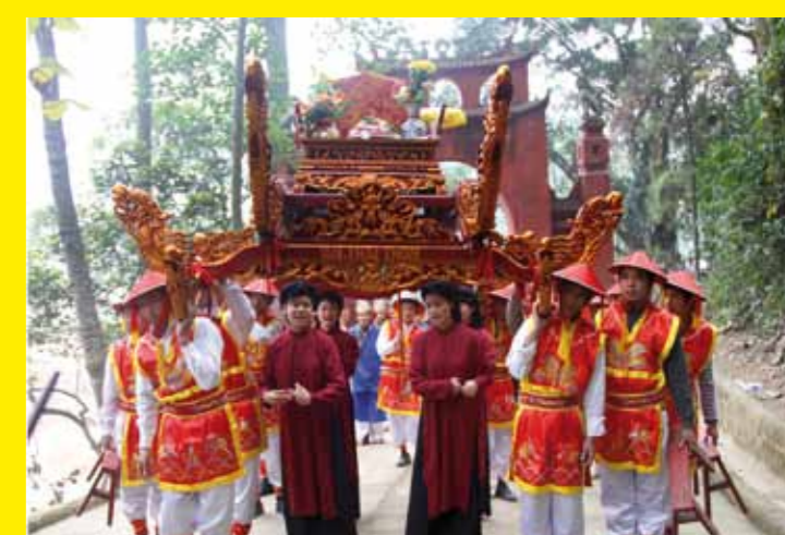
▲ VIET NAM – Le chant Xoan de la Province du Phú Thọ (Viet Nam)

Composition : graphique et illustrations : Emmanuel Gaudin - www.le-miroir.net