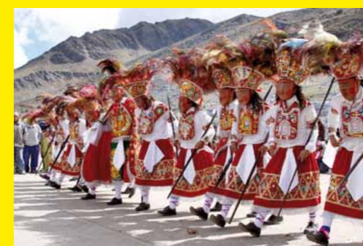
● PÉROU – Le pèlerinage au sanctuaire du seigneur de Qoyllurich'i