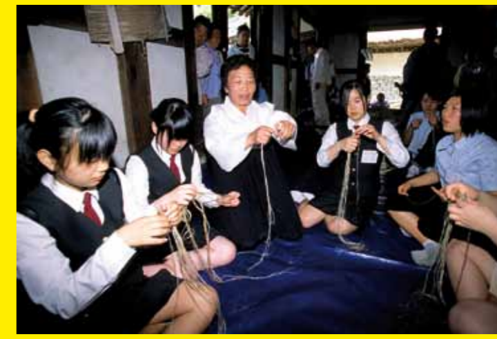
● RÉPUBLIQUE DE CORÉE – Le tissage du Mosi (ramie fine) dans la région de Hansan