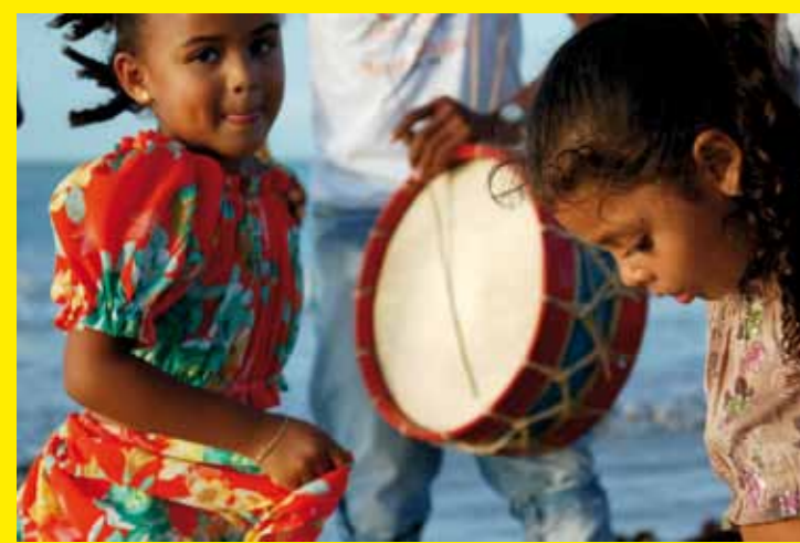
■ BRÉSIL – L'appel à projets du Programme national du patrimoine immatériel