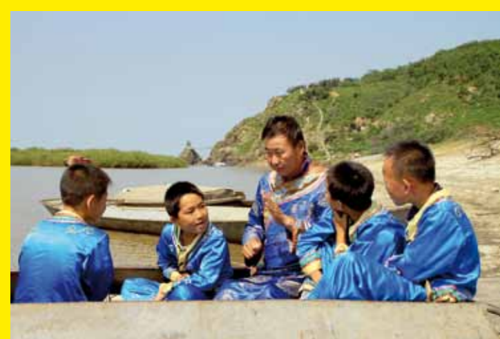
▲ CHINE – Le Yimakan, les récits oraux des Hezhen