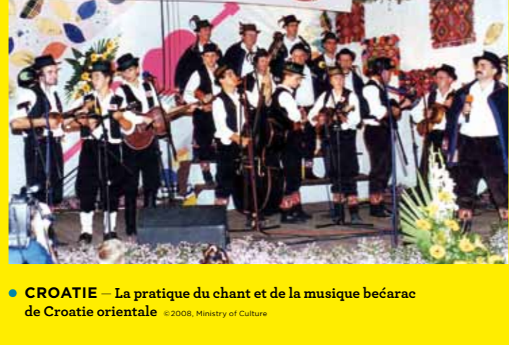
● CROATIE – La pratique du chant et de la musique bećarac de Croatie orientale