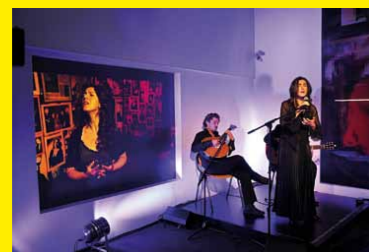
● PORTUGAL – Le Fado, chant populaire urbain du Portugal