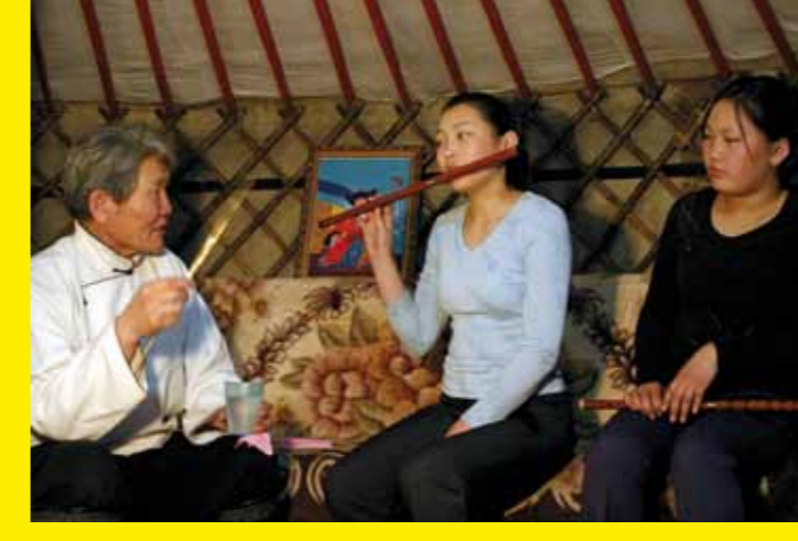
▲ MONGOLIE – La technique d'interprétation du chant long des joueurs de flûte limbe : la respiration circulaire