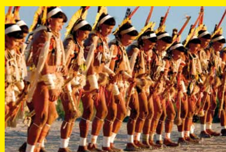
▲ BRÉSIL – Le Yaokwa, rituel du peuple Enawene Nawe pour le maintien de l'ordre social et cosmique