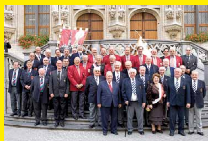
● BELGIQUE – Le répertoire du rituel des classes d'âge de Louvain © 2007, Annet Meuwert