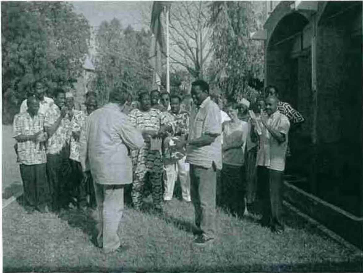
Le mandataire de l'Agence Intergouvernementale de la Francophonie remettant symboliquement le projet ARTO au Directeur du CELHTO