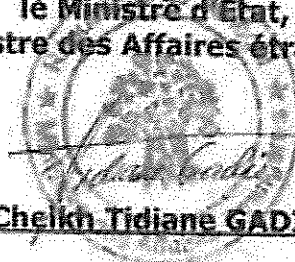
Cheikh Tidiane GADIO

Pour le Gouvernement de la République du Sénégal le Ministre d'Etat, Ministre des Affaires étrangères