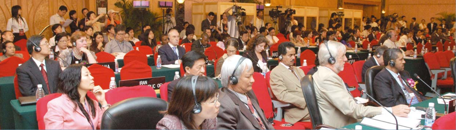
Kamati maalumu kati ya Serikali za Mataifa Wanachama wakati wa ufunguzi wa Kikao cha Kwanza kisichokuwa cha kawaida Chengdu, Uchina.

(yaendelea toka uk. 1) mbalimbali. Hata hivyo, majukumu ya mashirika hayo na uhusika wa jamii na wawakilishi wa jamii hizo katika utekelezaji wa Maafikiano yatajadiliwa zaidi katika kikao cha Tokyo.