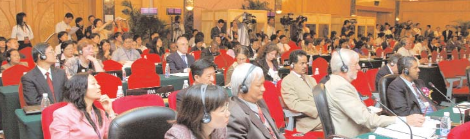
Открытие 1-й внеочередной сессии Межправительственного комитета в Чэнду, Китай

(Продолжение со с. 1.) Комитет также принял решение, что для поддержки и продвижения Конвенции нужна эмблема. Она усилит наглядность Конвенции, как это случилось со многими другими конвенциями и программами ЮНЕСКО. На следующей сессии Комитета в Токио, возможно, будет учреждена рабочая группа для организации открытого конкурса на создание дизайна эмблемы. Мы расскажем об этом в следующем выпуске Вестника .