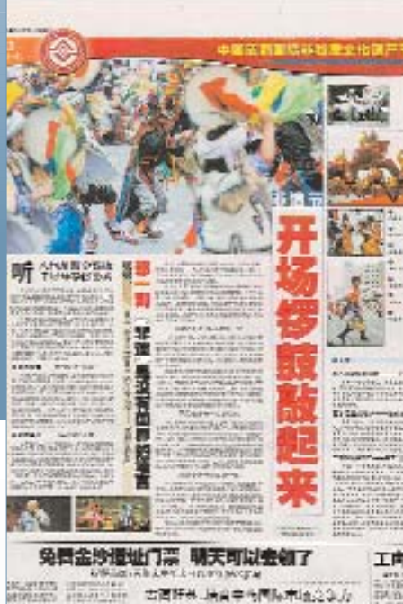
Материалы в местной прессе, посвященные первому Фестивалю нематериального культурного наследия

Работа Комитета над процессом номинирования и внесения в списки не прекратится после утверждения критериев. В сентябре 2007 г., на 2-й сессии в Токио, Комитет обсудит проект оперативных руководств, определяющих процедуры, подлежащие соблюдению, график подготовки и рассмотрения заявок, а также форматы, которые должны использовать заявители. Оперативные руководства, куда входят критерии, принятые в Чэнду, будут представлены на 2-й сессии Генеральной ассамблеи в июне 2008 г.