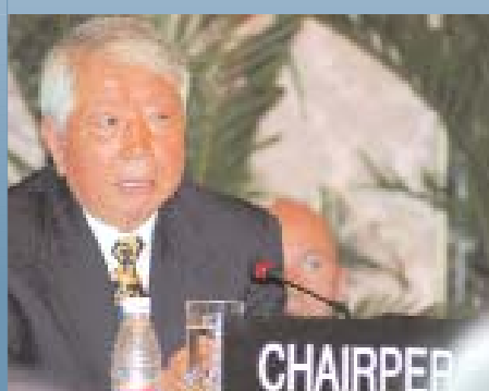
© Culture Department of Chengdu Municipality