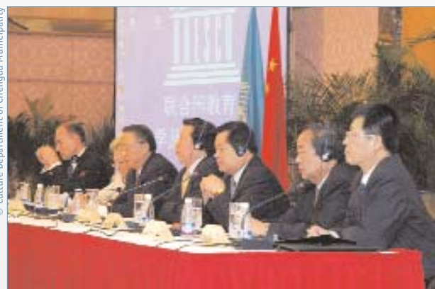
На открытии сессии присутствовали министр культуры Народной Республики Китай Сунь Цзячжен (4-й справа), губернатор провинции Сычуань Цзян Чжунфэн (3-й справа) и председатель Исполнительного Совета ЮНЕСКО и заместитель министра образования Чжан Синьшэн (3-й слева)