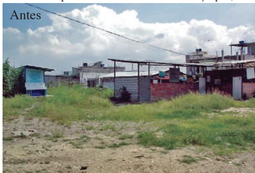
Escuela “República de El Salvador” Guayaquil, GUAYAS