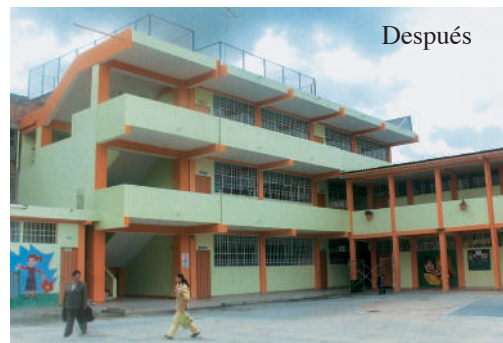
Escuela “Ignacio Martínez” San Pedro, TUNGURAHUA